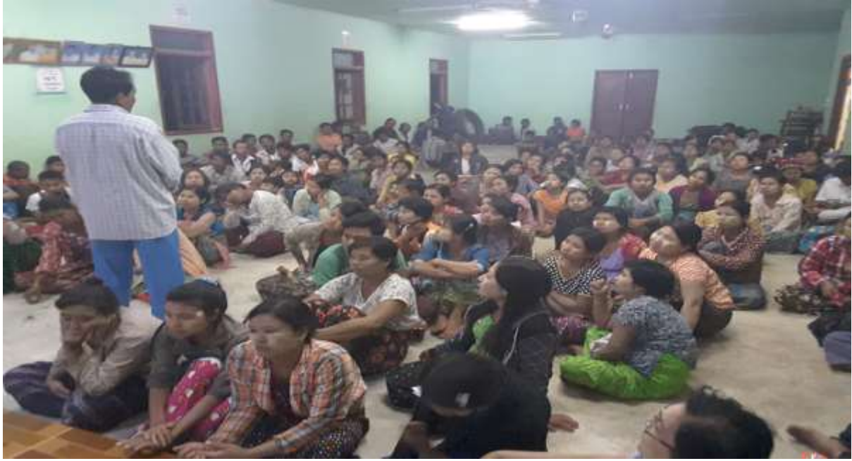
သာပေါင်းမြို့နယ်၊ လှေကြီးတက်အုပ်စု။ နံနံပင်ကုန်းကျေးရွာတွင် ဦးစားပေးများကို လိုက်လံတိုင်းတာနေပုံ