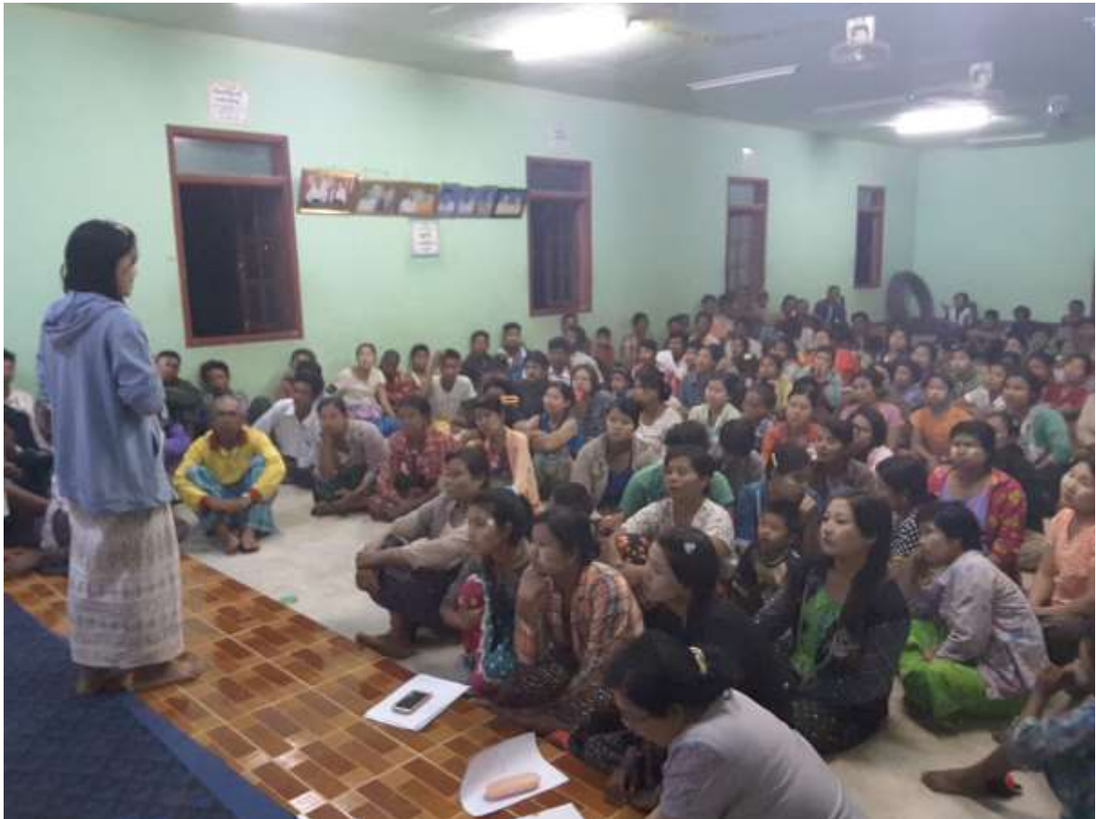
သာပေါင်းမြို့နယ်၊ လှေကြီးတက်အုပ်စု။ နံနံပင်ကုန်းကျေးရွာတွင် PRA Tools များ ပြုလုပ်နေပုံ