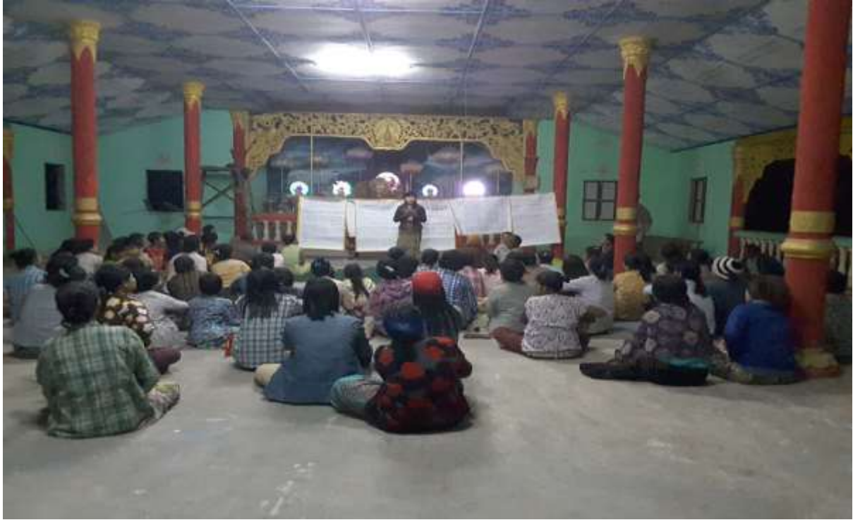
သာပေါင်းမြို့နယ်၊ လှေကြီးတက်အုပ်စု။ လှေကြီးတက်ကျေးရွာတွင် အစည်းအဝေး ပြုလုပ်နေပုံ