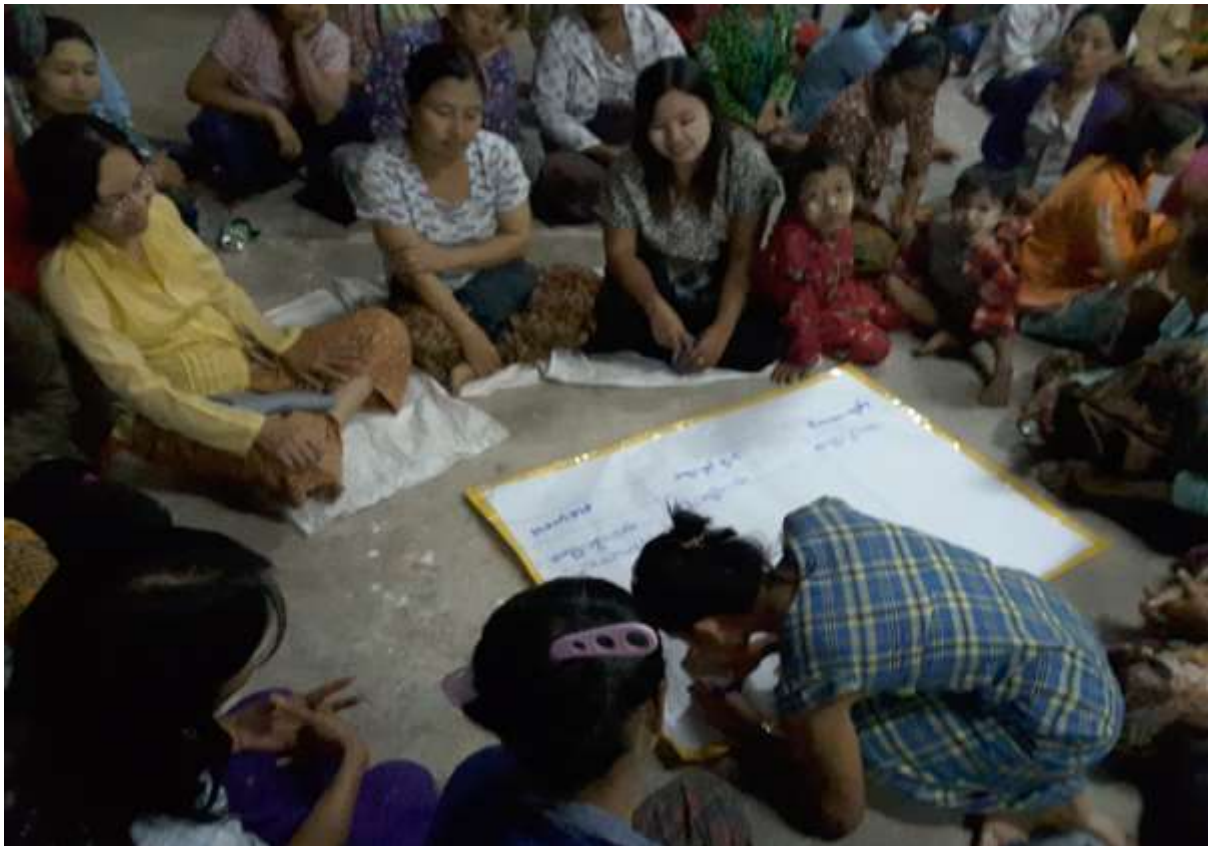
သာပေါင်းမြို့နယ်၊ လှေကြီးတက်အုပ်စု။ လှေကြီးတက်ကျေးရွာတွင် PRA Tools များ ပြုလုပ်နေပုံ