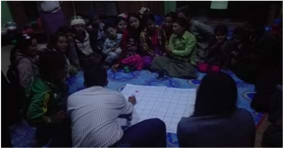
သာပေါင်းမြို့နယ်၊ ကွင်းကောက်ကျေးရွာအုပ်စု၊ အိုးဘိုကျေးရွာအစည်းအဝေးပြုလုပ်ပုံ

(အမျိုးသား/အမျိုးသမီးရွေးချယ်မှုအရေအတွက်)