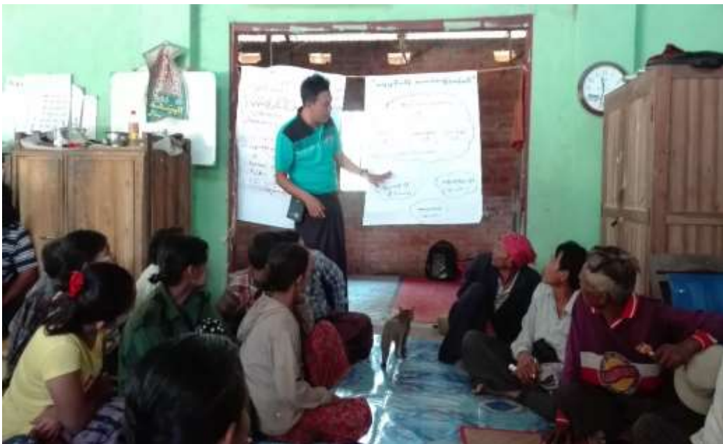
သာပေါင်းမြို့နယ်၊ ကွင်းကောက်ကျေးရွာအုပ်စု၊ အိုးဘိုကျေးရွာအစည်းအဝေးပြုလုပ်ပုံ