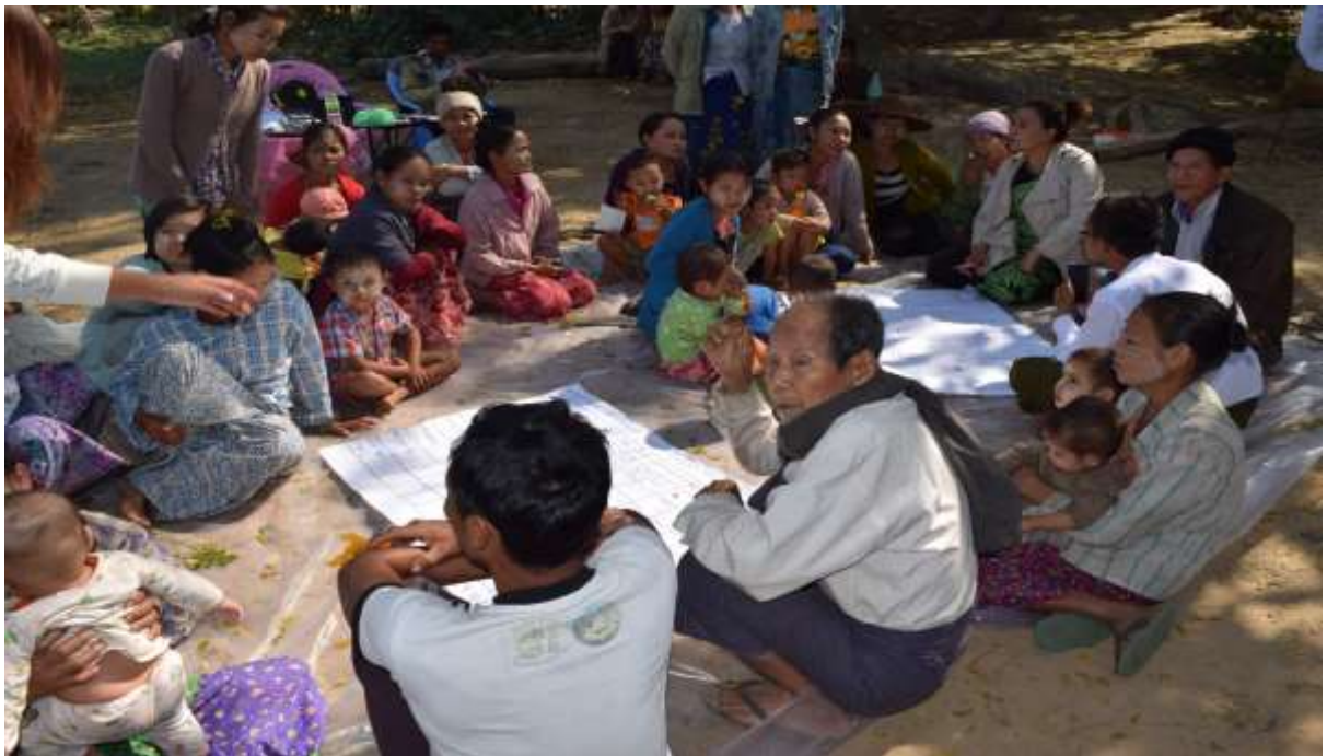
သာပေါင်းမြို့နယ်၊ ကွမ်းခြံကုန်းကျေးရွာတွင် PRA Tools များကို ရှင်းလင်းပုံ