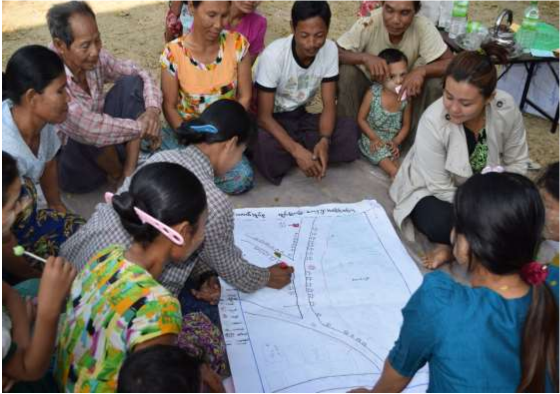
သာပေါင်းမြို့နယ်၊ကွင်းကောက်ကျေးရွာအုပ်စု ၊ကွမ်းခြံကုန်းကျေးရွာ အစည်းအဝေးပြုလုပ်ပုံ