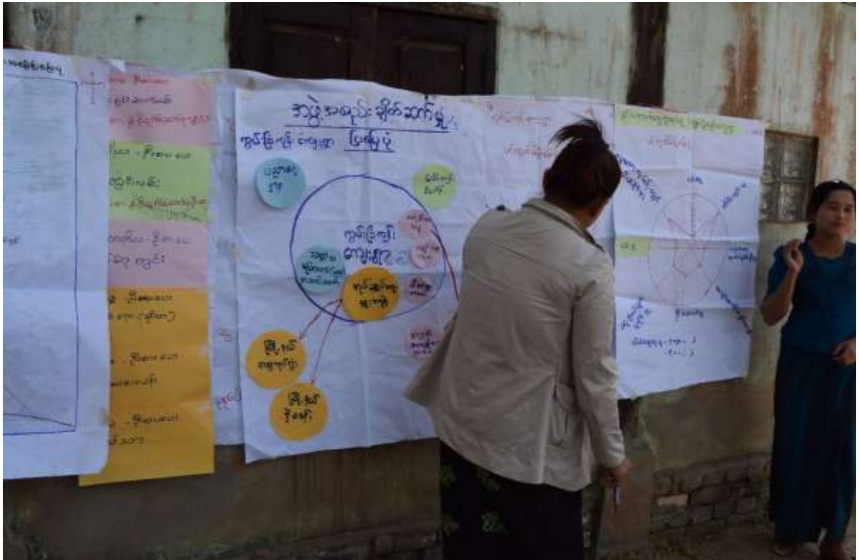
သာပေါင်းမြို့နယ်၊ ကွင်းကောက်ကျေးရွာအုပ်စု ၊ကွမ်းခြံကုန်းကျေးရွာတွင် အစည်းအဝေးပြုလုပ်ပုံ