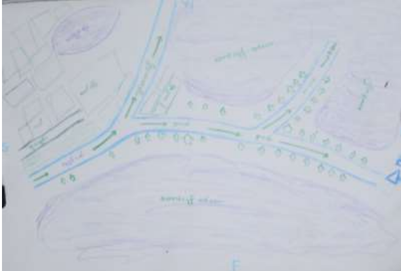
ကျေးရွာအခြေပြမြေပုံ