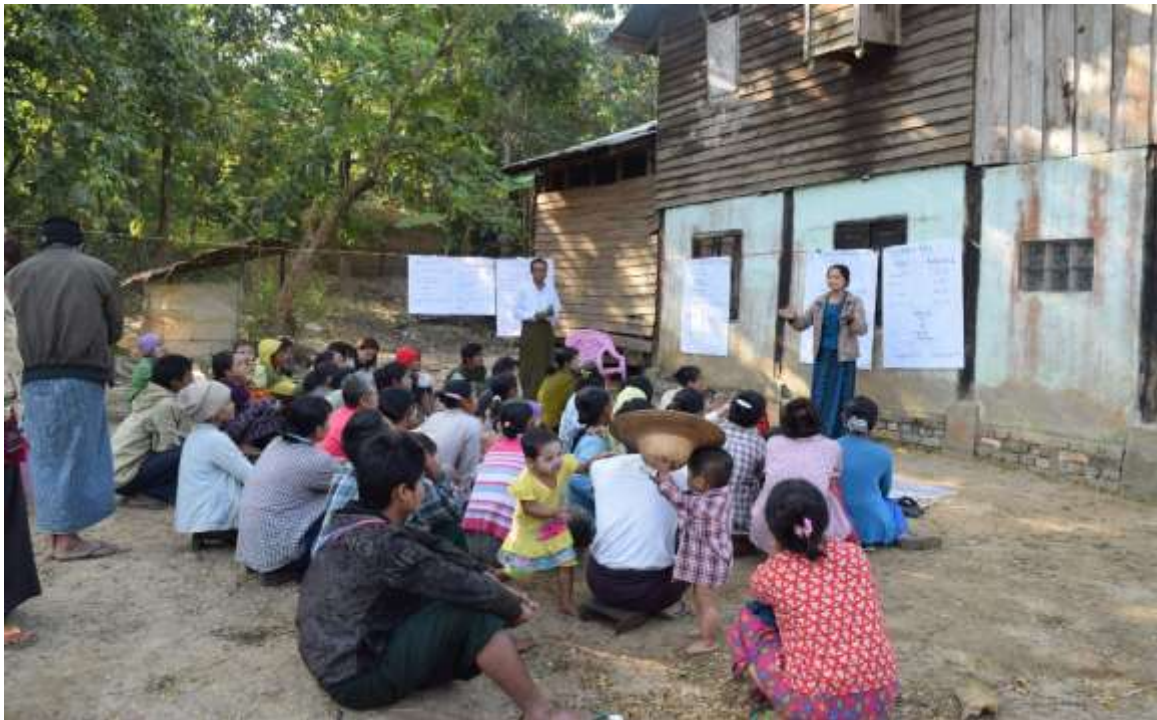
သာပေါင်းမြို့နယ်၊ ဘောတလင်းကျေးရွာတွင် စီမံကိန်းအကြောင်းရှင်းပြနေပုံ