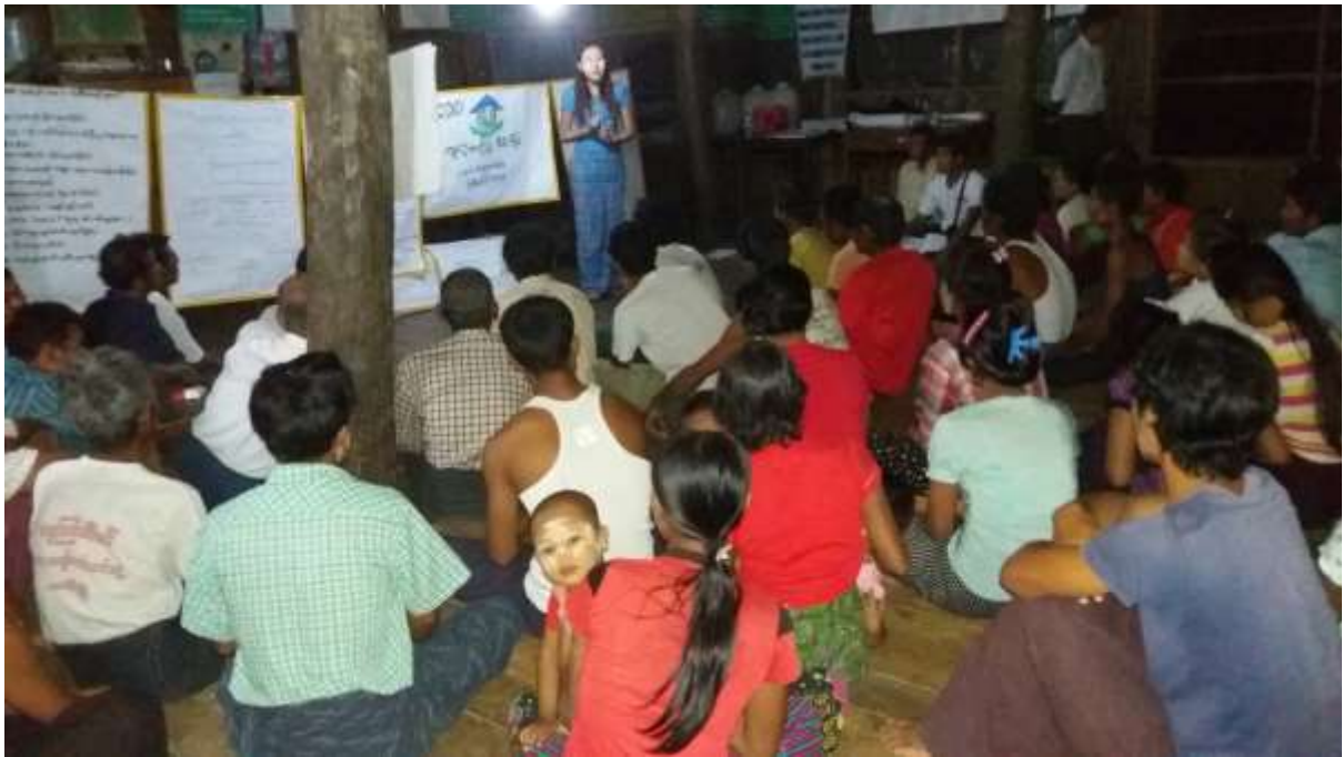
သာပေါင်းမြို့နယ်၊ရွှေဇံအိုးကျေးရွာအုပ်စု၊ ကြက်ပေါင်စမ်းကျေးရွာတွင် PRA Tools များရေးဆွဲပုံ