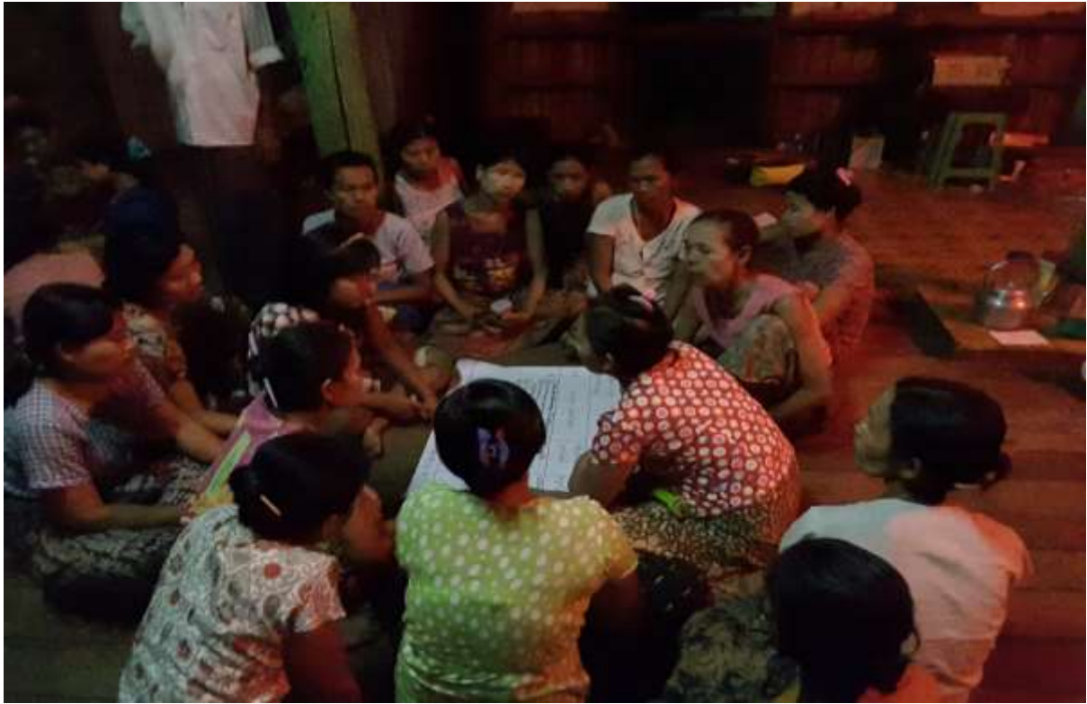
သာပေါင်းမြို့နယ်၊ရွှေဇံအိုးကျေးရွာအုပ်စု၊ ကြက်ပေါင်စမ်းကျေးရွာတွင် PRA Tools များရေးဆွဲပုံ