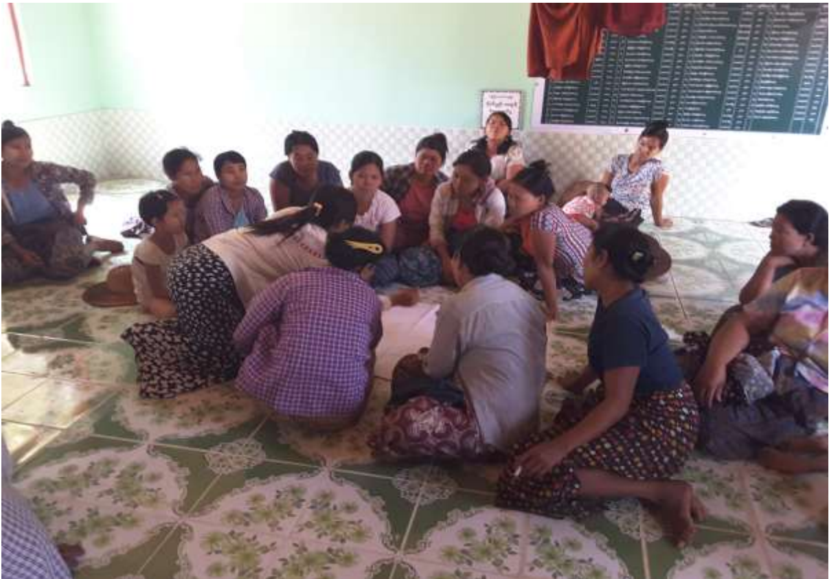
သာပေါင်းမြို့နယ်၊ အောင်တပ်ကျေးရွာအုပ်စု၊ အောင်တပ်ကျေးရွာတွင် PRA Tools များ ပြုလုပ်ပုံ