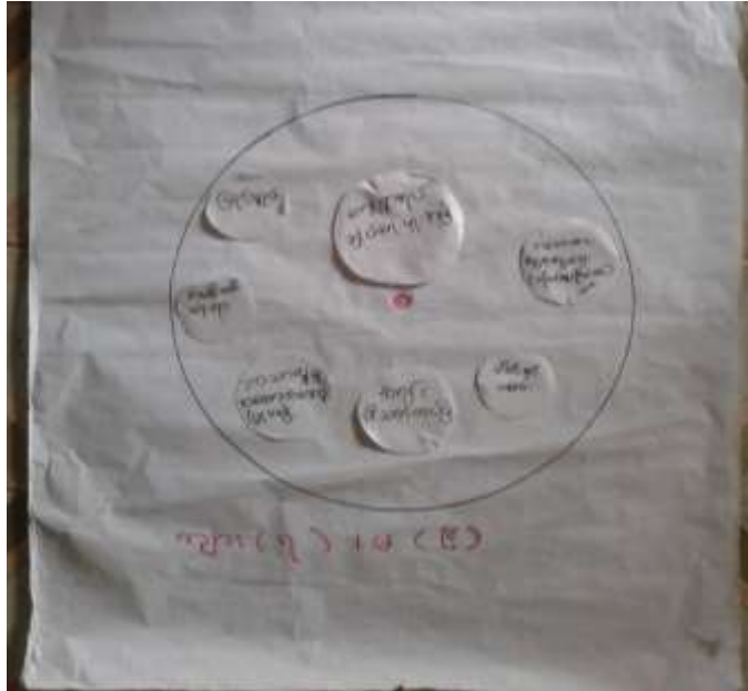
သုံးသပ်ချက်

အဖွဲ့အစည်းချိတ်ဆက်ပြဇယားကိုအောင်တပ်၊ဘုန်းကြီးကျောင်းတွင် (၁၈.၂.၂၀၁၇)ရက်နေ့တွင် ရေးဆွဲဆွေးနွေးရာ ကျေးရွာအတွင်းအုပ်ချုပ်ရေးနှင့်ပတ်သက်၍ ရာအိမ်မှူး၊ ကျေးရွာအုပ်ချုပ်ရေးမှူးနှင့် မြို့နယ်အုပ်ချုပ်ရေးမှူး၊ မြို့နယ်ရဲစခန်းတို့နှင့် ချိတ်ဆက်ဆောင်ရွက်ပါသည်။