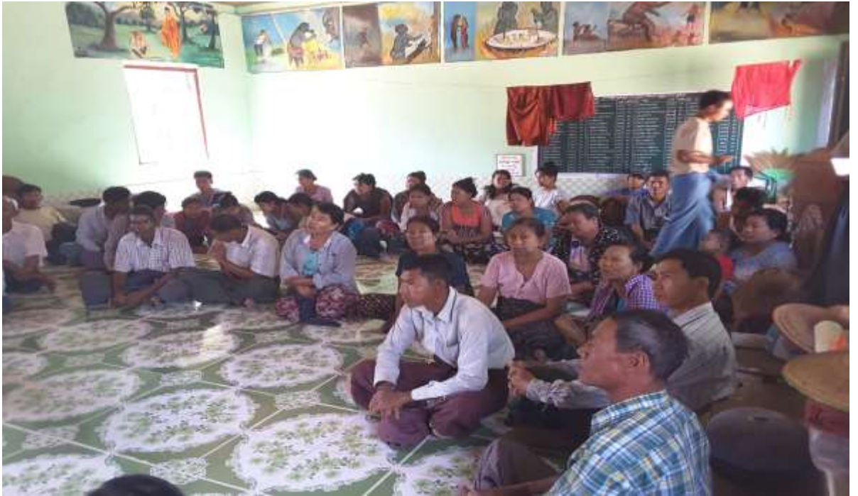
သစ်တောရေးရာအဖွဲ့အစည်းများ၊ အောင်တင်ကျေးရွာအုပ်စုအစည်းအဝေးကျင်းပနေပုံ