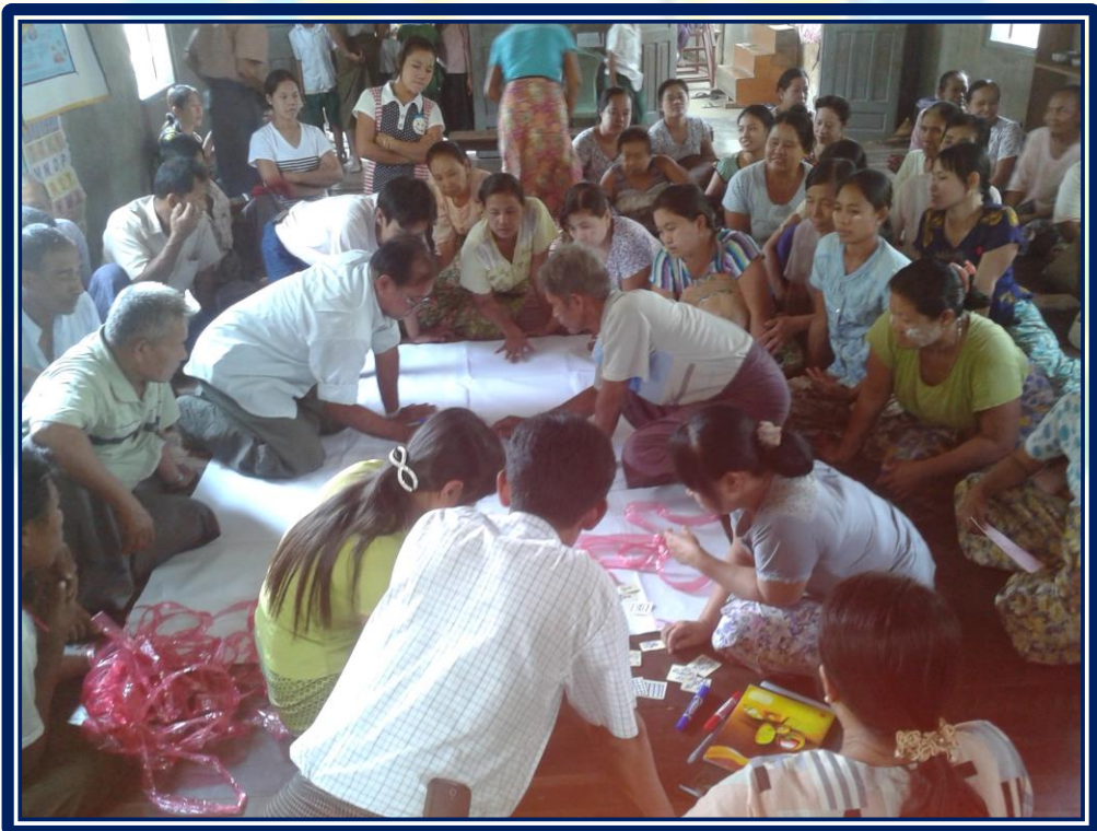
လူထုဗဟိုပြုစီမံကိန်းလုပ်ငန်းအကောင်အထည်ဖော်မှုအစီအစဉ် (ကလေးကျေးရွာအုပ်စု၊ ကလေးကျေးရွာ)