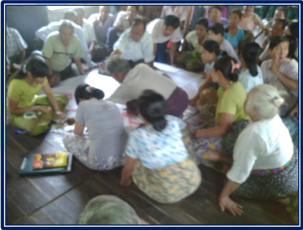
လူထုဗဟိုပြုစီမံကိန်းလုပ်ငန်းအကောင်အထည်ဖော်မှုအစီအစဉ် (ကလေးကျေးရွာအုပ်စု၊ ကလေးကျေးရွာ)