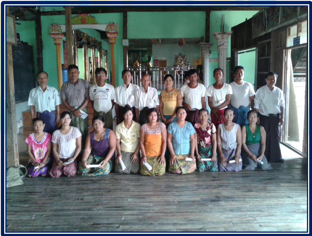
လူထုဗဟိုပြုစီမံကိန်းလုပ်ငန်းအကောင်အထည်ဖော်မှုအစီအစဉ် (ကလေးကျေးရွာအုပ်စု၊ အပြိုင်ကျေးရွာ)