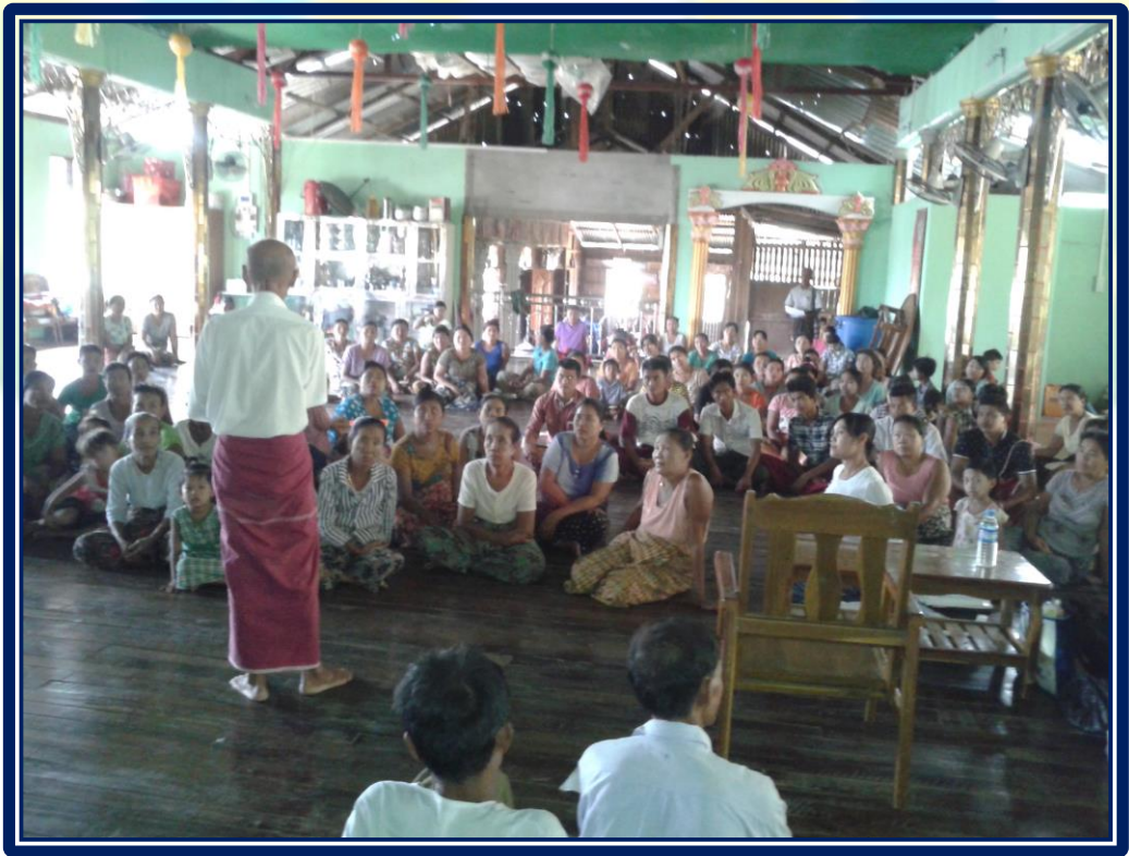
လူထုဗဟိုပြုစီမံကိန်းလုပ်ငန်းအကောင်အထည်ဖော်မှုအစီအစဉ် (ကလေးကျေးရွာအုပ်စု၊ အပြိုင်ကျေးရွာ)