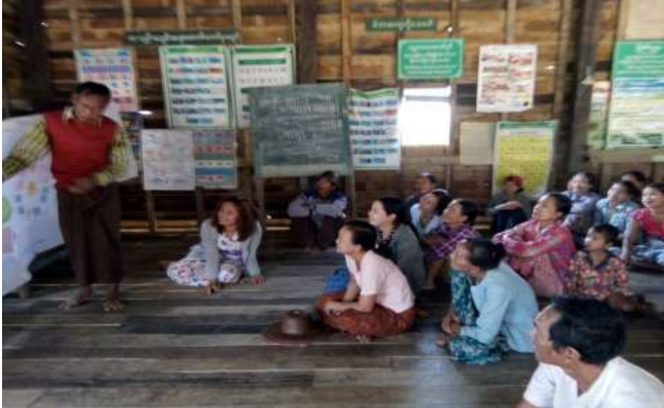
ဧရာဝတီတိုင်းဒေသကြီး၊ သာပေါင်းမြို့နယ်၊ ကညင်ပင်ကျေးရွာအုပ်စု၊ ဆည်ကြီးကျေးရွာတွင် အစည်းအဝေးပြုလုပ်ပုံ