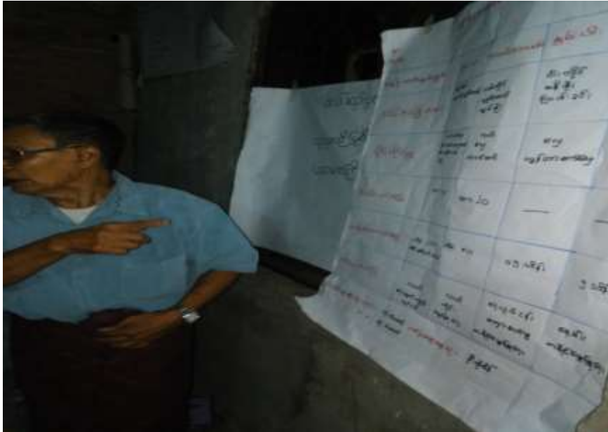
ဇရာဂတီတိုင်းဒေသကြီး၊ သာပေါင်းမြို့နယ်၊ ကညင်ပင်ကျေးရွာအုပ်စု၊ ဆည်ကြီးကျေးရွာတွင် အစည်းအဝေးပြုလုပ်ပုံ