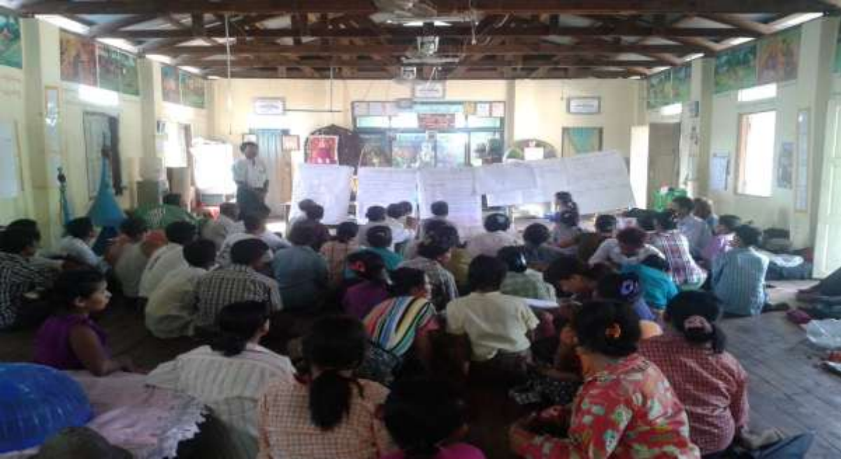
သာပေါင်းမြို့နယ်၊ ငဝန်ကြို့ကုန်းကျေးရွာအုပ်စု၊ ကွမ်းခြံကုန်းကျေးရွာတွင် အစည်းအဝေးပြုလုပ်ပုံ