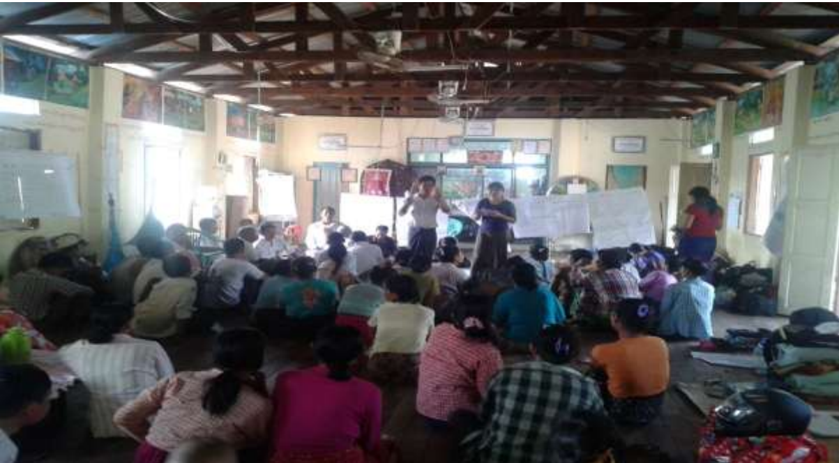
သာပေါင်းမြို့နယ်၊ ငဝန်ကြို့ကုန်းကျေးရွာအုပ်စု၊ ကွမ်းခြံကုန်းကျေးရွာတွင် PRA Tools များကို ရှင်းလင်းပုံ