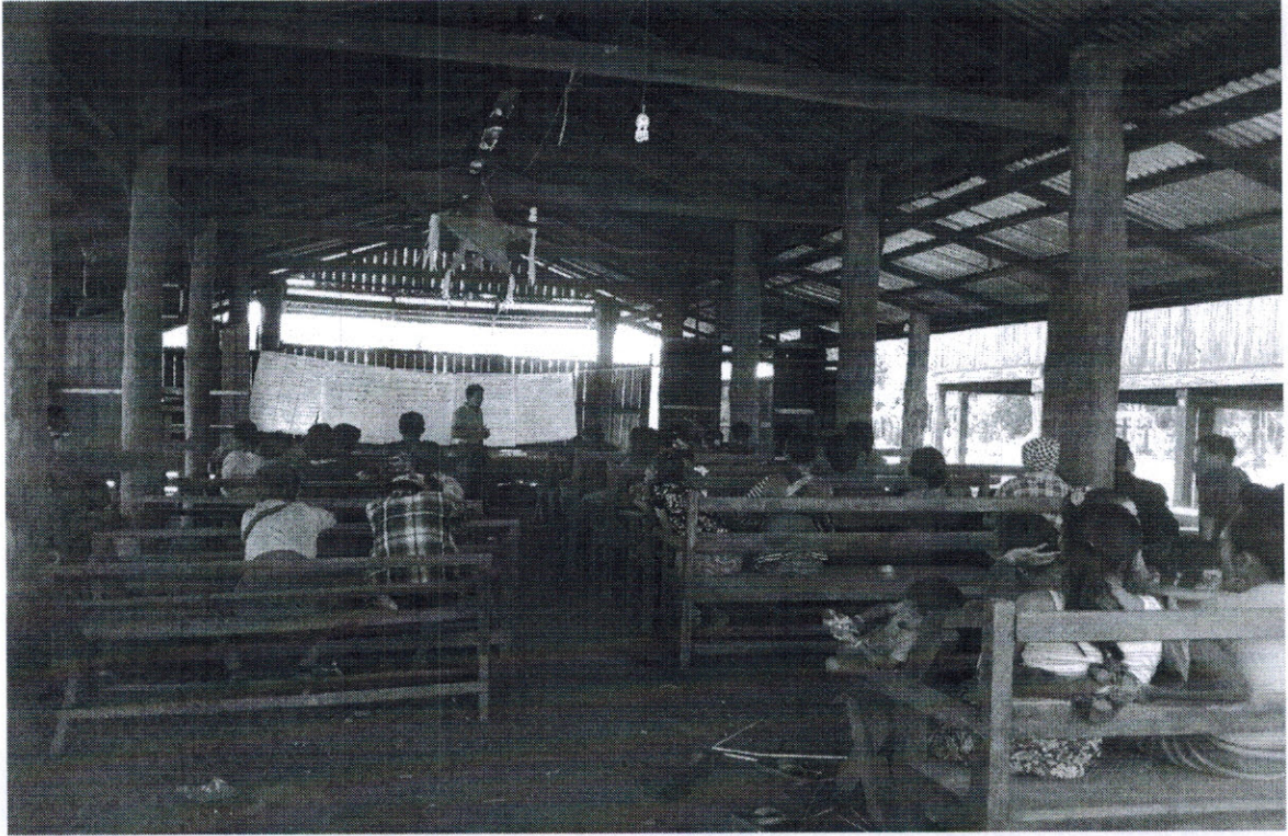
ကျေးရွာဖွံ့ဖြိုးရေးအစီအစဉ်ဆောင်ရွက်မှုမှတ်တမ်းခါတ်ပုံများ