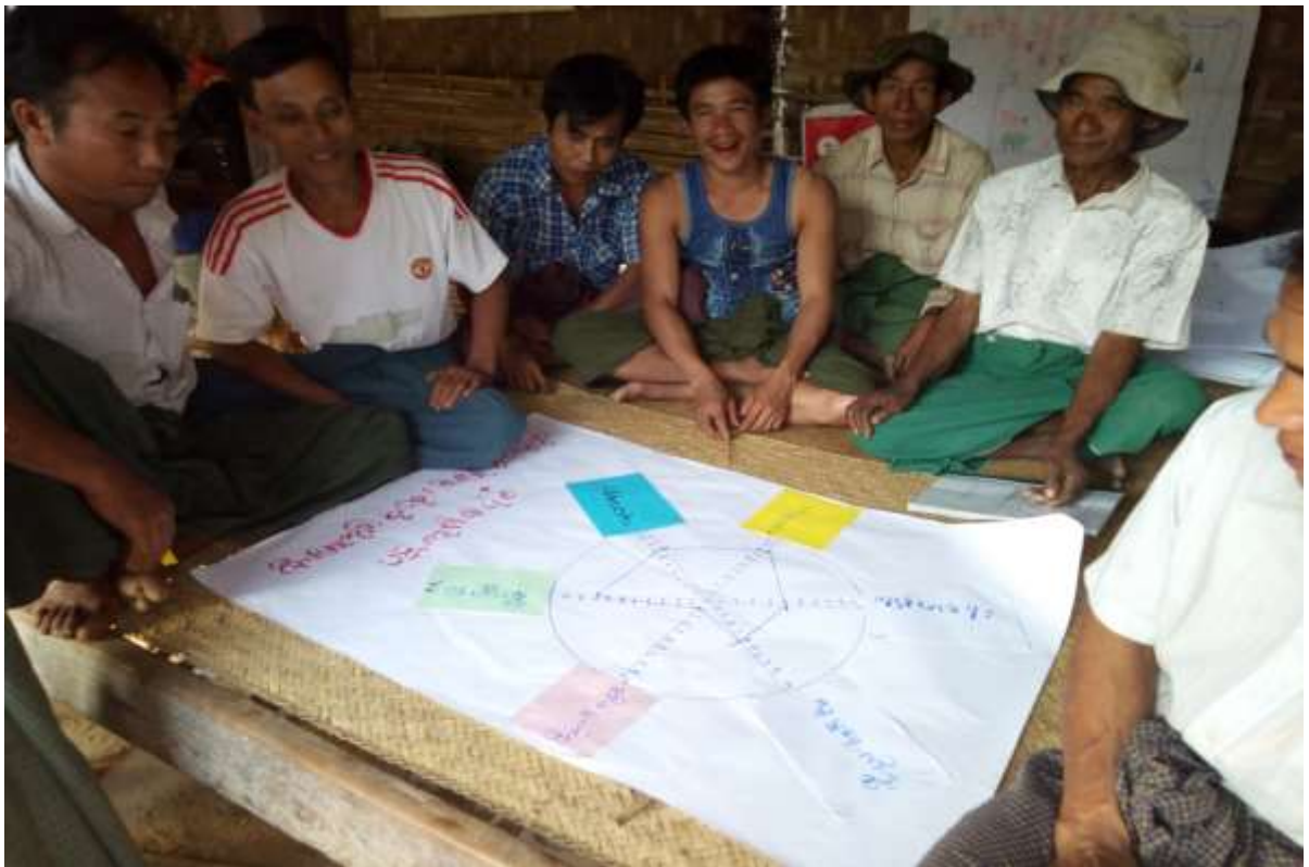
ပုံ.....PRA လုပ်ငန်းစဉ်များပြုလုပ်နေပုံ