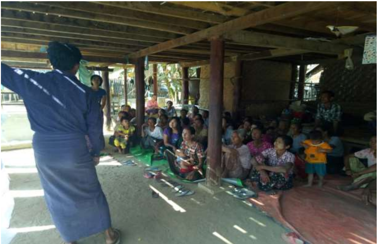
ပုံ.... စီမံကိန်းမိတ်ဆက်အစည်းအဝေး