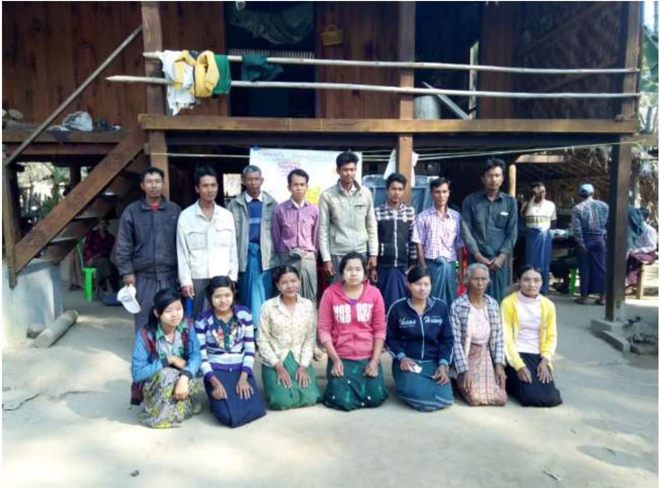
ပုံ.... ကျေးရွာစီထောက်ကော်မတီအဖွဲ့.