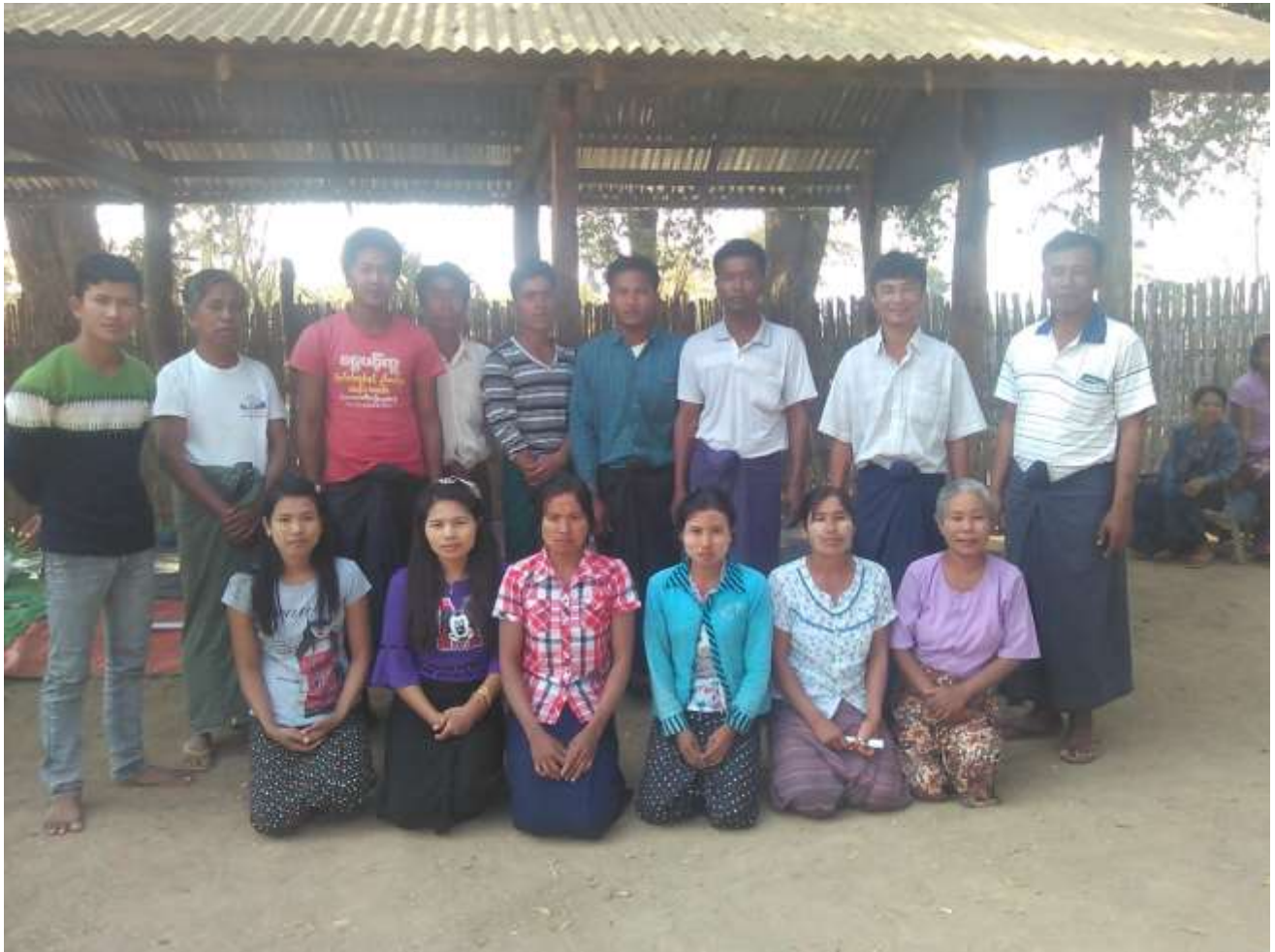
ပုံ..... ကျေးရွာစီ-ထောက် ကော်မတီ