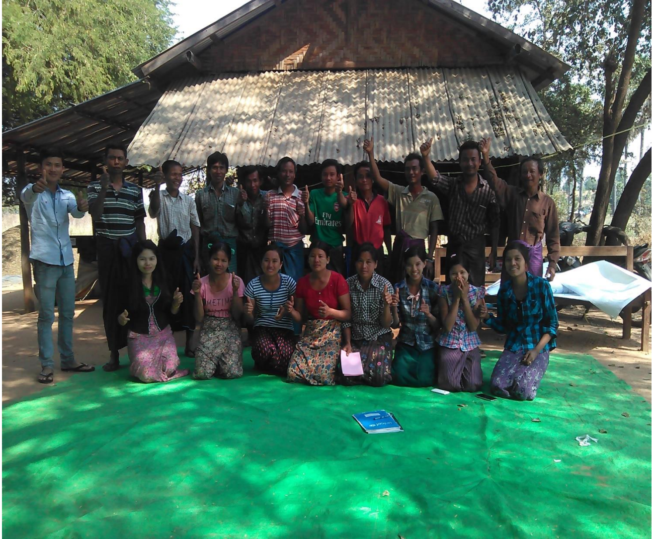
ပုံ..... ကျေးရွာစီ-ထောက် ကော်မတီ