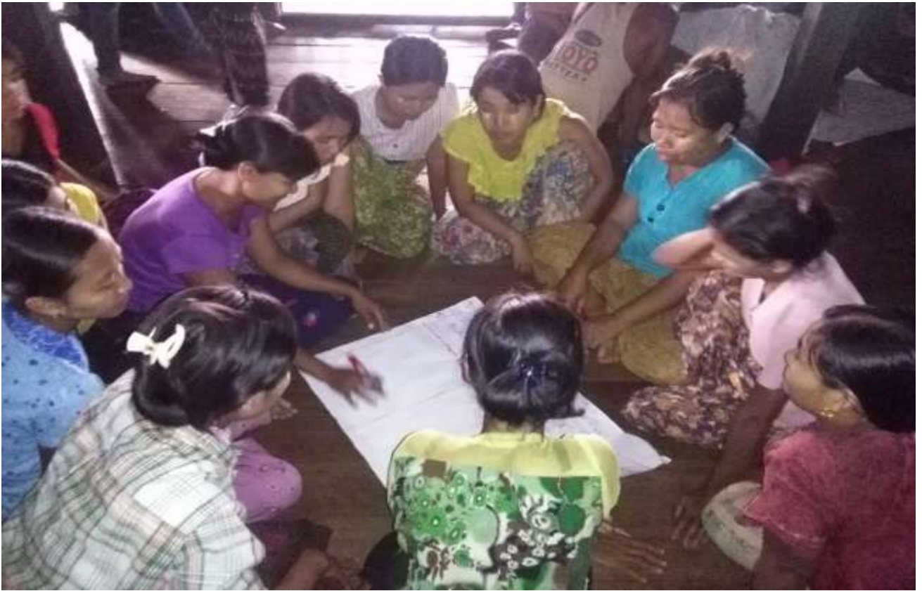
သာပေါင်းမြို့နယ်၊ ရွှေညောင်ပင်ကျေးရွာအုပ်စု၊ ရေကျော်လေးကျေးရွာတွင် PRA Tools များ ပြုလုပ်ပုံ