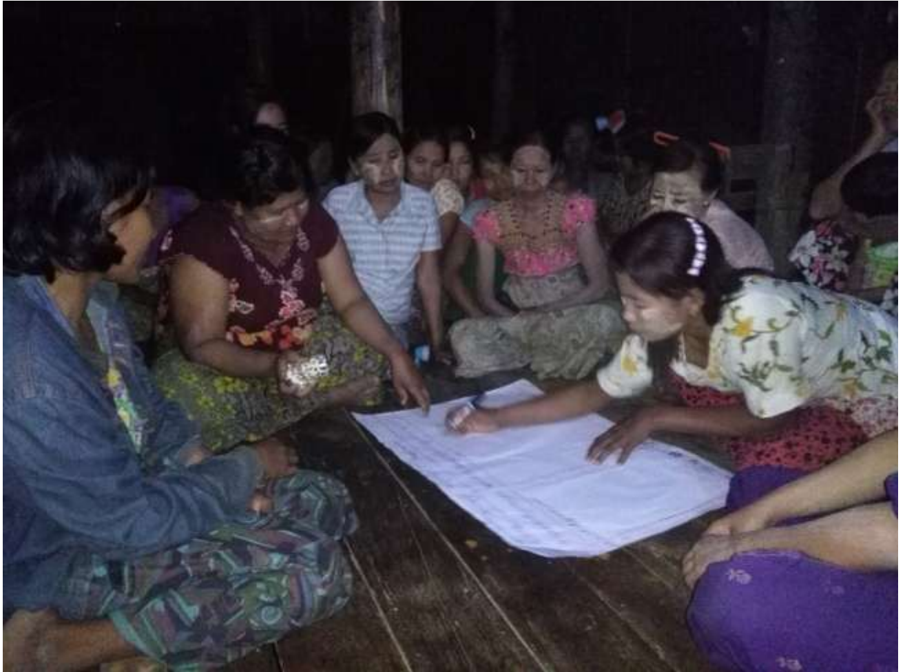
သာပေါင်းမြို့နယ်၊ ရွှေညောင်ပင်ကျေးရွာအုပ်စု၊ ရေကျော်လေးကျေးရွာတွင် PRA Toolsများပြုလုပ်ပုံ