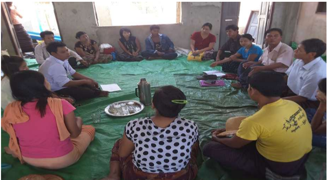
သာပေါင်းမြို့နယ်၊ ရွှေညောင်ပင်ကျေးရွာတွင်အုပ်စု အစည်းအဝေးပြုလုပ်ပုံ