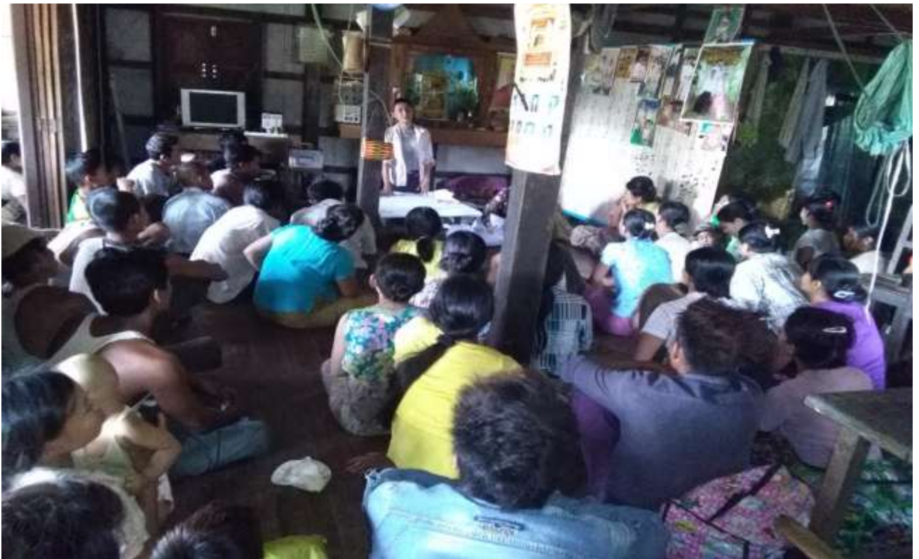
သာပေါင်းမြို့နယ်၊ ရွှေညောင်ပင်ကျေးရွာအုပ်စု၊ ဘုရားငူကျေးရွာတွင်အစည်းအဝေးပြုလုပ်ပုံ