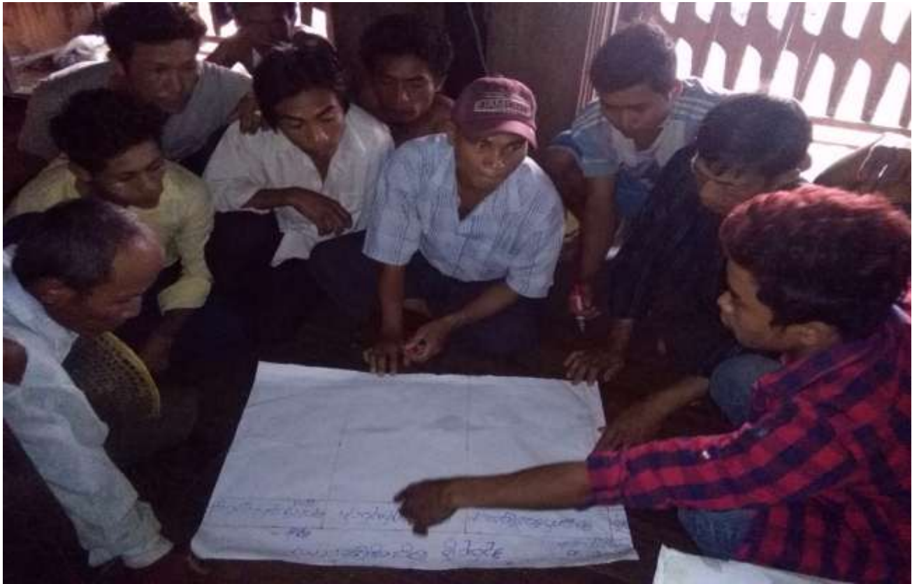
သာပေါင်းမြို့နယ်၊ ရွှေညောင်ပင်ကျေးရွာအုပ်စု၊ ရွှေညောင်ပင်ကျေးရွာတွင် PRA Toolsများပြုလုပ်ပုံ