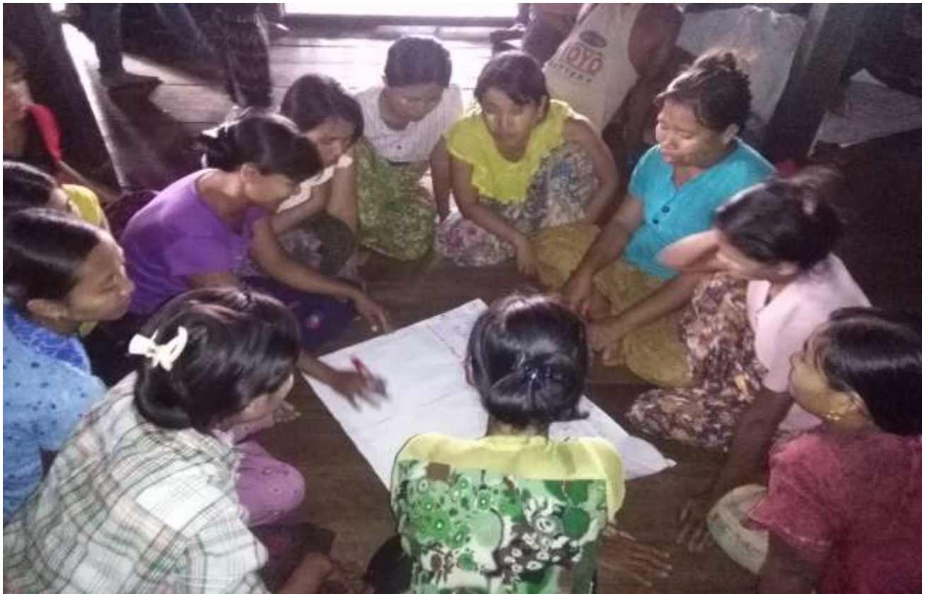
သဘာဝပေါင်းစုံဖွံ့ဖြိုးရေး၊ ရွှေညောင်ပင်ကျေးရွာအုပ်စု၊ ရွှေညောင်ပင်ကျေးရွာတွင် PRA Tools များ ပြုလုပ်ပုံ