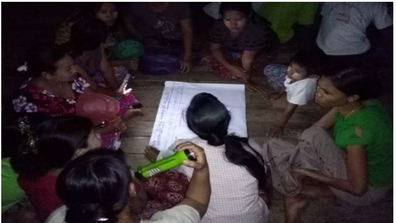
သာပေါင်းမြို့နယ်၊ ရွှေညောင်ပင်ကျေးရွာအုပ်စု၊ ရွှေညောင်ပင်ကျေးရွာတွင်အစည်းအဝေးပြုလုပ်ပုံ