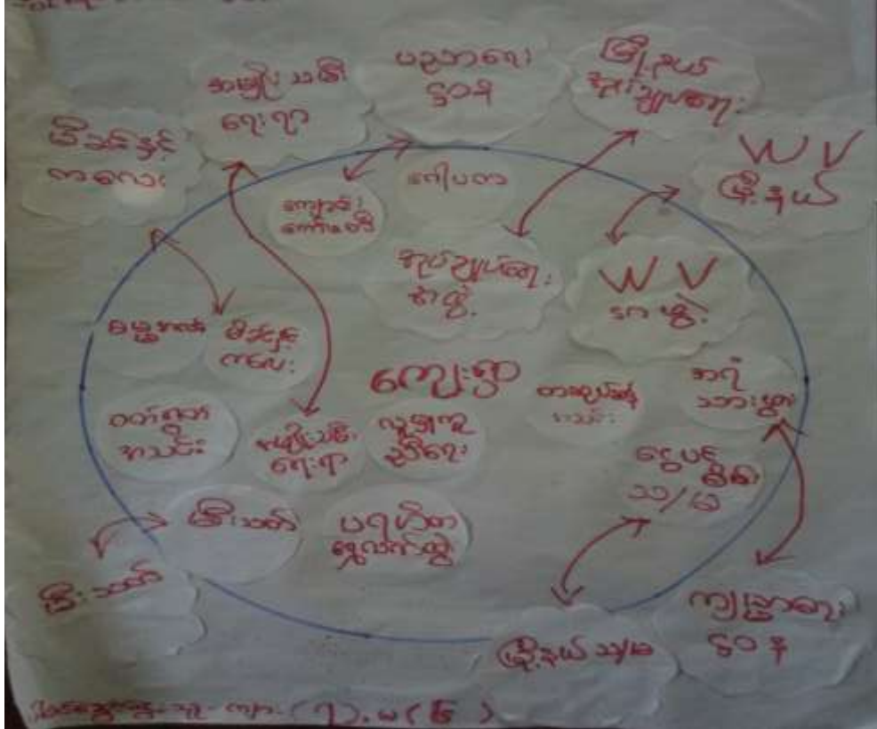
သုံးသပ်ချက်

အဖွဲ့အစည်းချိတ်ဆက်ပြဇယားကို ရွှေညောင်ပင်ကျေးရွာအုပ်ချုပ်ရေးမှူးရုံးတွင်(၂၅.၁.၂၀၁၇)ရက်နေ့တွင် ရေးဆွဲဆွေးနွေးရာကျေးရွာအတွင်းအုပ်ချုပ်ရေးနှင့်ပတ်သက်၍ရာအိမ်မှူး၊ကျေးရွာအုပ်ချုပ်ရေးမှူးနှင့်မြို့နယ်အုပ်ချုပ်ရေးမှူး၊ မြို့နယ်ရဲစခန်းတို့နှင့် ချိတ်ဆက်ဆောင်ရွက်ပါသည်။