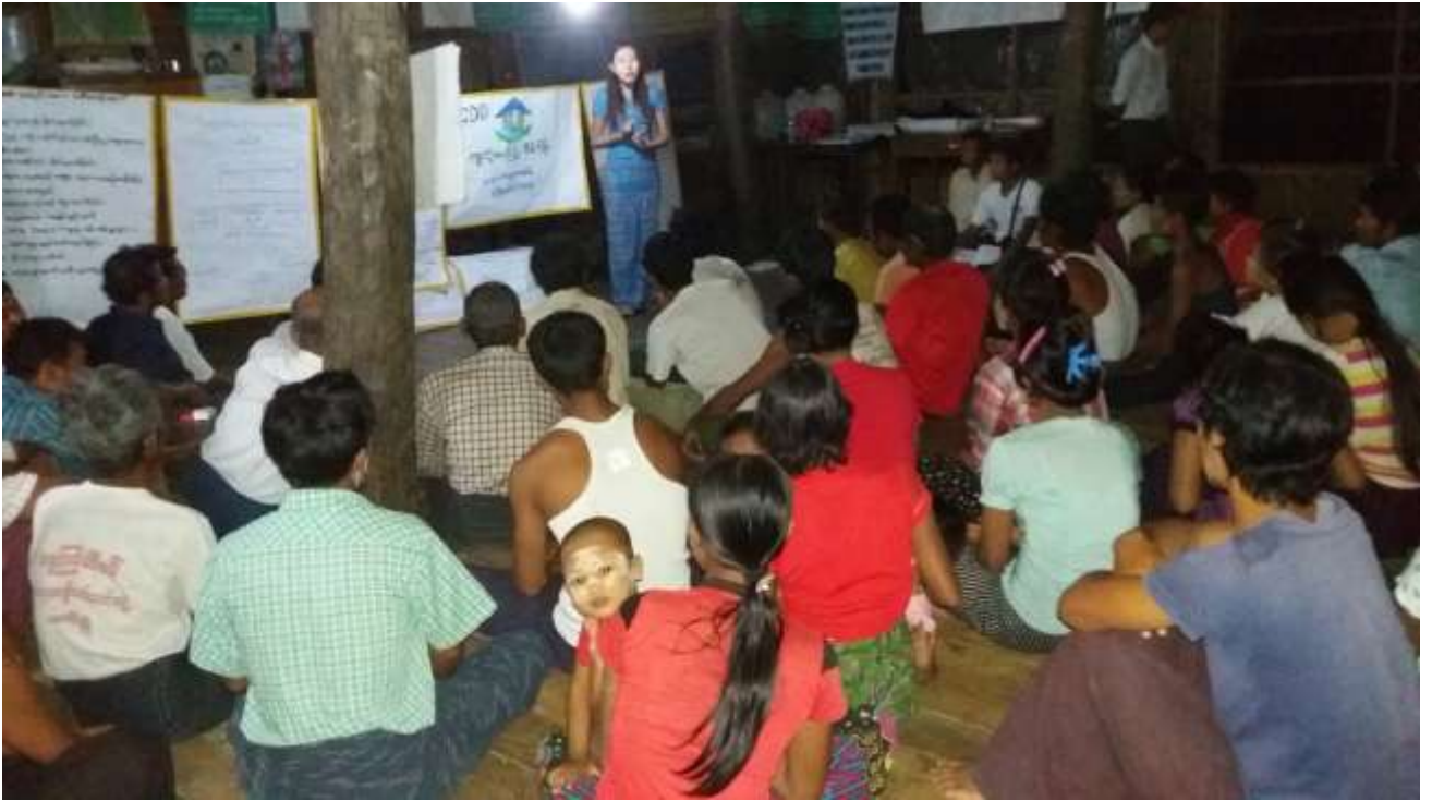
သာပေါင်းမြို့နယ်၊ ရွှေညောင်ပင်ကျေးရွာအုပ်စု၊ ရွှေညောင်ပင်ကျေးရွာတွင်အစည်းအဝေးပြုလုပ်ပုံ