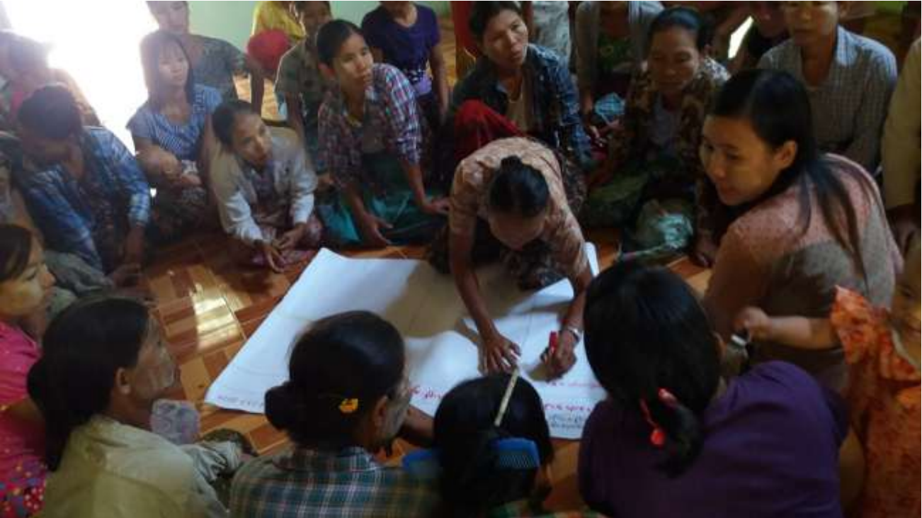
သာပေါင်းမြို့နယ်၊ ရှင်ကြီးပျောက်ကျေးရွာအုပ်စု၊ ကညင်ကုန်းကျေးရွာတွင် PRA Toolsများပြုလုပ်ပုံ