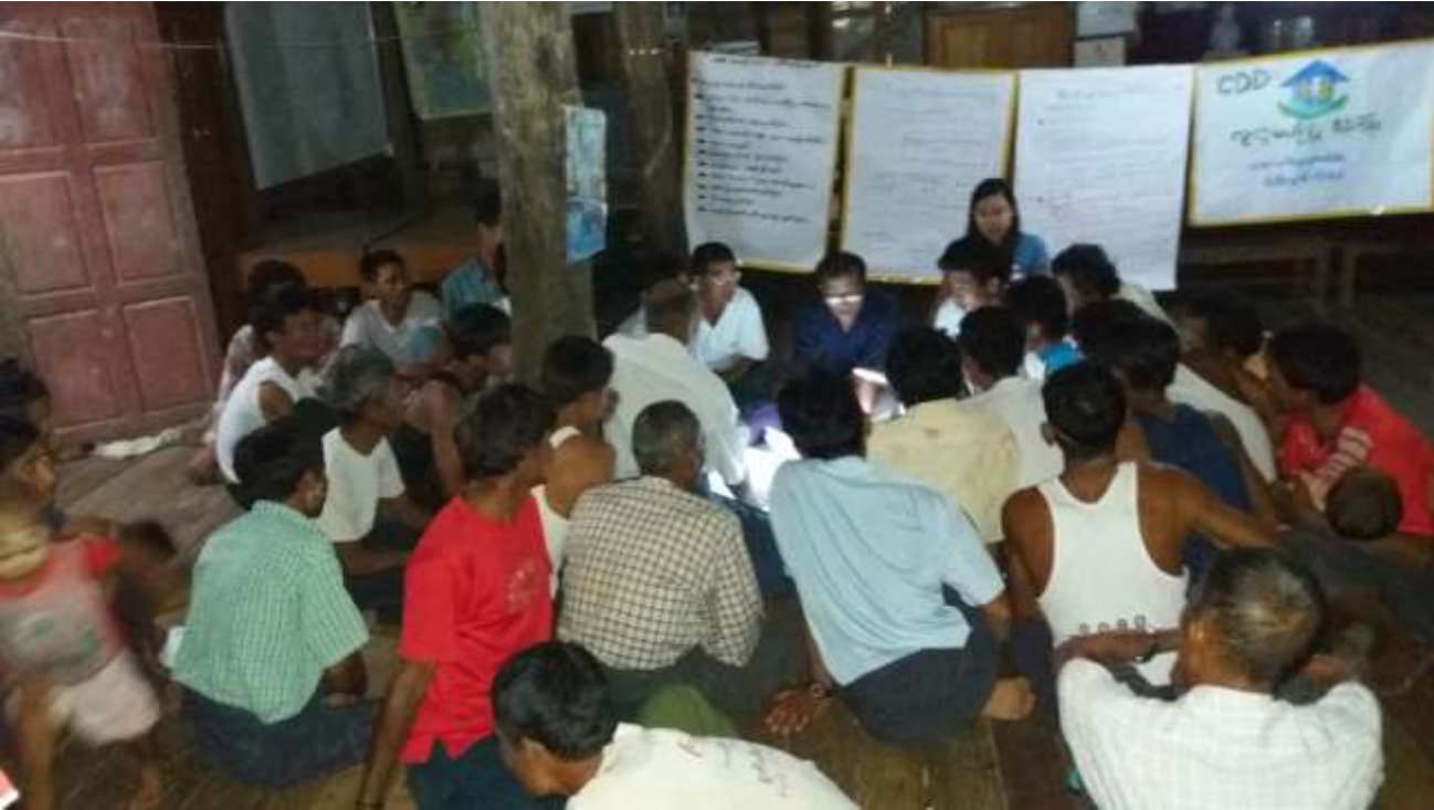
သာပေါင်းမြို့နယ်၊ ရှင်ကြီးပျောက်ကျေးရွာအုပ်စု၊ ကညင်ကုန်းကျေးရွာတွင် PRA Tools များ ပြုလုပ်ပုံ