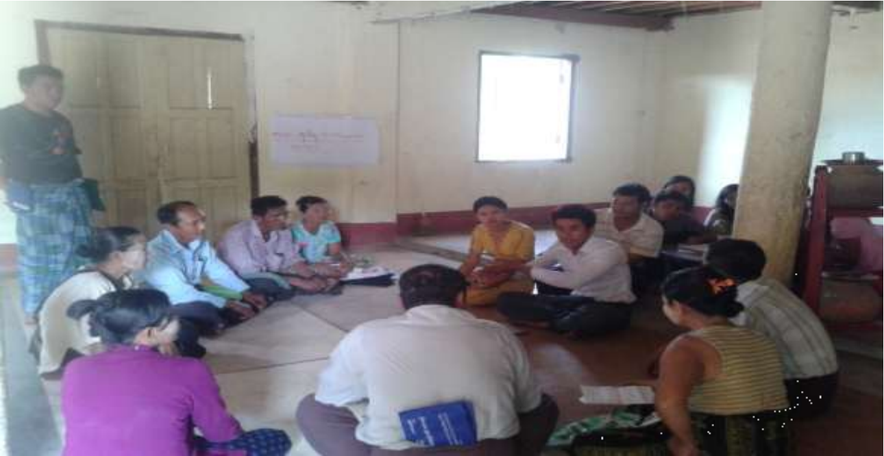
သာပေါင်းမြို့နယ်၊ ရှင်ကြီးပျောက်ကျေးရွာအုပ်စု၊ မအူပင်ဒေါင့်ကျေးရွာတွင်အုပ်စု အစည်းအဝေးပြုလုပ်ပုံ