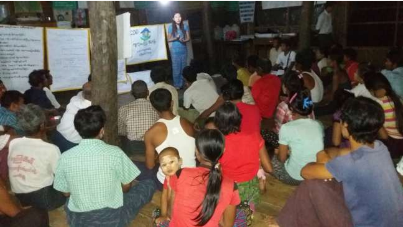
သာပေါင်းမြို့နယ်၊ ရှင်ကြီးပျောက်ကျေးရွာအုပ်စု၊ ကညင်ကုန်းကျေးရွာတွင် အစည်းအဝေးပြုလုပ်ပုံ