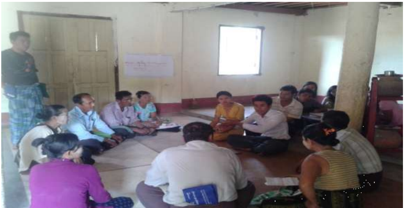
သာပေါင်းမြို့နယ်၊ ရှင်ကြီးပျောက်ကျေးရွာအုပ်စု၊ မအူပင်ဒေါင့်ကျေးရွာတွင်အုပ်စု အစည်းအဝေးပြုလုပ်ပုံ