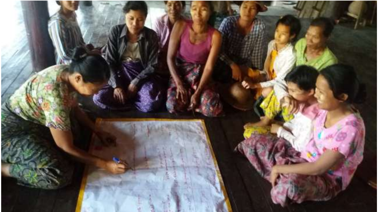
သာပေါင်းမြို့နယ်၊ ရှင်ကြီးပျောက်ကျေးရွာအုပ်စု၊ ရှင်ကြီးပျောက်ကျေးရွာတွင် PRA Tools များ ပြုလုပ်ပုံ