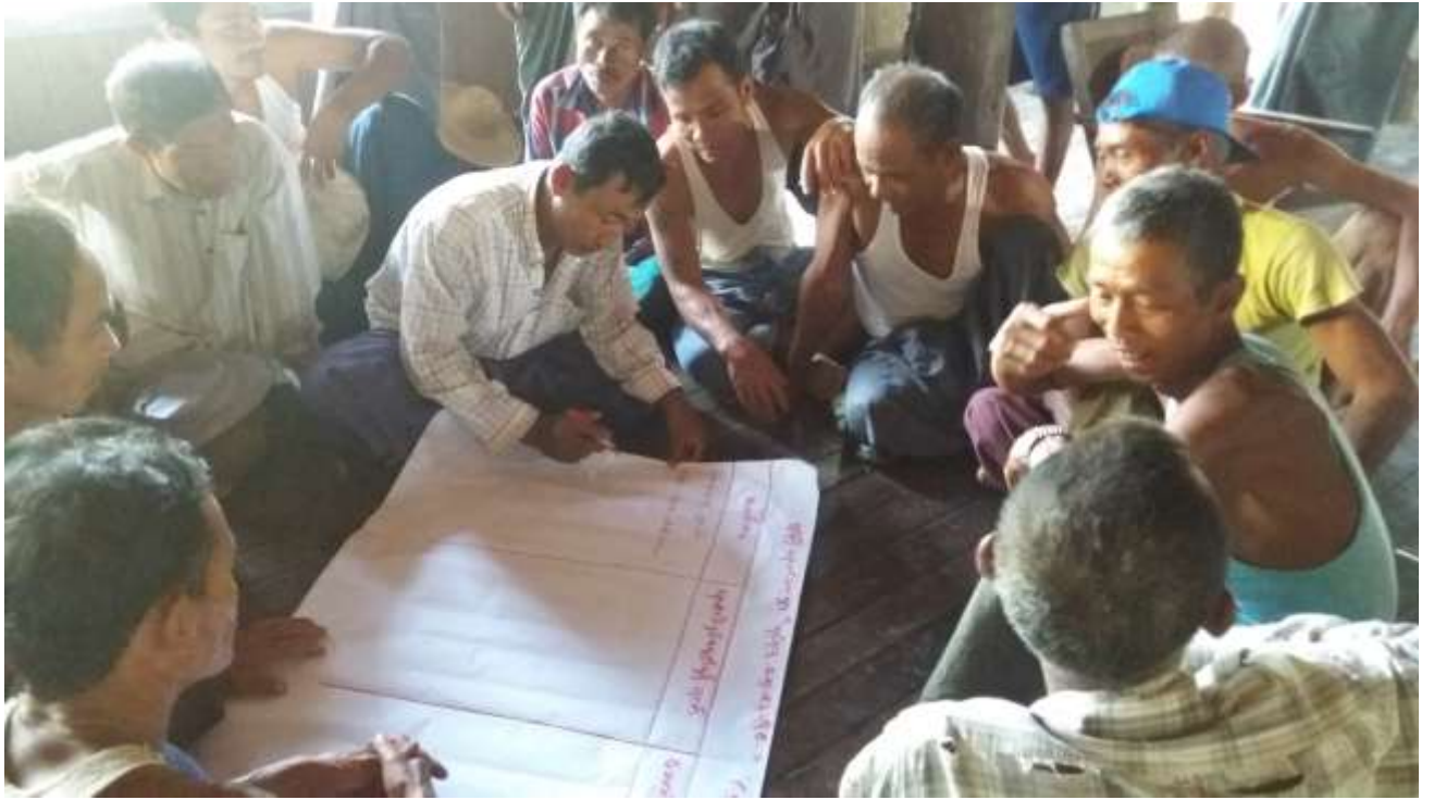
သာပေါင်းမြို့နယ်၊ ရှင်ကြီးပျောက်ကျေးရွာအုပ်စု၊ ရှင်ကြီးပျောက်ကျေးရွာတွင် PRA Toolsများပြုလုပ်ပုံ