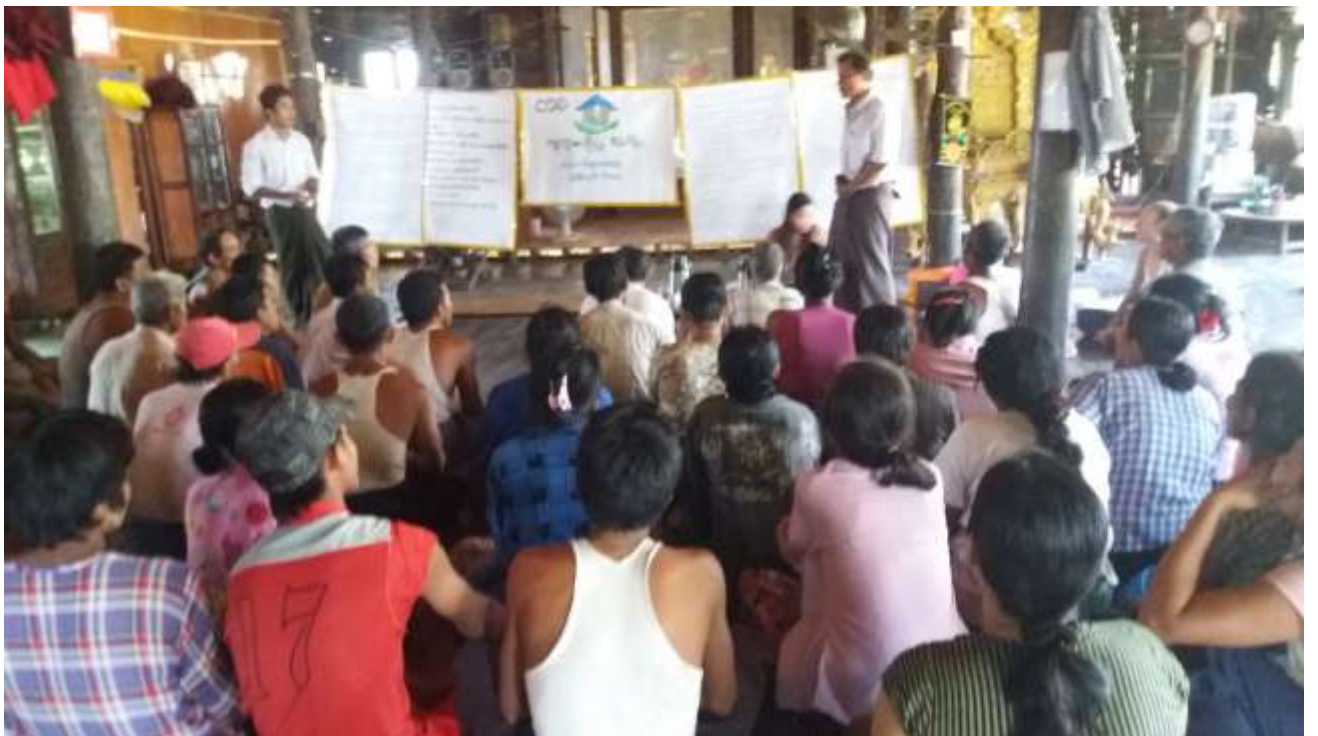
သာပေါင်းမြို့နယ်၊ ရှင်ကြီးပျောက်ကျေးရွာအုပ်စု၊ ရှင်ကြီးပျောက်ကျေးရွာတွင် အစည်းအဝေးပြုလုပ်ပုံ