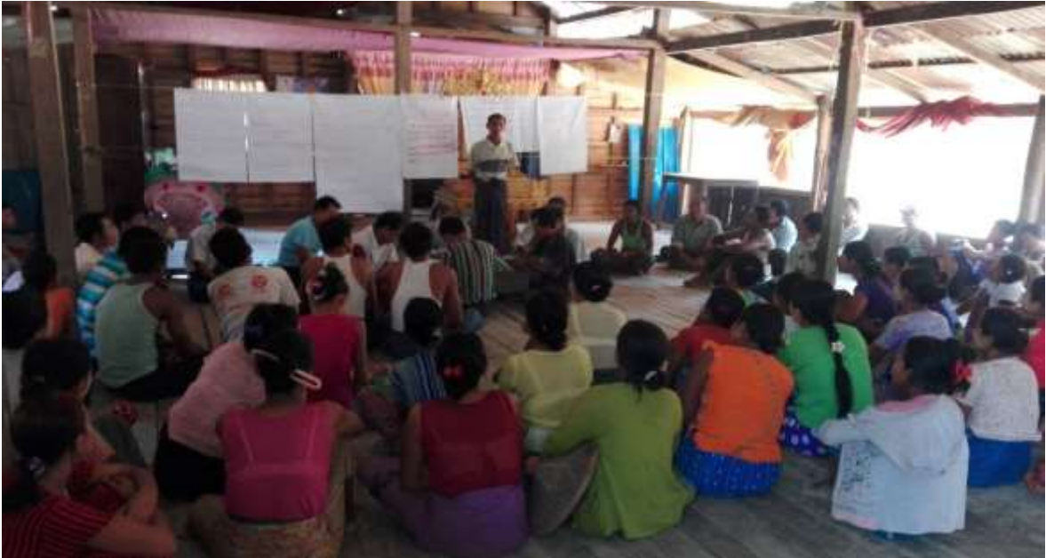
သာပေါင်းမြို့နယ်၊ သစ်ဖြူ ကျေးရွာအုပ်စု၊ သစ်ဖြူ ကျေးရွာတွင် အစည်းအဝေးပြုလုပ်ပုံ