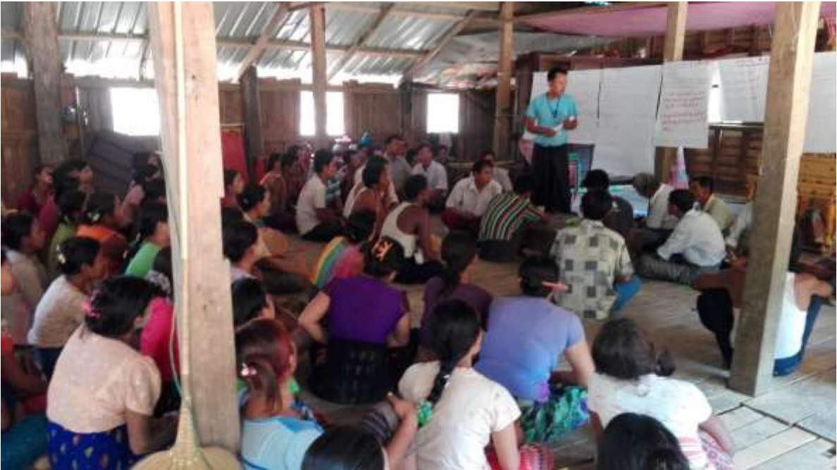
သာပေါင်းမြို့နယ်၊ သစ်ဖြူ ကျေးရွာအုပ်စု၊ သစ်ဖြူ ကျေးရွာတွင်အစည်းအဝေးပြုလုပ်ပုံ