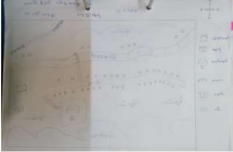
သုံးသပ်ချက်