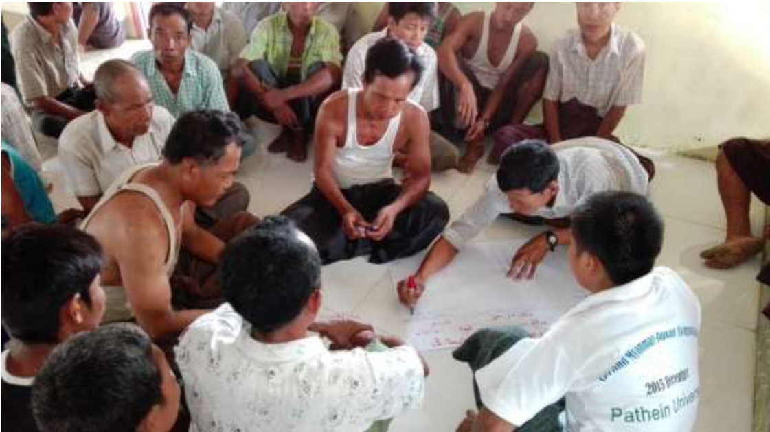
သာပေါင်းမြို့နယ်၊ သစ်ဖြူကျေးရွာအုပ်စု၊ သစ်ဝမ်းပူကျေးရွာတွင် PRA Tools များကိုရှင်းလင်းပုံ