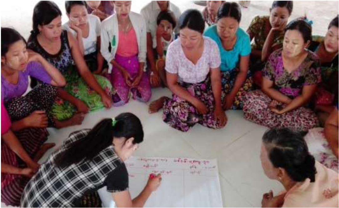
သာပေါင်းမြို့နယ်၊ သစ်ဖြူကျေးရွာအုပ်စု၊ သစ်ဝမ်းပူကျေးရွာတွင် အစည်းအဝေးပြုလုပ်ပုံ