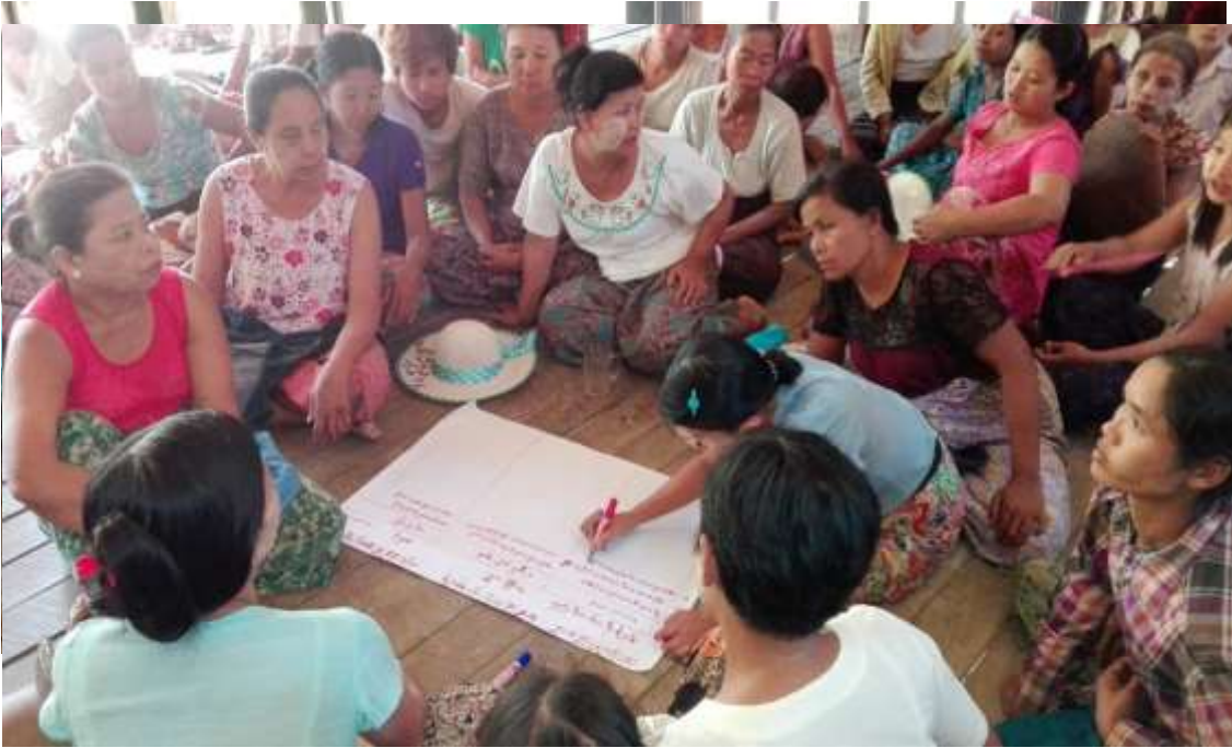
သာပေါင်းမြို့နယ်၊ သစ်ဖြူကျေးရွာအုပ်စုကျားခေါင်းကျေးရွာတွင် အစည်းအဝေးပြုလုပ်ပုံ