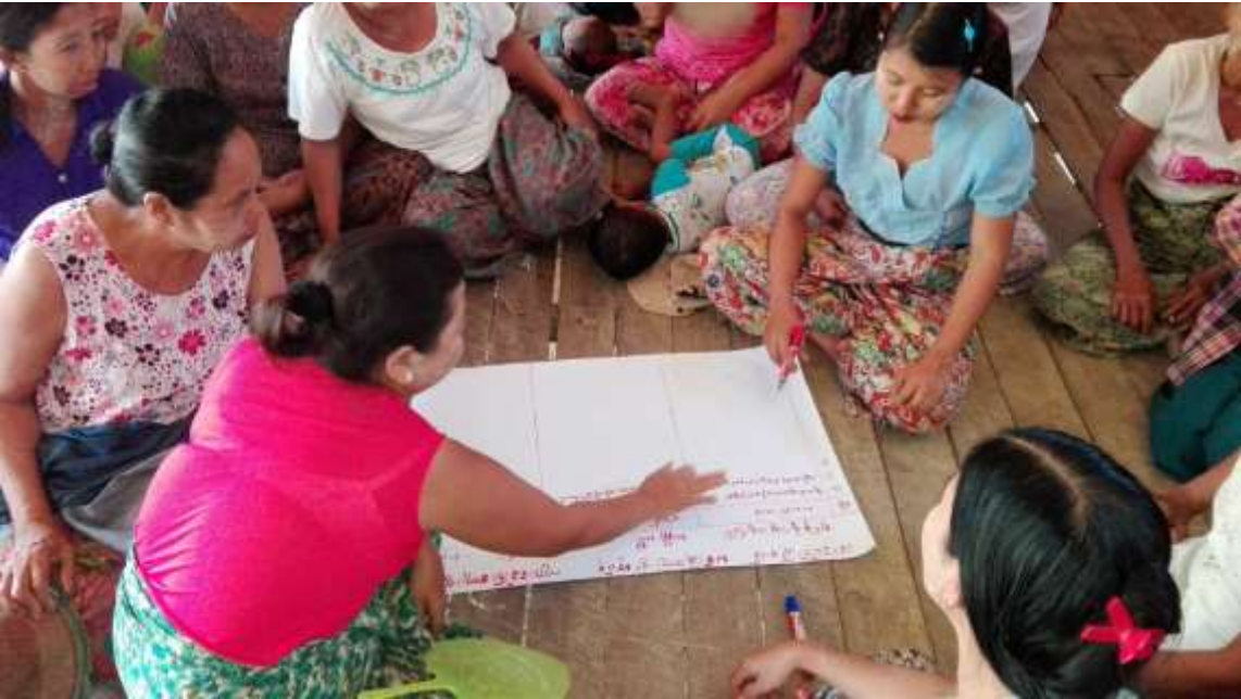
သာပေါင်းမြို့နယ်၊ သစ်ဖြူကျေးရွာအုပ်စုကျားခေါင်းကျေးရွာအတွက် PRA Tools များကိုရှင်းလင်းပုံ