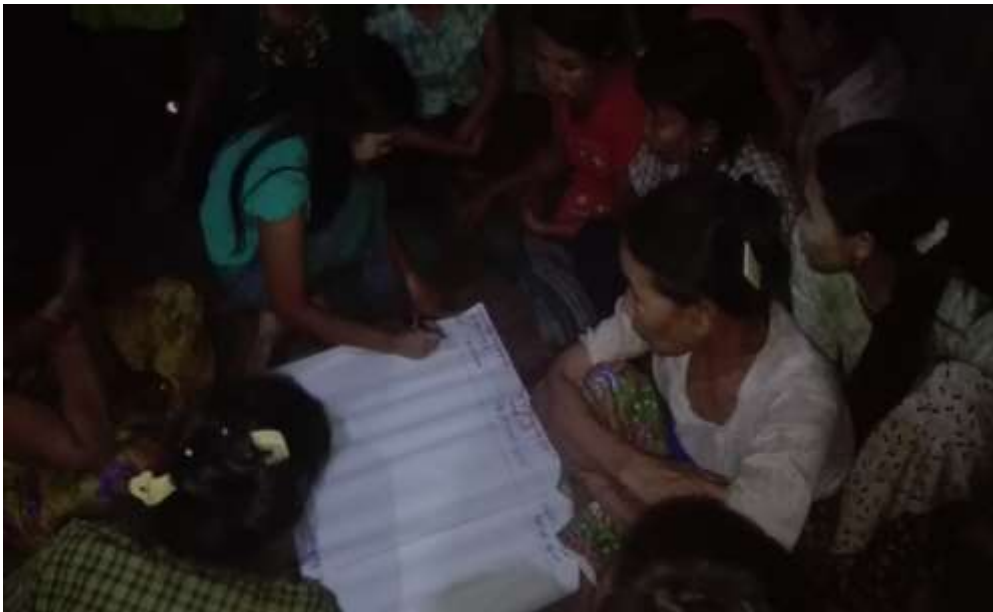
သာပေါင်းမြို့နယ်၊ ကျွန်းလျားကြီးကျေးရွာအုပ်စု၊ မရမ်းကျင်းကျေးရွာတွင် PRA များပြုလုပ်နေပုံ