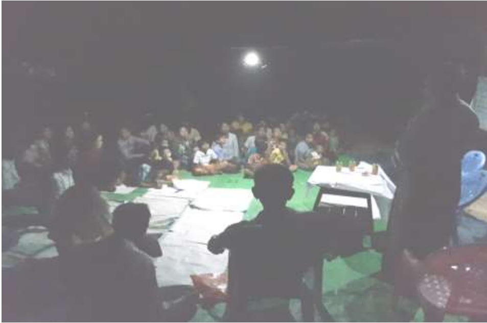
သာပေါင်းမြို့နယ်၊ ကျွန်းလျားကြီးကျေးရွာအုပ်စု၊ မရမ်းကျင်းကျေးရွာတွင် အစည်းအဝေးပြုလုပ်နေပုံ