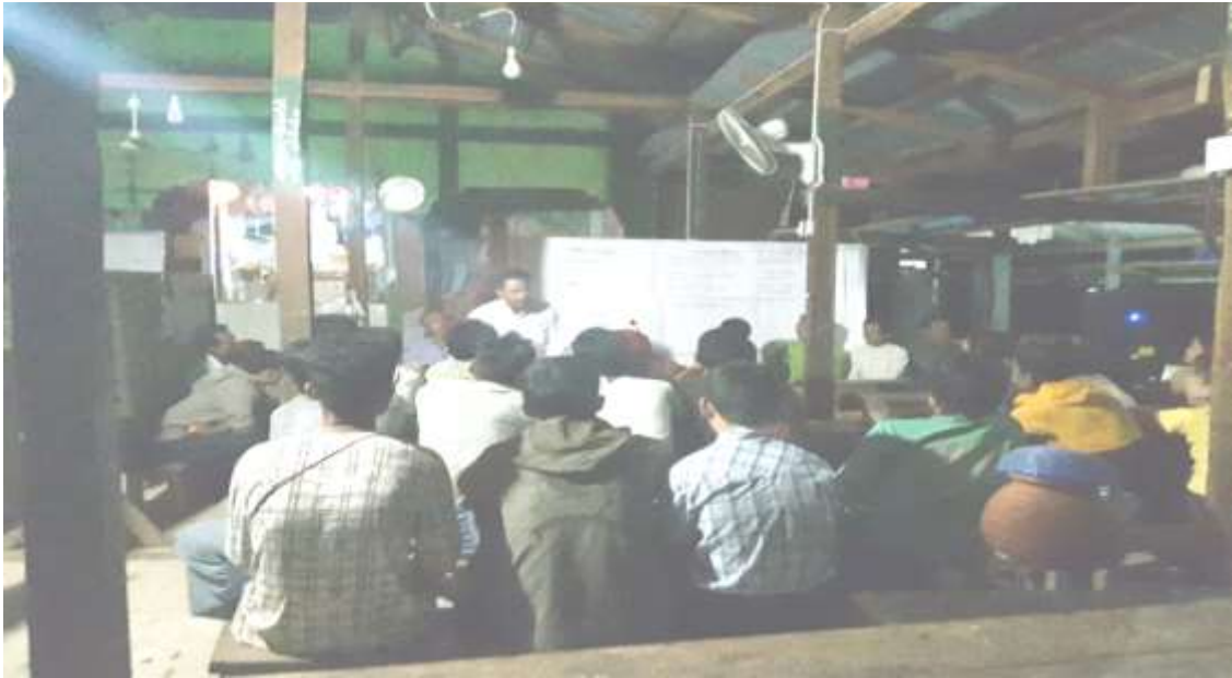
သာပေါင်းမြို့နယ်၊ ကျွန်းလျားကြီးအုပ်စု၊ ကျွန်းလျားကြီးကျေးရွာတွင် အစည်းအဝေးပြုလုပ်နေပုံ

(အမျိုးသား/အမျိုးသမီးရွေးချယ်မှုအရေအတွက်)