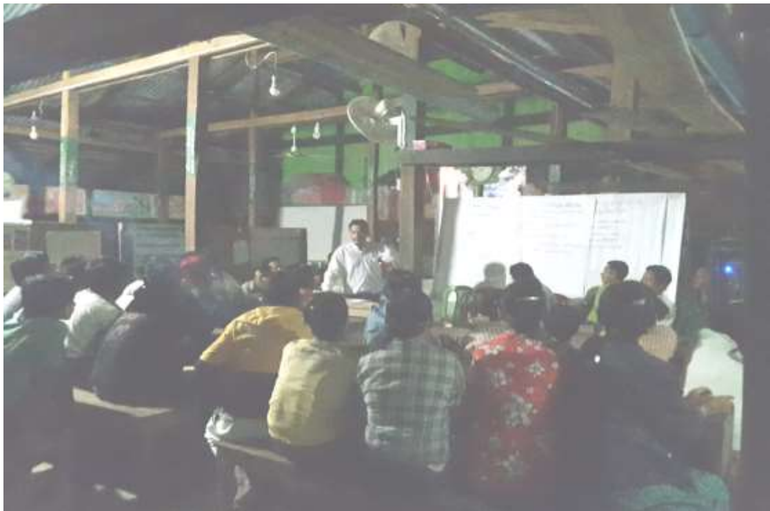
သာပေါင်းမြို့နယ်၊ ကျွန်းလျားကြီးအုပ်စု၊ ကျွန်းလျားကြီးကျေးရွာတွင် အစည်းအဝေးပြုလုပ်နေပုံ