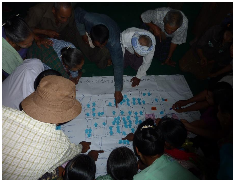
ရွာသူ/ရွာသားများမှ အရင်းအမြစ်ပြု မြေပုံရေးဆွဲပုံ