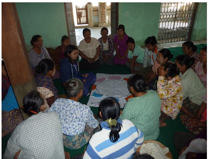
အမျိုးသမီးများမှ ပင့်ကူအိမ်ပြုပုံ ရေးဆွဲစဉ်