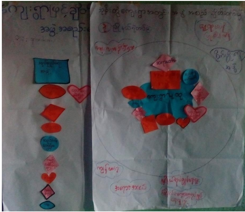
၁၇။အဖွဲ့အစည်း ချိတ်ဆက်မှု ပြပုံ သုံးသပ်ချက်

(ဖင်း ပုံစံ) အဖွဲ့အစည်း ချိတ်ဆက်မှု ပြပုံ ဆွေးနွေးခြင်းနှင့် ဆန်းစစ်ခြင်း (အုန်းတွဲကျေးရွာ) * သာရေး၊ နာရေး မှာ/ရွာမှာ အဓိက ကျသူတွေက ဆရာတော်၊ အုပ်ချုပ်ရေးမှူး၊ ဂူယံအဖွဲ့ ဖြစ်သည်။ * ကျေးရွာလုံခြုံရေး-အုပ်ချုပ်ရေး နှင့် မီးသတ်ဖြစ်ပါသည်။ * စီးပွားရေး ကဖြစ်စေ၊ ရောင်နှင့် သမဖြစ်ပါသည်။ (ချေးငွေပေး) * ပညာရေး မှာ ပညာရေး ဖောင်ဒေးရှင်း က နှစ်မီးပါး ငြိမ်းထူးချွန်တဲ့ သူတွေကို တက္ကသိုလ် အထိ ကျောင်းထားပေးသည်။ * အမျိုးသမီးရေးရာ အဖွဲ့သည် အမျိုးသမီး ကိစ္စများကို ဆောင်ရွက်သော အဖွဲ့ ဖြစ်သည်။ * အုပ်ချုပ်ရေးမှူး အဖွဲ့သည် မြို့နယ်အုပ်ချုပ်ရေးမှူးရုံး၊ ရဲစခန်း၊ မြို့နယ်၊ ကျေးလက်ဦးစီးဌာနများကို ဆက်သွယ်ဆောင်ရွက်ပါသည်။