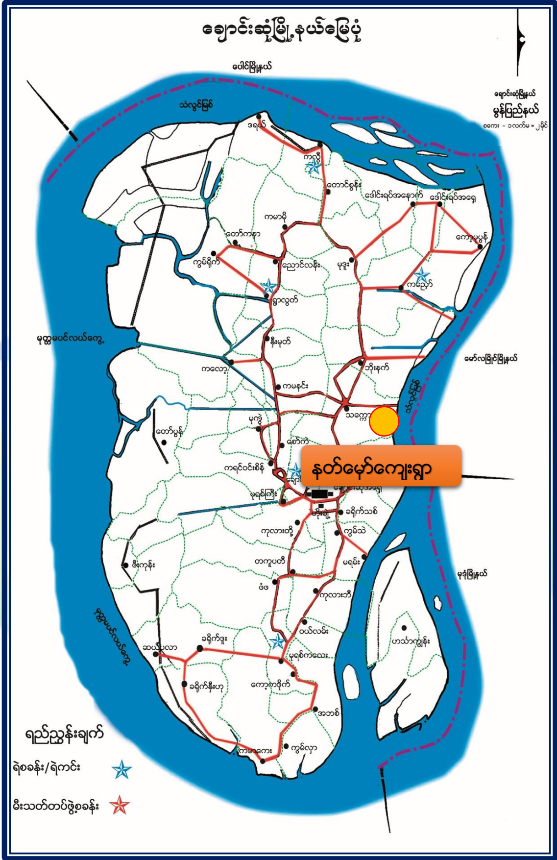
ကျေးရွာဖွံ့ဖြိုးတိုးတက်ရေး လုပ်ငန်းအကောင်အထည်ဖော်မှုအစီအစဉ် (နတ်မော်ကျေးရွာအုပ်စု၊ နတ်မော်ရွာသစ်ကျေးရွာ)