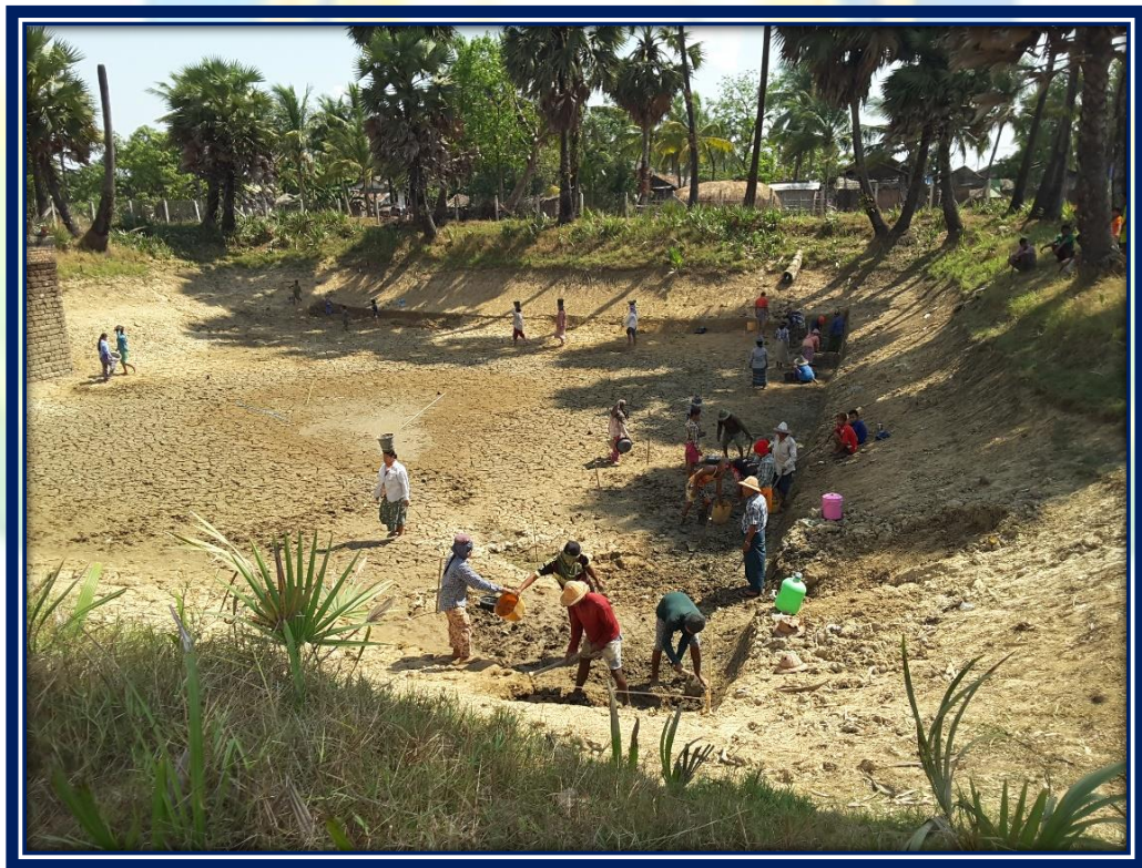
ကျေးရွာဖွံ့ဖြိုးတိုးတက်ရေး လုပ်ငန်းအကောင်အထည်ဖော်မှုအစီအစဉ် (နတ်မော်ကျေးရွာအုပ်စု၊ နတ်မော်ရွာသစ်ကျေးရွာ)