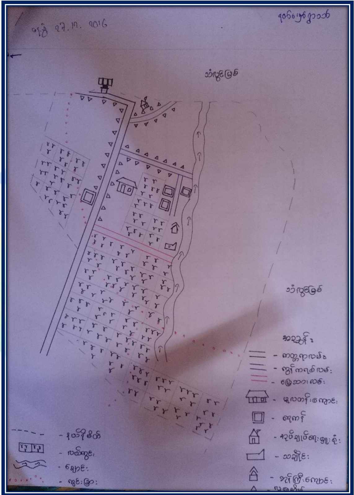
ကျေးရွာဖွံ့ဖြိုးတိုးတက်ရေး လုပ်ငန်းအကောင်အထည်ဖော်မှုအစီအစဉ် (နတ်မှော်ကျေးရွာအုပ်စု၊ နတ်မှော်ရွာသစ်ကျေးရွာ)