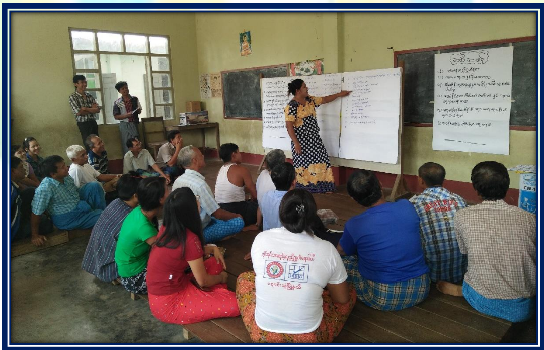
ကျေးရွာဖွံ့ဖြိုးတိုးတက်ရေး လုပ်ငန်းအကောင်အထည်ဖော်မှုအစီအစဉ် (နတ်မှော်ကျေးရွာအုပ်စု၊ နတ်မှော်ရွာသစ်ကျေးရွာ)