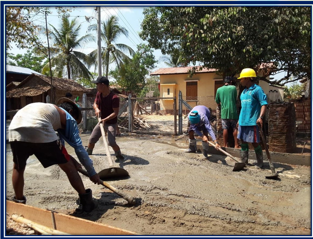
ကျေးရွာဖွံ့ဖြိုးတိုးတက်ရေး လုပ်ငန်းအကောင်အထည်ဖော်မှုအစီအစဉ် (နတ်မှော်ကျေးရွာအုပ်စု၊ နတ်မှော်ရွာဟောင်းကျေးရွာ)