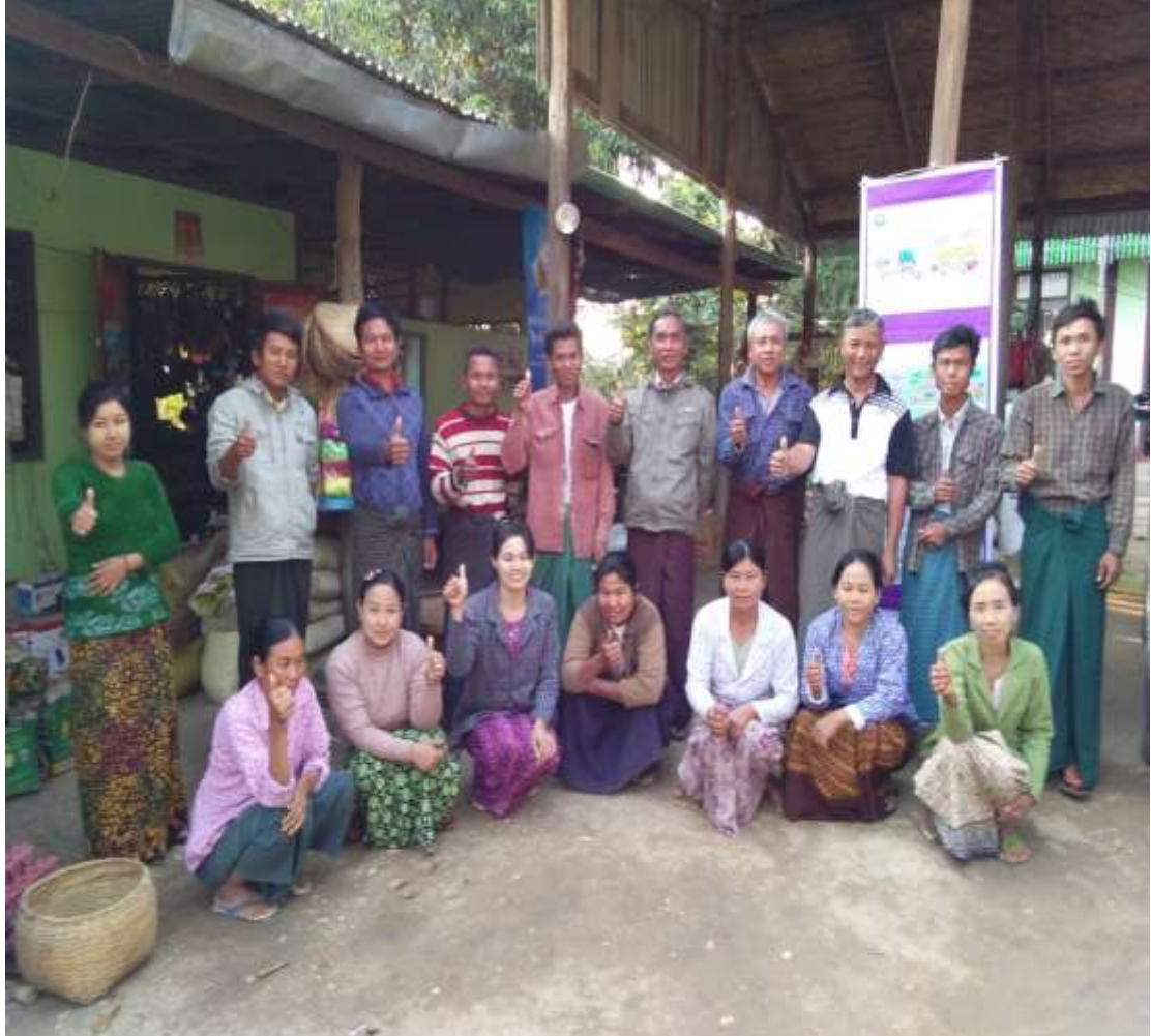
ပုံ..... ကျေးရွာစီ-ထောက် ကော်မတီအဖွဲ့.