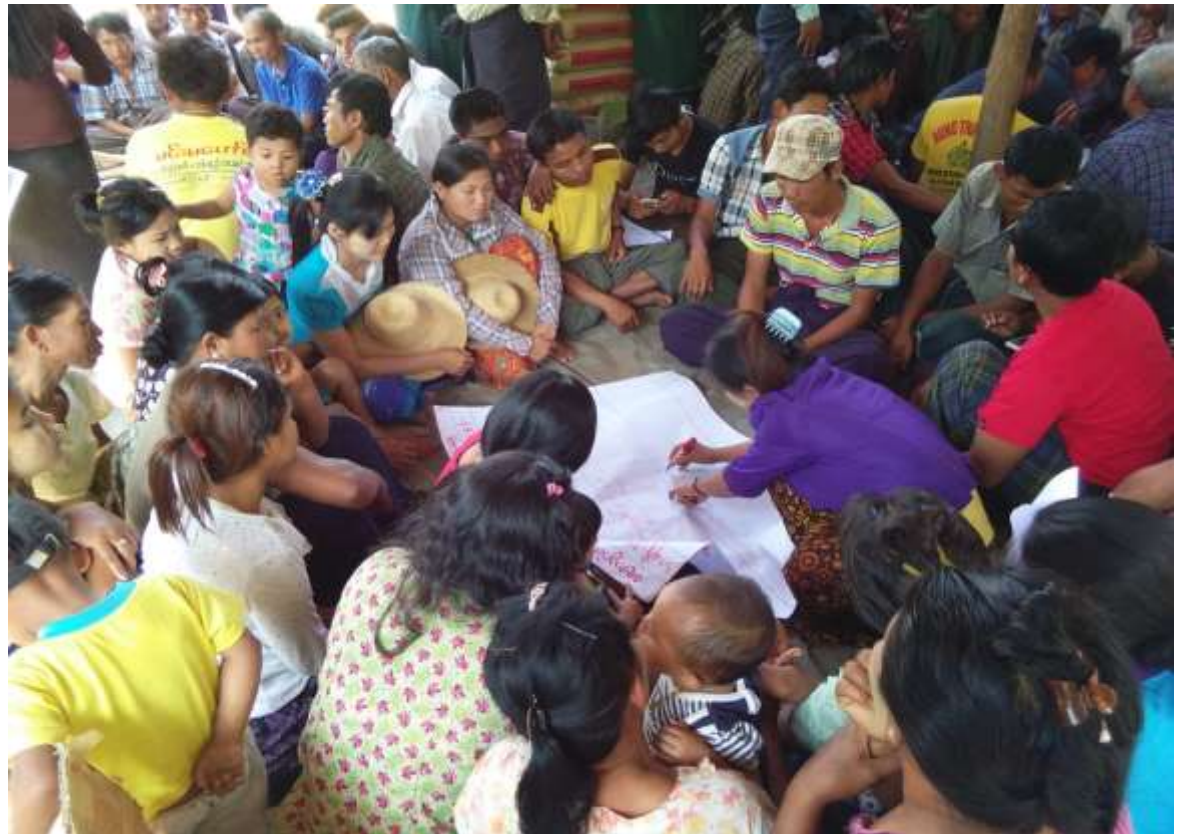
ပုံ..... PRA လုပ်ငန်းစဉ်များပြုလုပ်နေပုံ