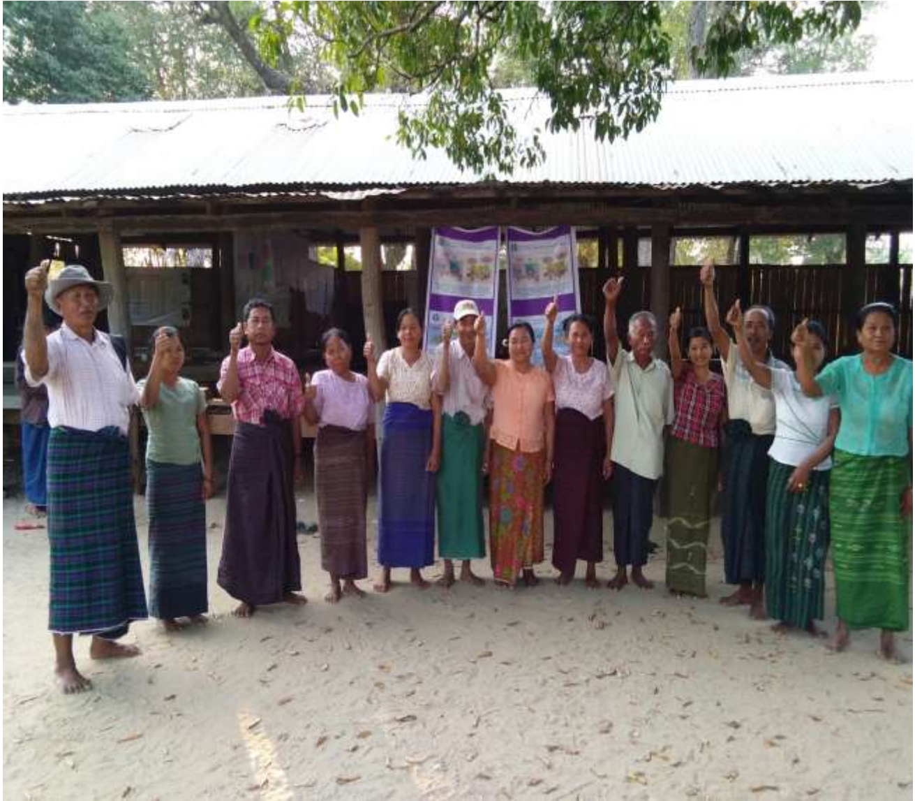
ပုံ..... ကျေးရွာစီ-ထောက် ကော်မတီအဖွဲ့.