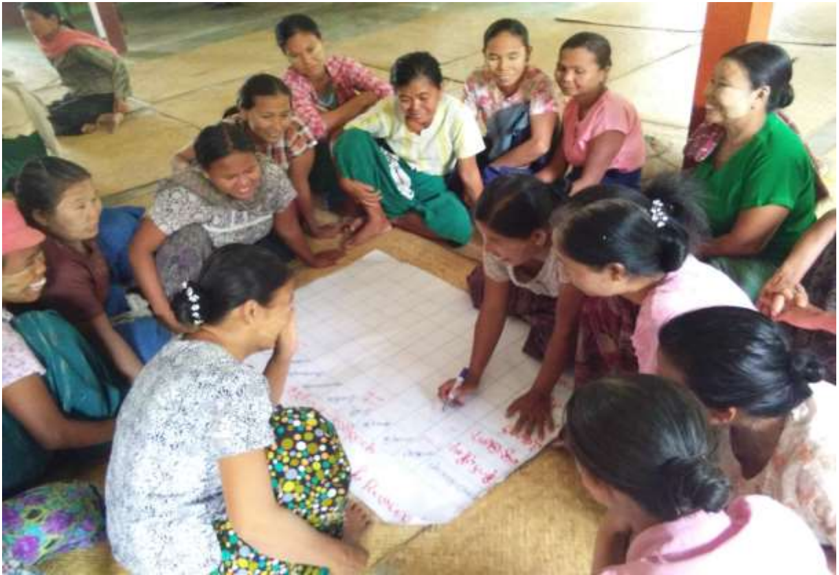
ပုံ..... PRA လုပ်ငန်းစဉ်များပြုလုပ်နေပုံ