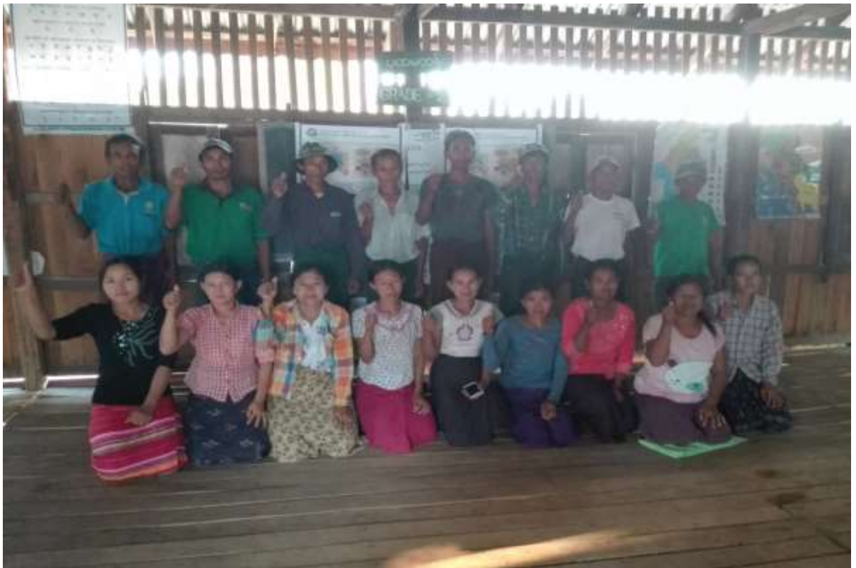
ကျေးရွာ စီ-ထောက်ကော်မတီအဖွဲ့