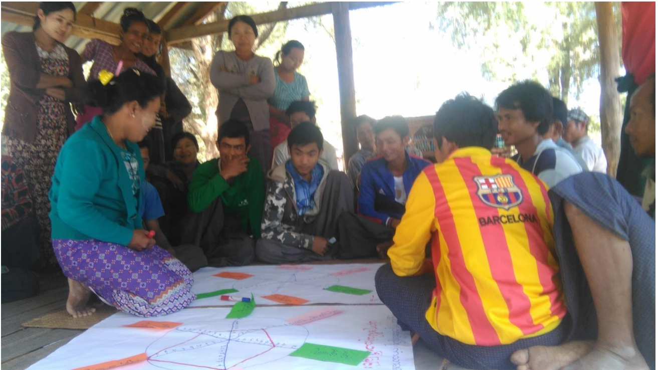
ပုံ.... PSA/ PRA လုပ်ငန်းစဉ် ပင့်ကူအိမ်ပုံစံသုံးသပ်ခြင်း