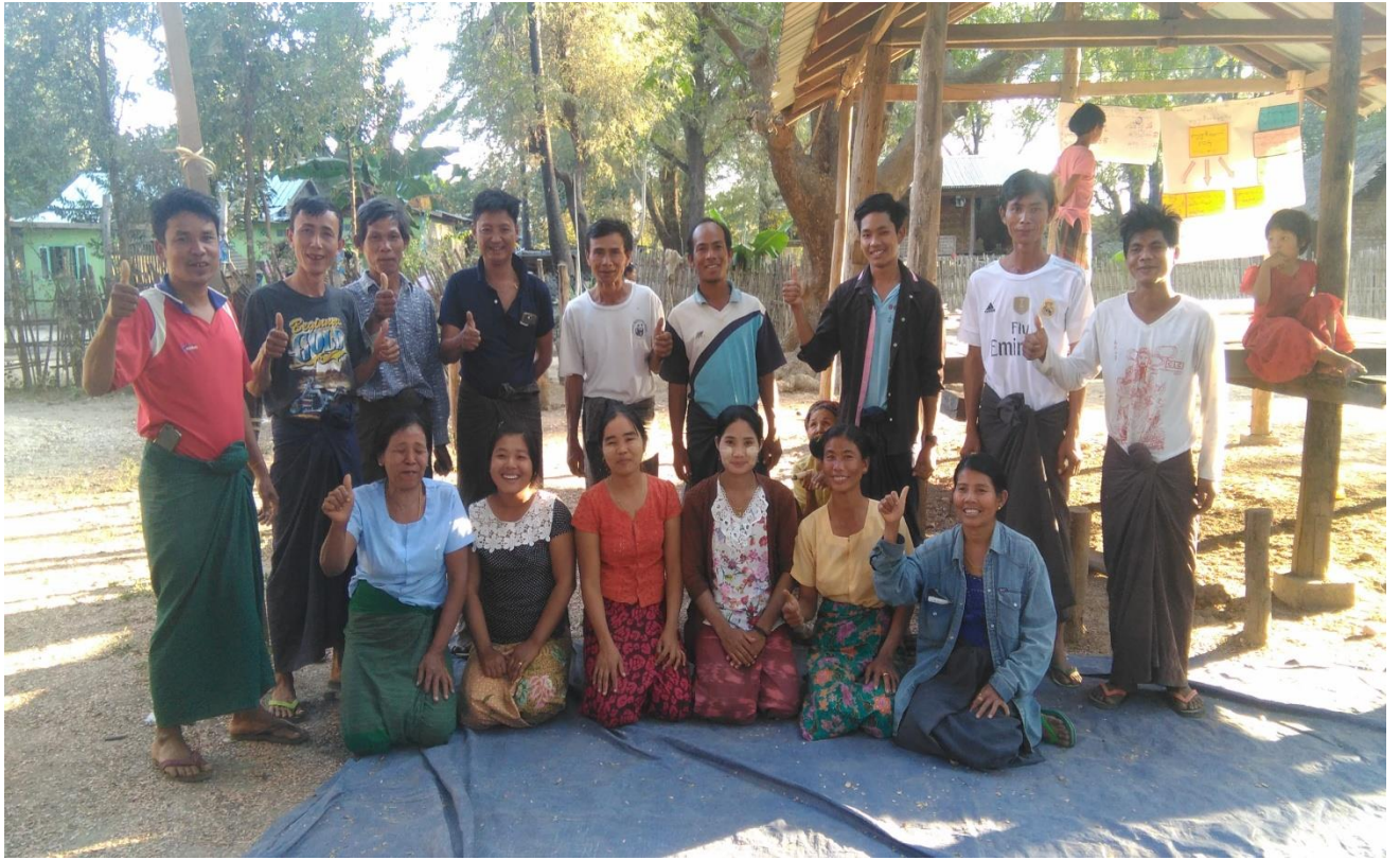
ပုံ.....ကျေးရွာစီ-ထောက် ကော်မတီအဖွဲ့.