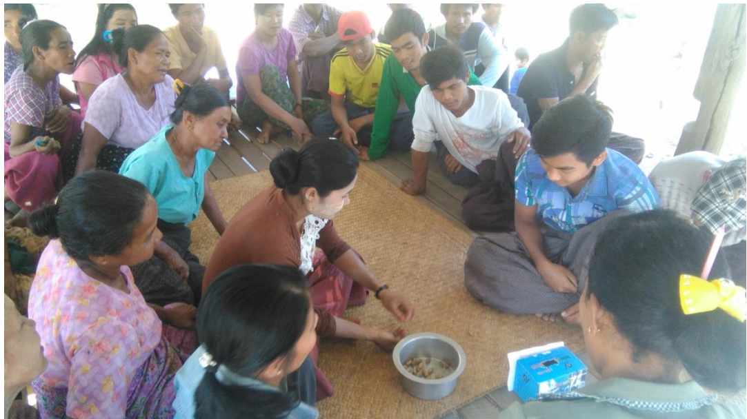
ပုံ...ကျေးရွာဖွံ့ဖြိုးရေးလုပ်ငန်းစဉ်များ/ ကျေးရွာစီထောက်ကော်မတီများအားမဲပေးမဲရေတွက်နေပုံ