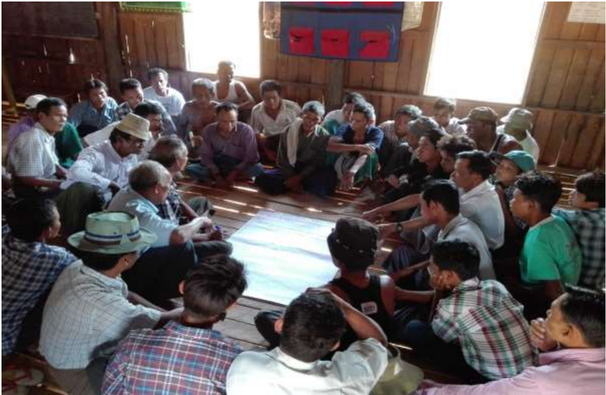
ပုံ.....အခက်အခဲ၊ ပြဿနာ၊ မျှော်မှန်းချက် နှင့် ဖွံ့ဖြိုးရေးလုပ်ငန်းစဉ်များပြုလုပ်နေပုံ