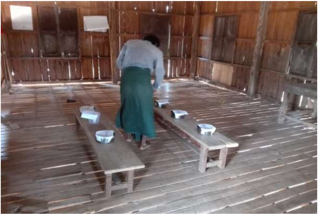
ပုံ..... ကော်မတီ မဲ ပေးရွေးချယ်နေစဉ်