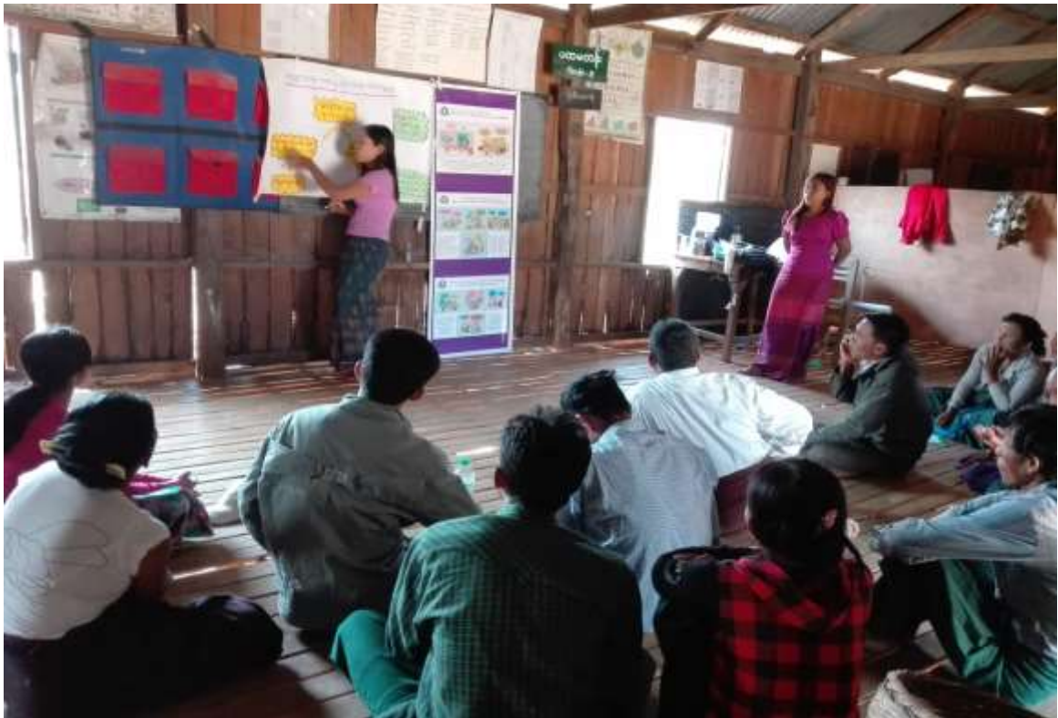
ပုံ..... အုပ်စုကော်မတီဖွဲ့စည်းပုံရှင်းလင်းနေစဉ်