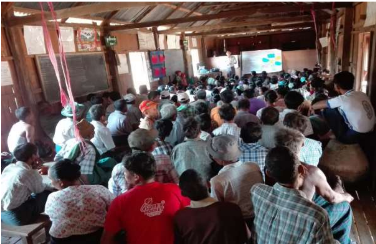
ပုံ.... စီမံကိန်းမိတ်ဆက်အစည်းအဝေး