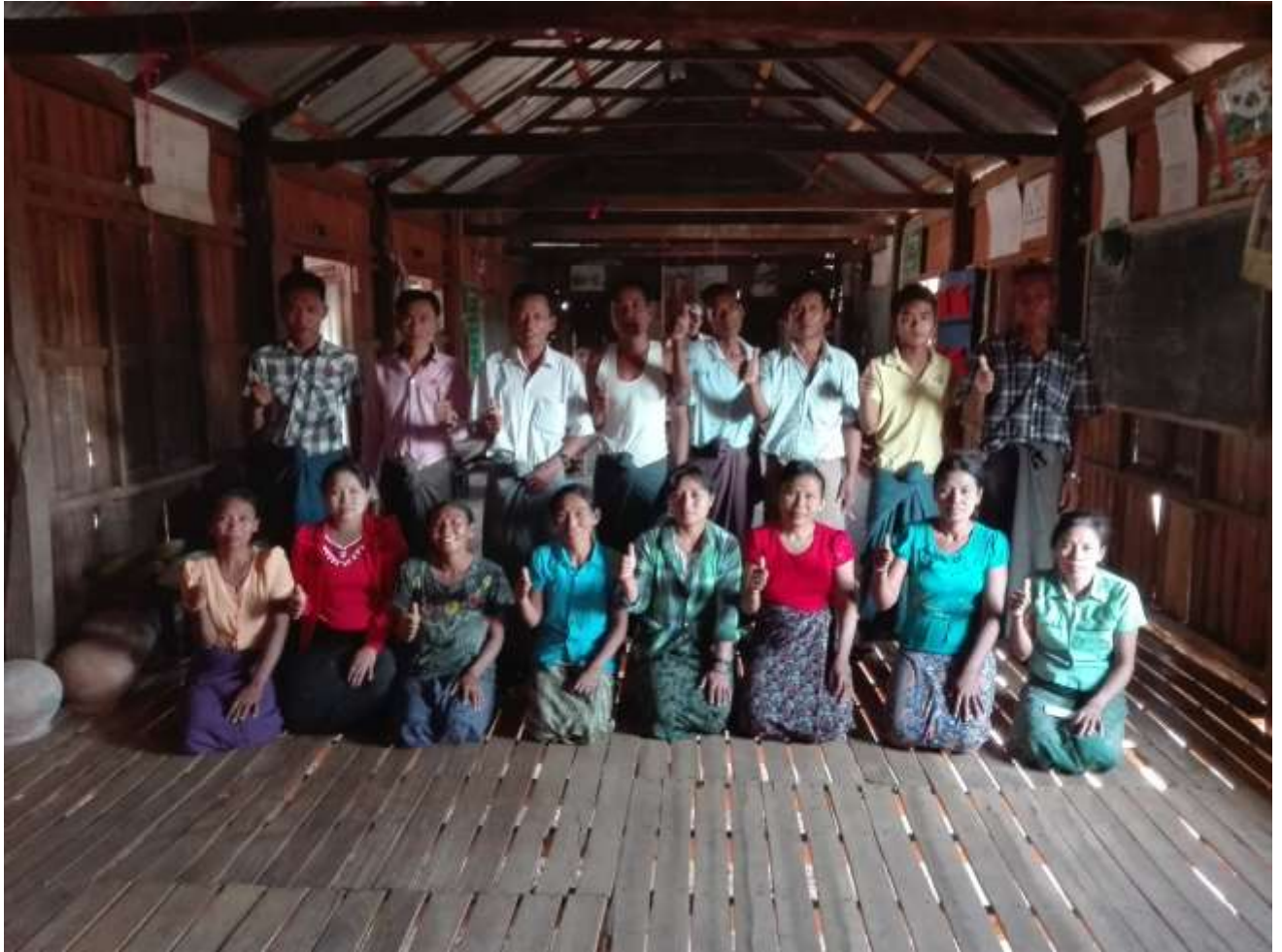
ပုံ.....ကျေးရွာ စိ-ထောက် ကော်မတီအဖွဲ့.