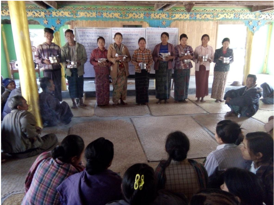
မဲပေးရွေးချယ်ခြင်းလုပ်ငန်း