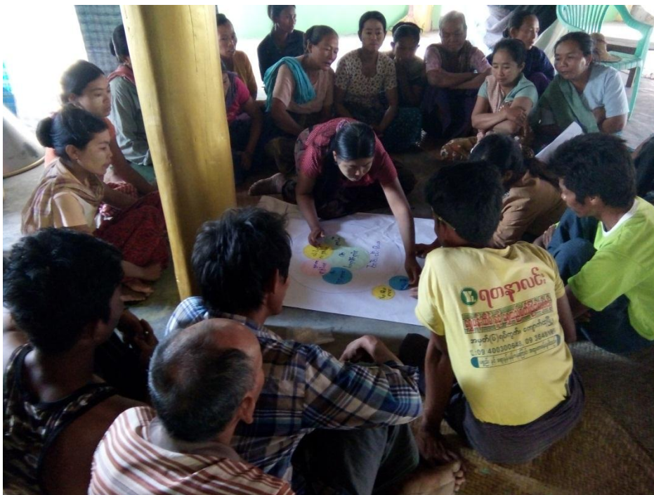
လူမှုဆန်းစစ်ခြင်းများပြုလုပ်ခြင်း