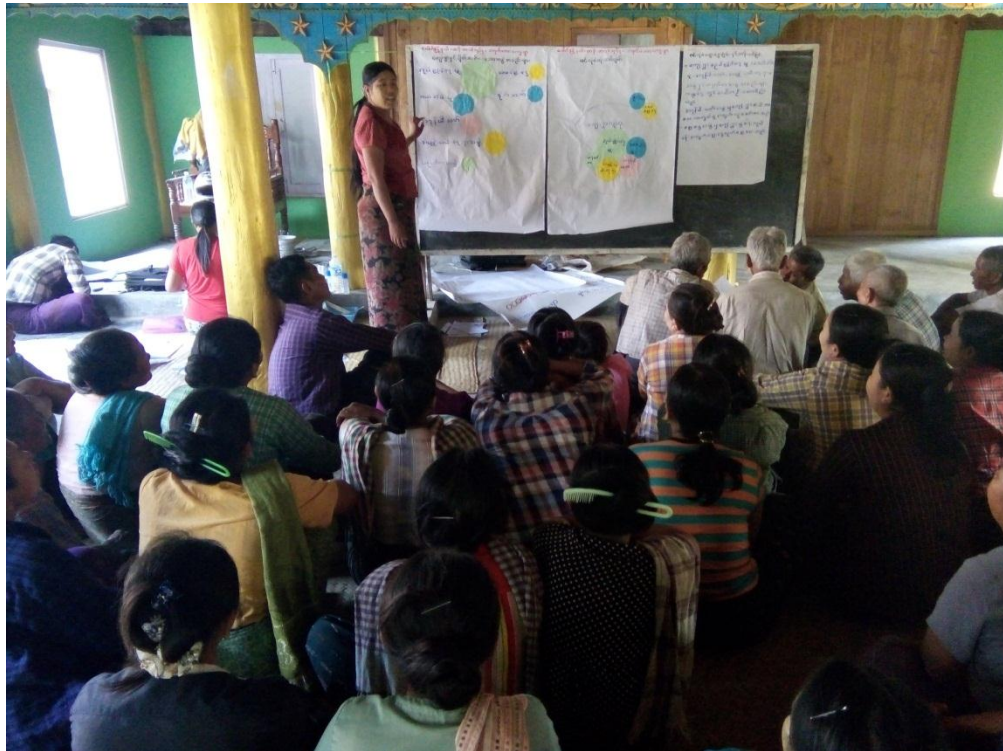
အဖွဲ့အစည်းချိတ်ဆက်မှုအား ရှင်းလင်းတင်ပြခြင်း