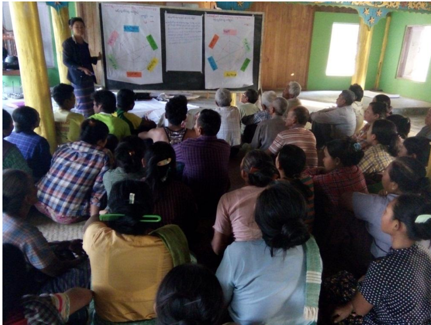
ပင့်ကူအိမ်အကြောင်းပြန်လည်တင်ပြခြင်း