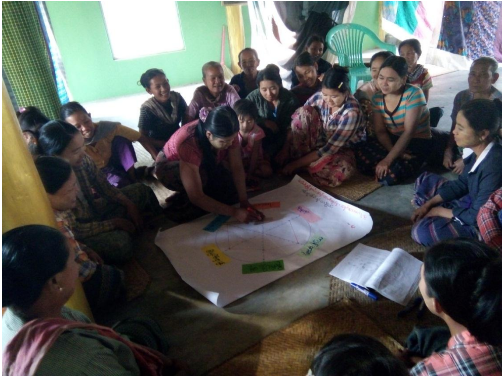
လူမှုဆန်းစစ်ခြင်းများပြုလုပ်ခြင်း