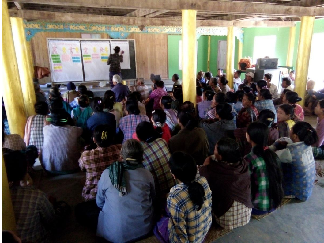
ပထမအကြိမ် ကျေးရွာအစည်းအဝေးဆောင်ရွက်မှုမှတ်တမ်း