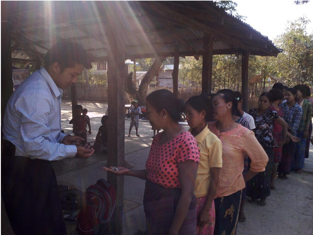
မဲပေးခြင်း