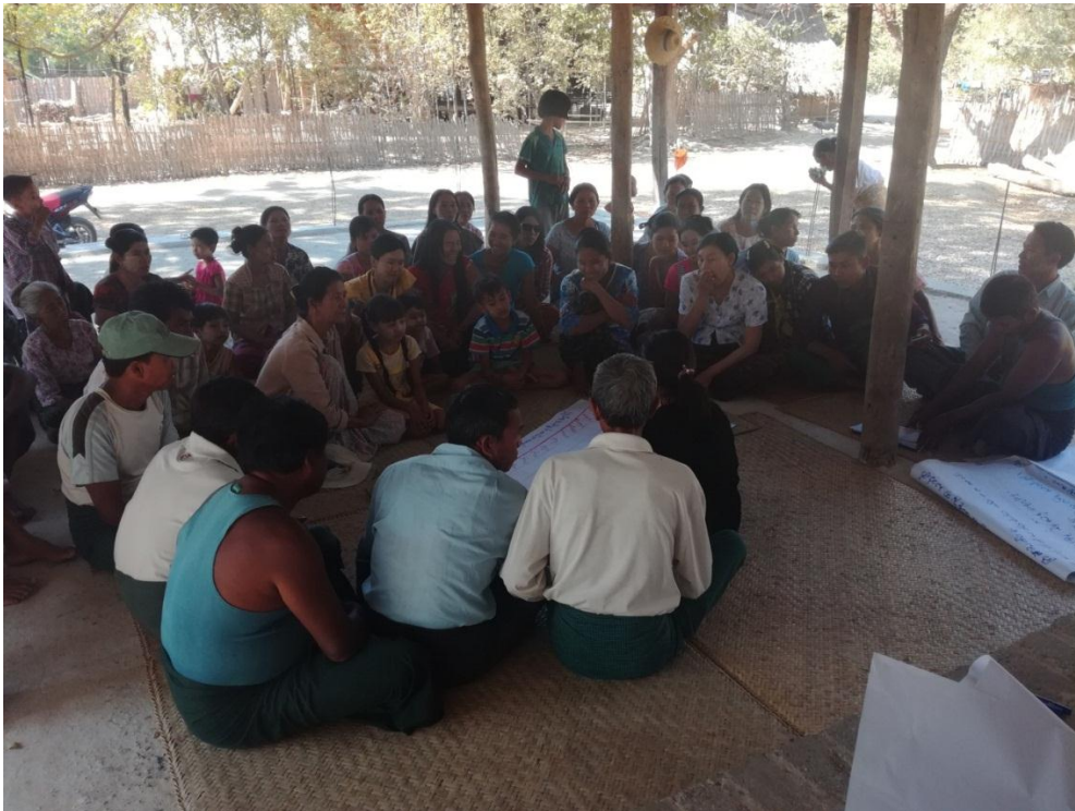
လူမှုဆန်းစစ်ခြင်းများကို အတူဆွေးနွေး