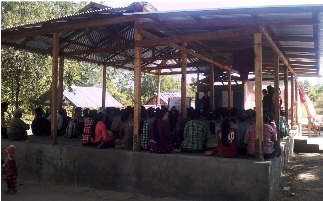
ကျေးရွာ အစည်းအဝေးမှတ်တမ်း