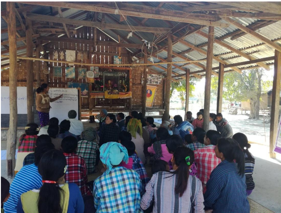
စီမံကိန်းအကြောင်း ရှင်းလင်းပြောကြား