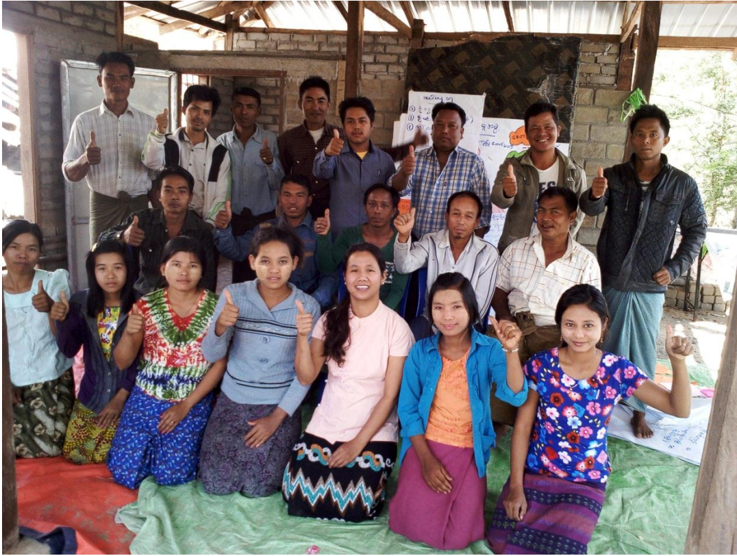
ကော်မတီဝင်များနှင့် လူထုစည်းရုံးရေးမှူးများ၊ လက်ထောက်နည်းပညာမှူးများ