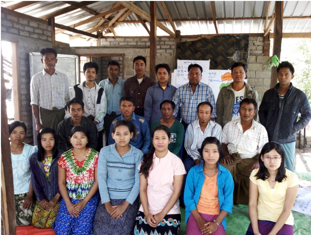
ကော်မတီဝင်များနှင့် လူထုစည်းရုံးရေးမှူးများ၊ လက်ထောက်နည်းပညာမှူးများ