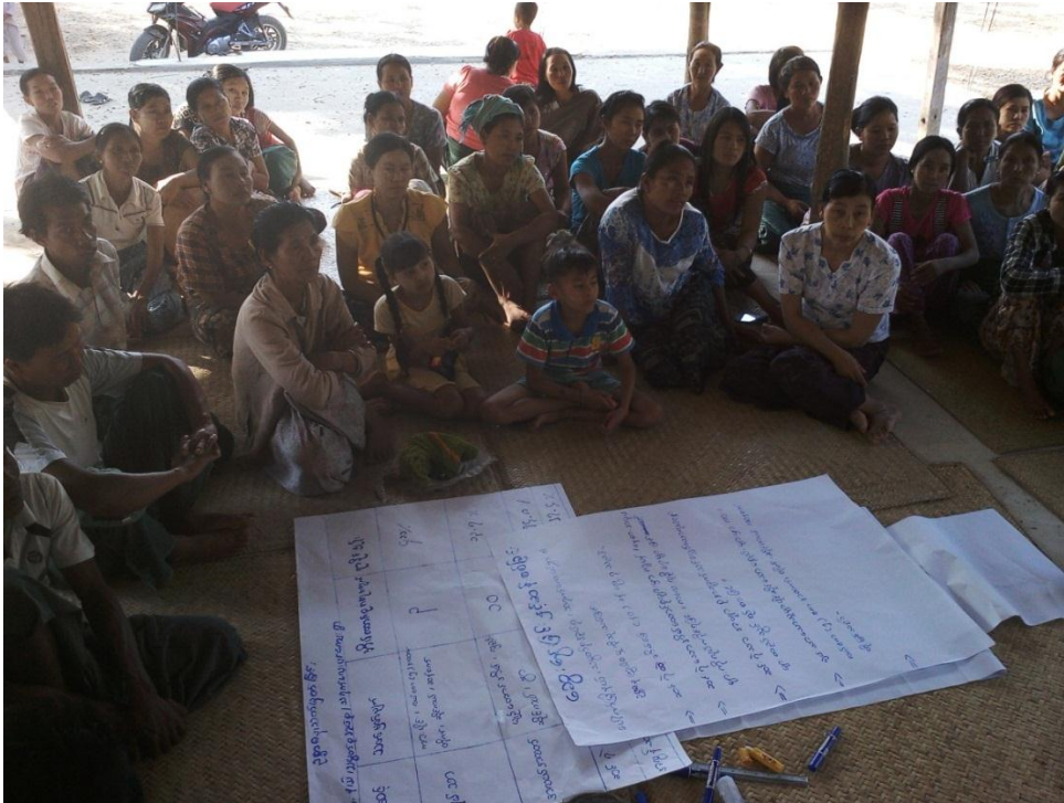
လူမှုဆန်းစစ်ခြင်းလုပ်ငန်းစဉ်များကို အနှစ်ချုပ်နေခြင်းကို စိတ်ပါဝင်စားစွာ နားထောင်နေပုံ