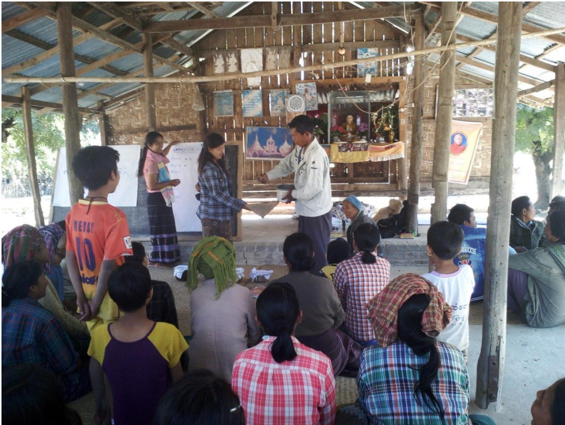
မဲရေတွက်ခြင်း