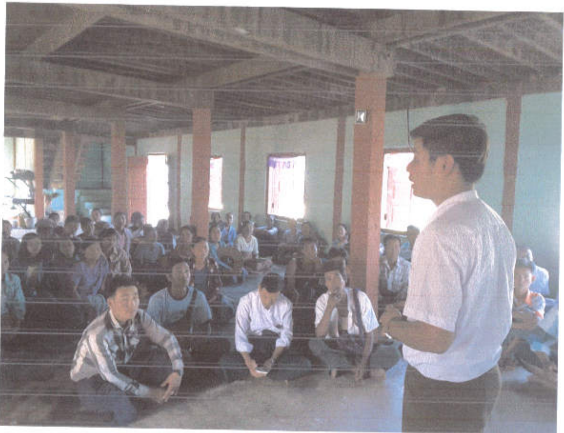
ကျောက်မီးကုကျေးရွာ အစည်းအဝေးမှတ်တမ်းဓာတ်ပုံများ