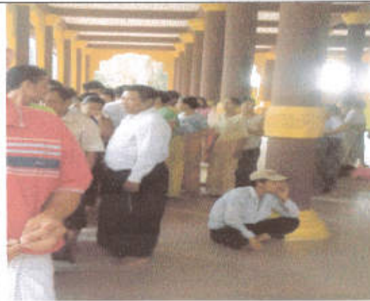
မဲပေးရန်တန်းစီနေကြစဉ်