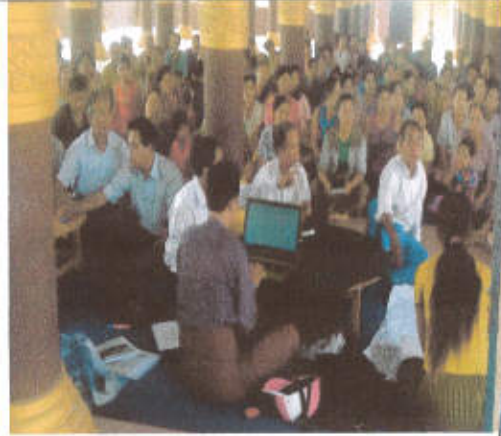
လူမှုဆန်းစစ်ခြင်းသုံးသပ်အစည်းအဝေး