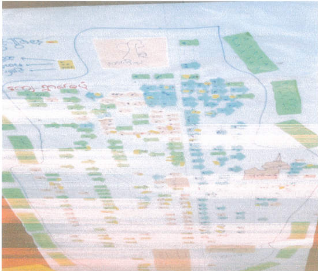
ကျေးရွာ၏လူမှုရေးနှင့် အရင်းအမြစ်ပြမြေပုံ