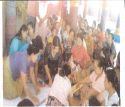
PRA ဆောင်ရွက်နေကြစဉ်