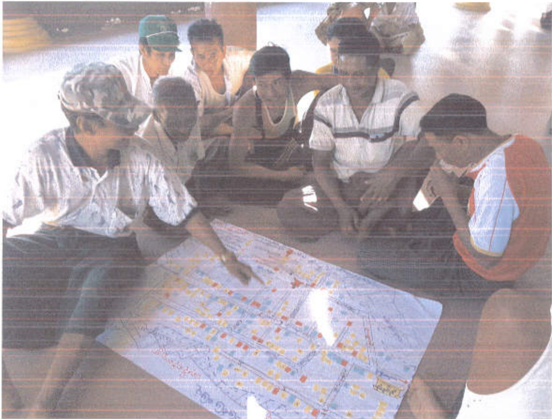
ရေအိုးစဉ်ကျေးရွာ အစည်းအဝေးမှတ်တမ်းဓာတ်ပုံများ