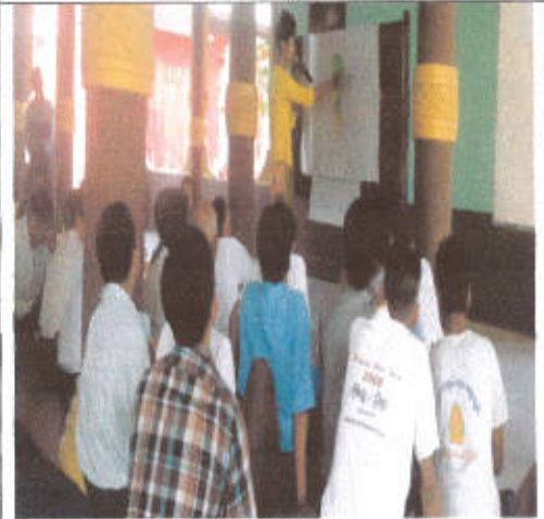
PRA အားရွာသားတစ်ဦးမှရှင်းပြနေစဉ်