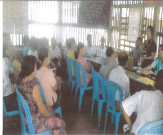
ကျေးရွာအကြံအစဉ်အဝေး