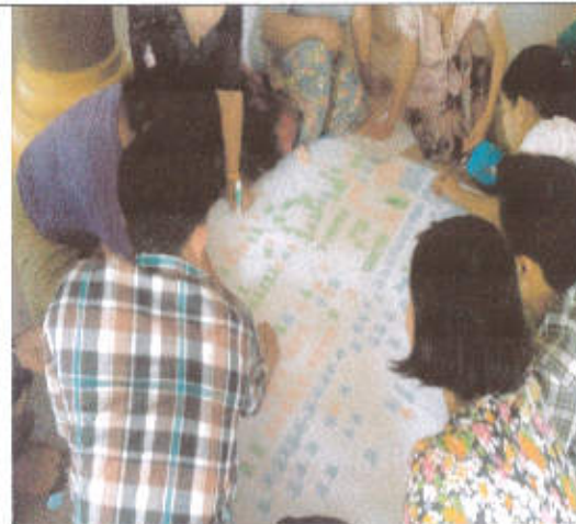
PRA ဆောင်ရွက်နေကြစဉ်