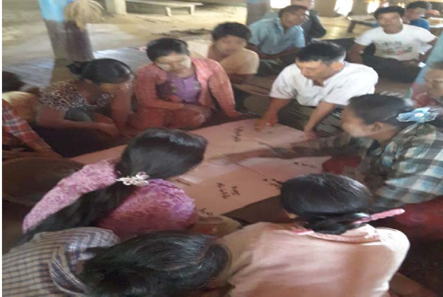
သာပေါင်းမြို့နယ်၊ ငဝန်ကြိုကျေးရွာအုပ်စု၊ ငဝန်ကြိုကျေးရွာတွင် PRA Toolsများပြုလုပ်ပုံ