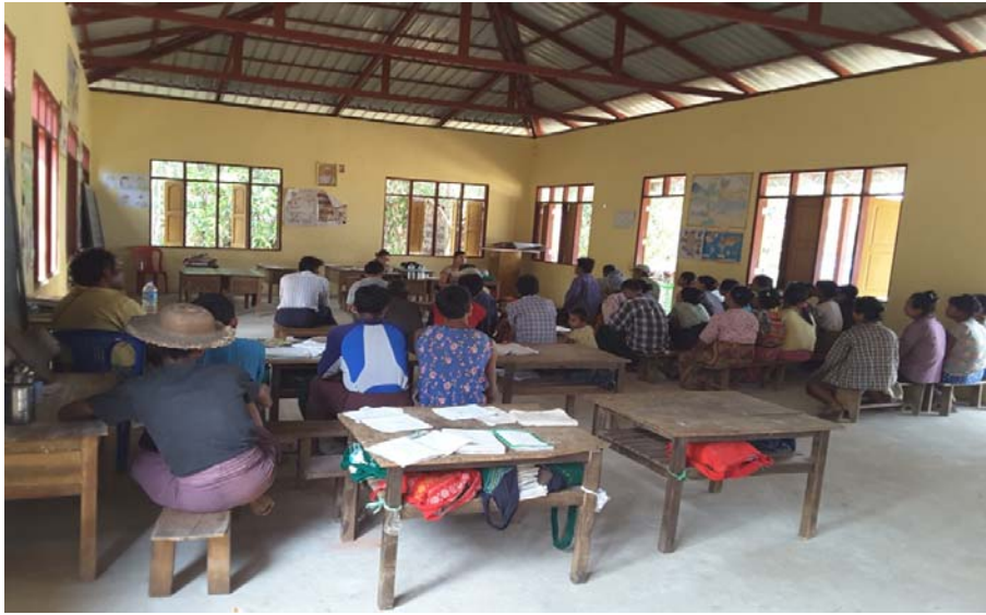
သာပေါင်းမြို့နယ်၊ အိမ်ဆိုးရောင်းအုပ်စု၊ အိုးစည်ကုန်းကျေးရွာ PRA Tools များ ပြုလုပ်ပုံ