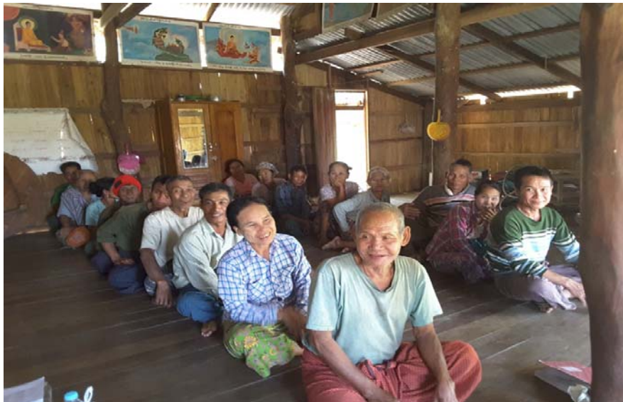
သာပေါင်းမြို့နယ်၊ ထန်းကြုံကုန်းကျေးရွာအုပ်စု၊ ထန်းကြုံကုန်းကျေးရွာ