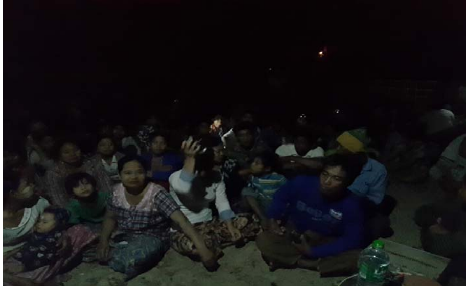
သာပေါင်းမြို့နယ်၊ ထန်းကြုံကုန်းကျေးရွာအုပ်စု၊ ထန်းကြုံကုန်းကျေးရွာတွင် အစည်းအဝေး များ ပြုလုပ်ပုံ