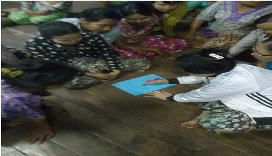
သာပေါင်းမြို့နယ်၊ ကွက်ပြင်ကျေးရွာအုပ်စု၊ ကွက်ပြင်ကျေးရွာတွင် PRA Toolsများပြုလုပ်ပုံ