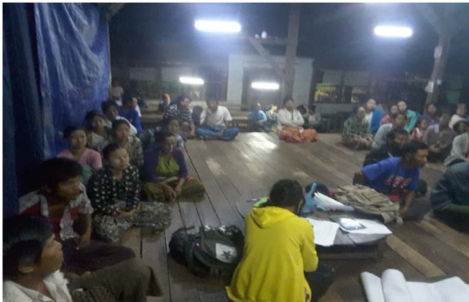
သာပေါင်းမြို့နယ်၊ ကွက်ပြင်ကျေးရွာအုပ်စု၊ ကွက်ပြင်ကျေးရွာတွင်အစည်းအဝေးပြုလုပ်ပုံ