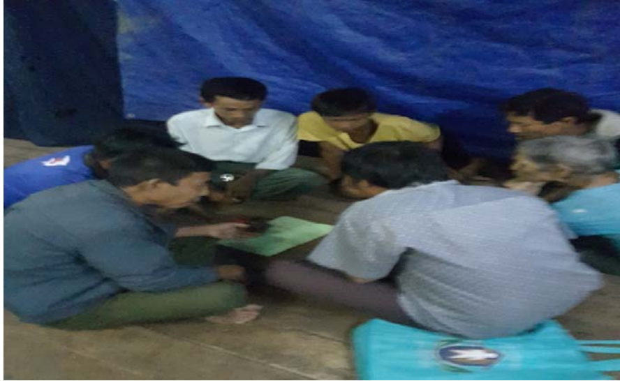
သာပေါင်းမြို့နယ်၊ ကွက်ပြင်ကျေးရွာအုပ်စု၊ ကွက်ပြင်ကျေးရွာ ကျေးရွာအစည်းအဝေးပွဲများ၏ မှတ်တမ်းဓာတ်ပုံများ