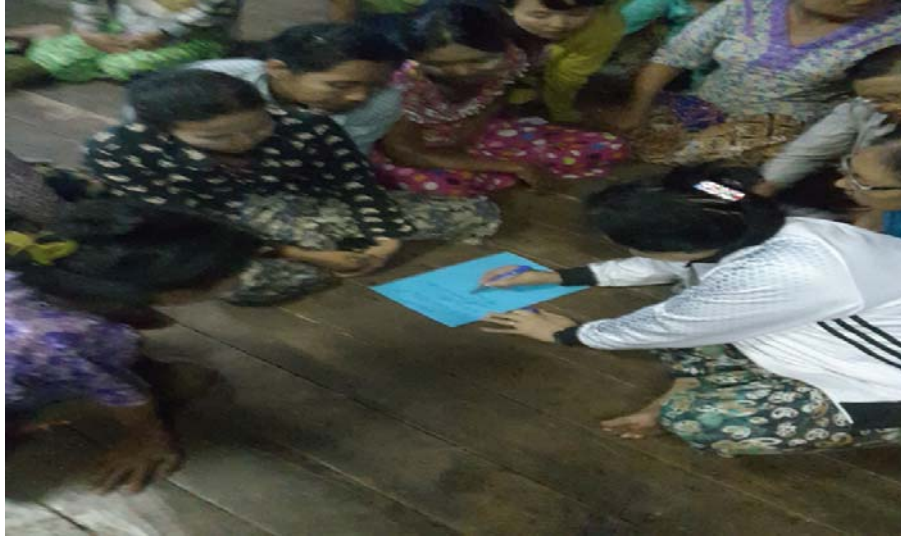
သာပေါင်းမြို့နယ်၊ ကွက်ပြင်ကျေးရွာအုပ်စု၊ ကွက်ပြင်ကျေးရွာတွင် PRA Toolများ ပြုလုပ်ပုံ