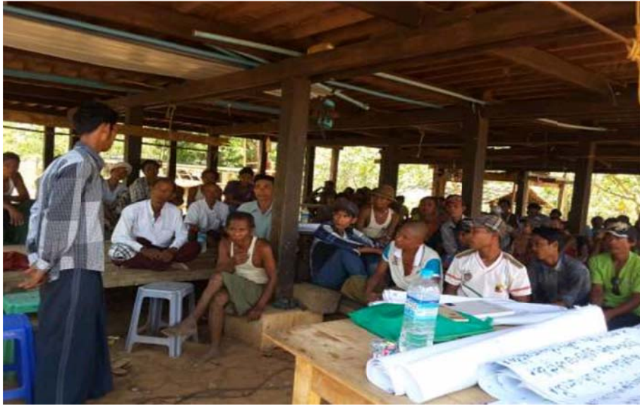
သာပေါင်းမြို့နယ်၊ ဖျဉ်းမထုံးအုပ်စု၊ ဝါးယားကျေးရွာ ကျေးရွာအစည်းအဝေးပွဲများ၏ မှတ်တမ်းဓာတ်ပုံများ