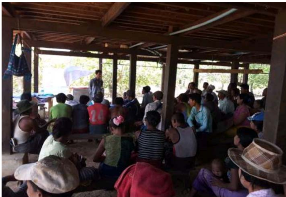
သာပေါင်းမြို့နယ်၊ ဖျဉ်းမထုံးအုပ်စု၊ ဝါးယားကျေးရွာ