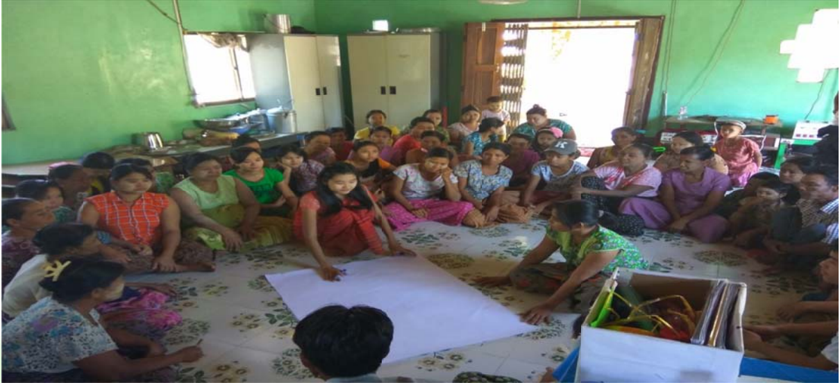
အမျိုးသမီးအုပ်စု၏ မှတ်တမ်းဓါတ်ပုံ