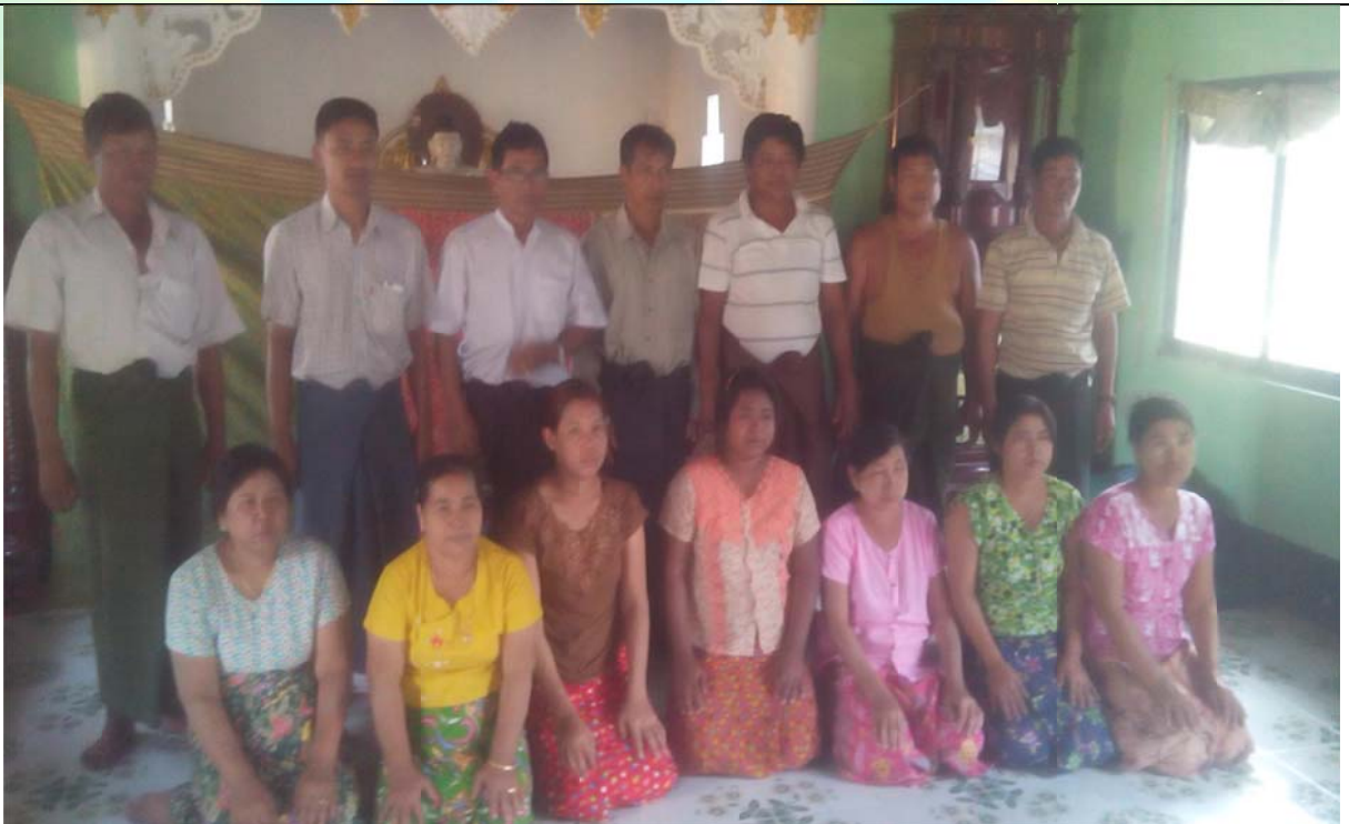
ကော်မတီဝင်များ ရွေးချယ်ပြီးစီးခြင်း မှတ်တမ်းဓါတ်ပုံ