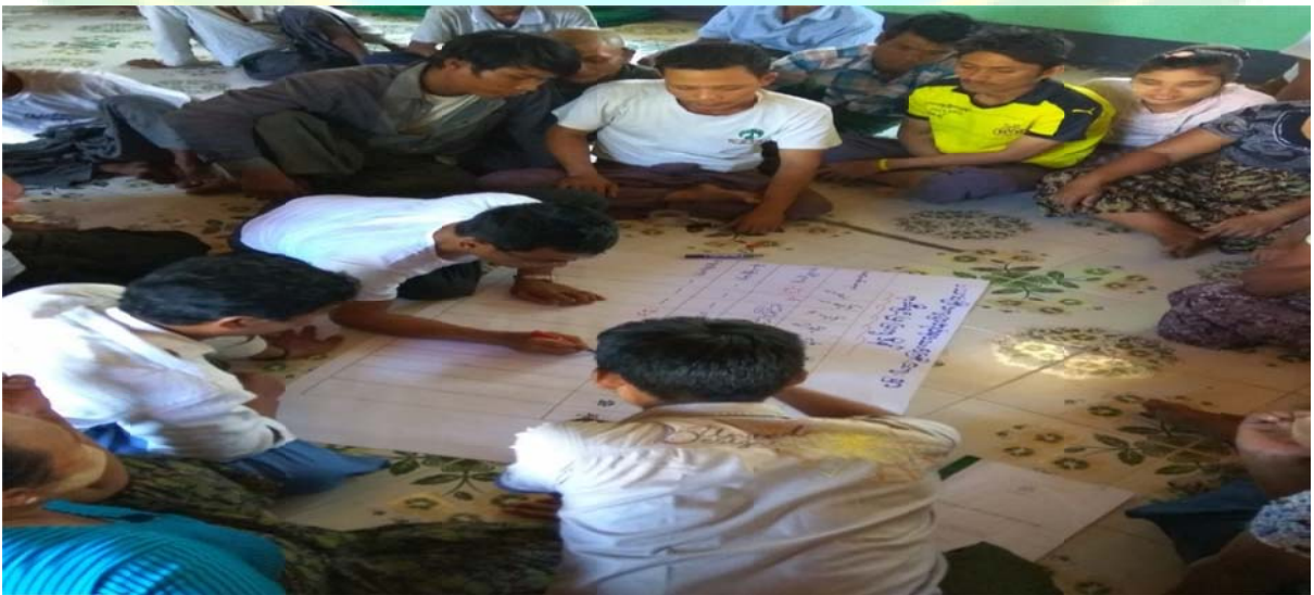
အမျိုးသားအုပ်စု မှတ်တမ်းတင်ဓါတ်ပုံ