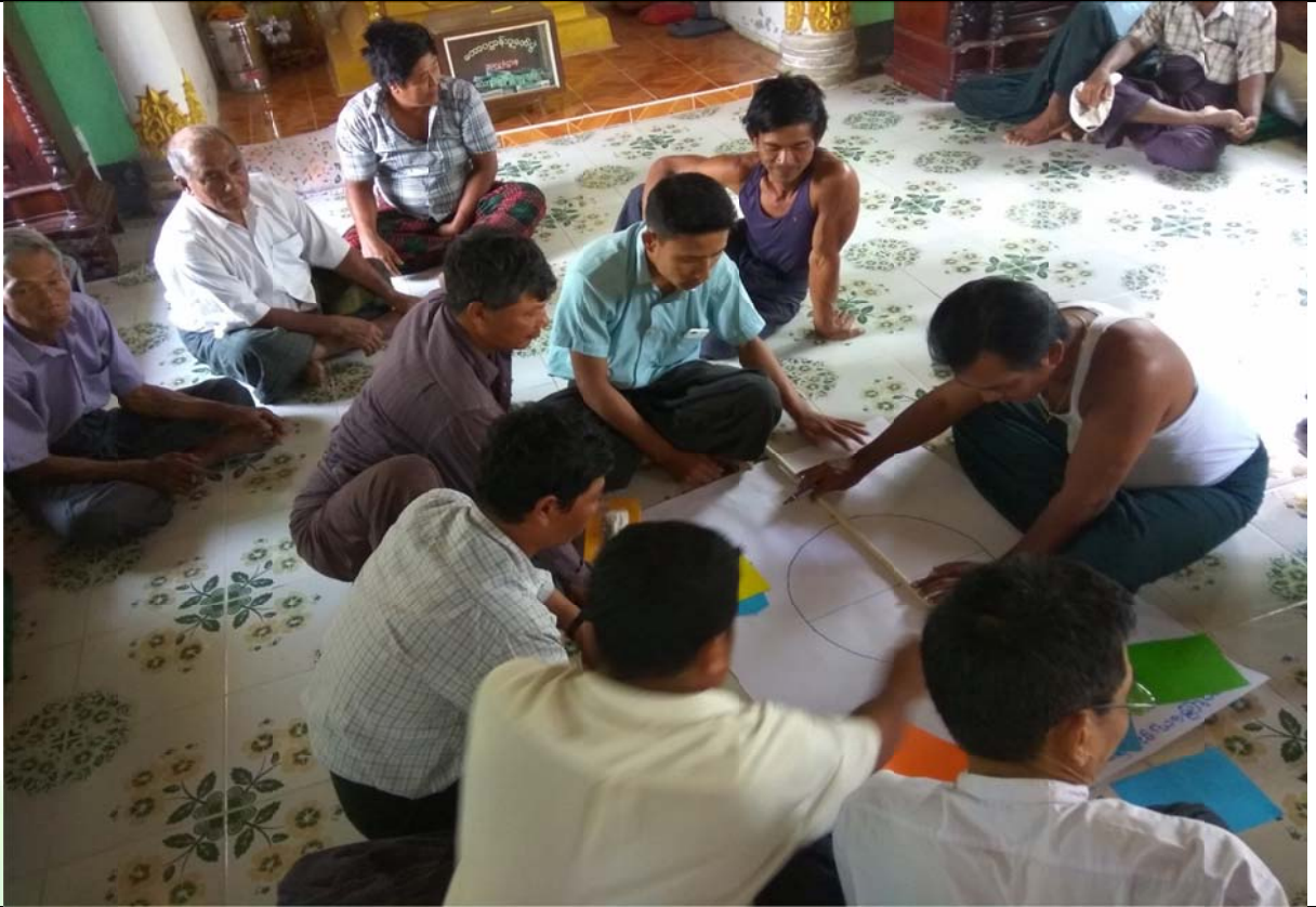
ပင့်ကူအိမ်သုံးသင်ချက် မှတ်တမ်းဓါတ်ပုံ