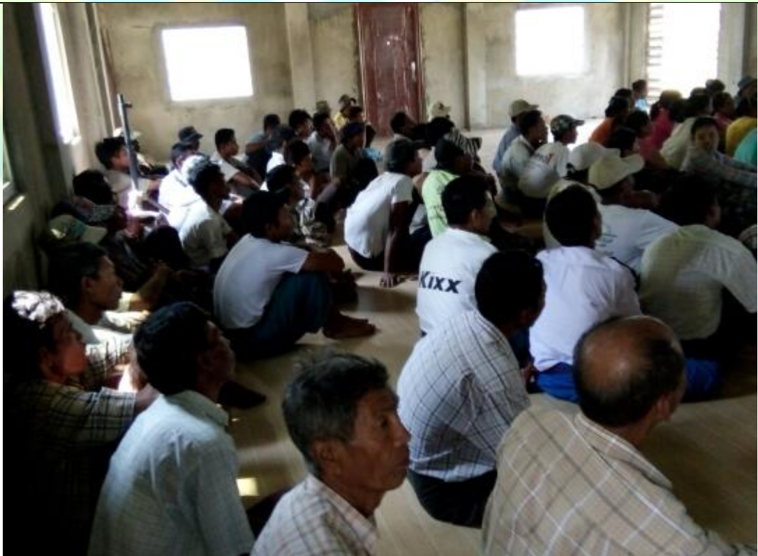
စေတနာ့ဝန်ထမ်းများရွေးချယ်ခြင်းမှတ်တမ်းဓါတ်ပုံ