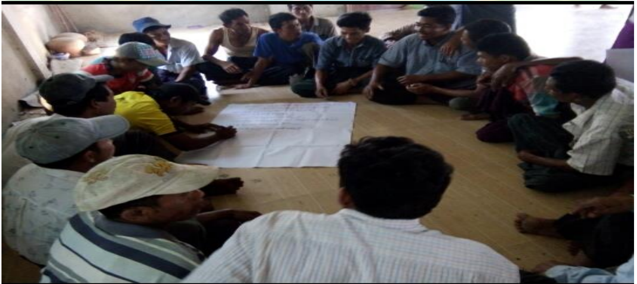
အမျိုးသားအုပ်စုမှတ်တမ်းတင်ခါတ်ပုံ။