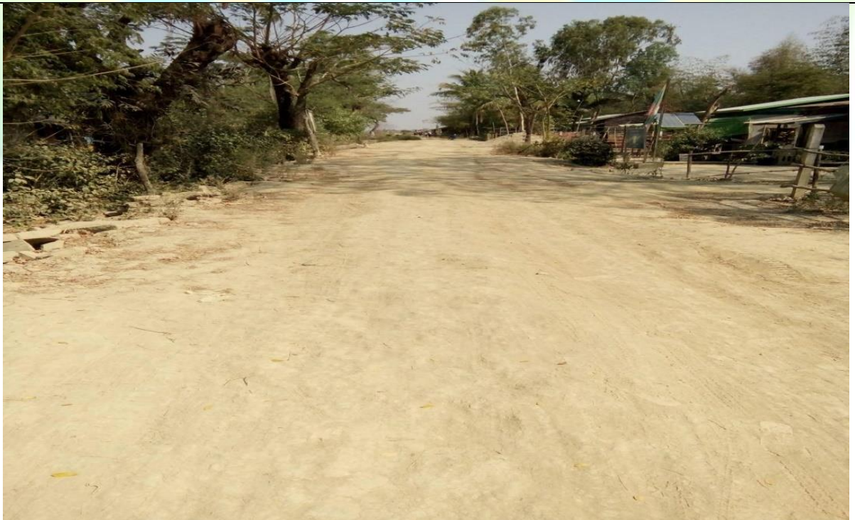
လုပ်ငန်းခွဲ၏မပြုလုပ်မီမှတ်တမ်းဓာတ်ပုံ