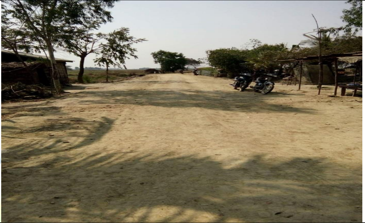
လုပ်ငန်းခွဲ၏မပြုလုပ်မီမှတ်တမ်းဓာတ်ပုံ