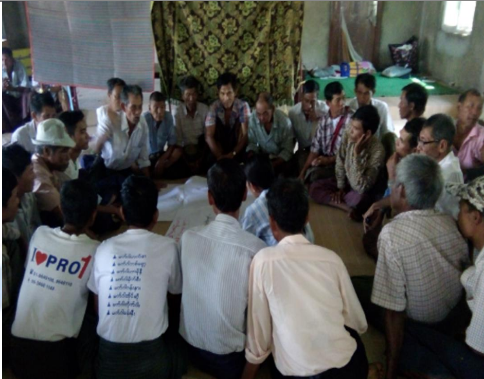
ကော်မတီရွေးချယ်ခြင်းမှတ်တမ်းဓါတ်ပုံ