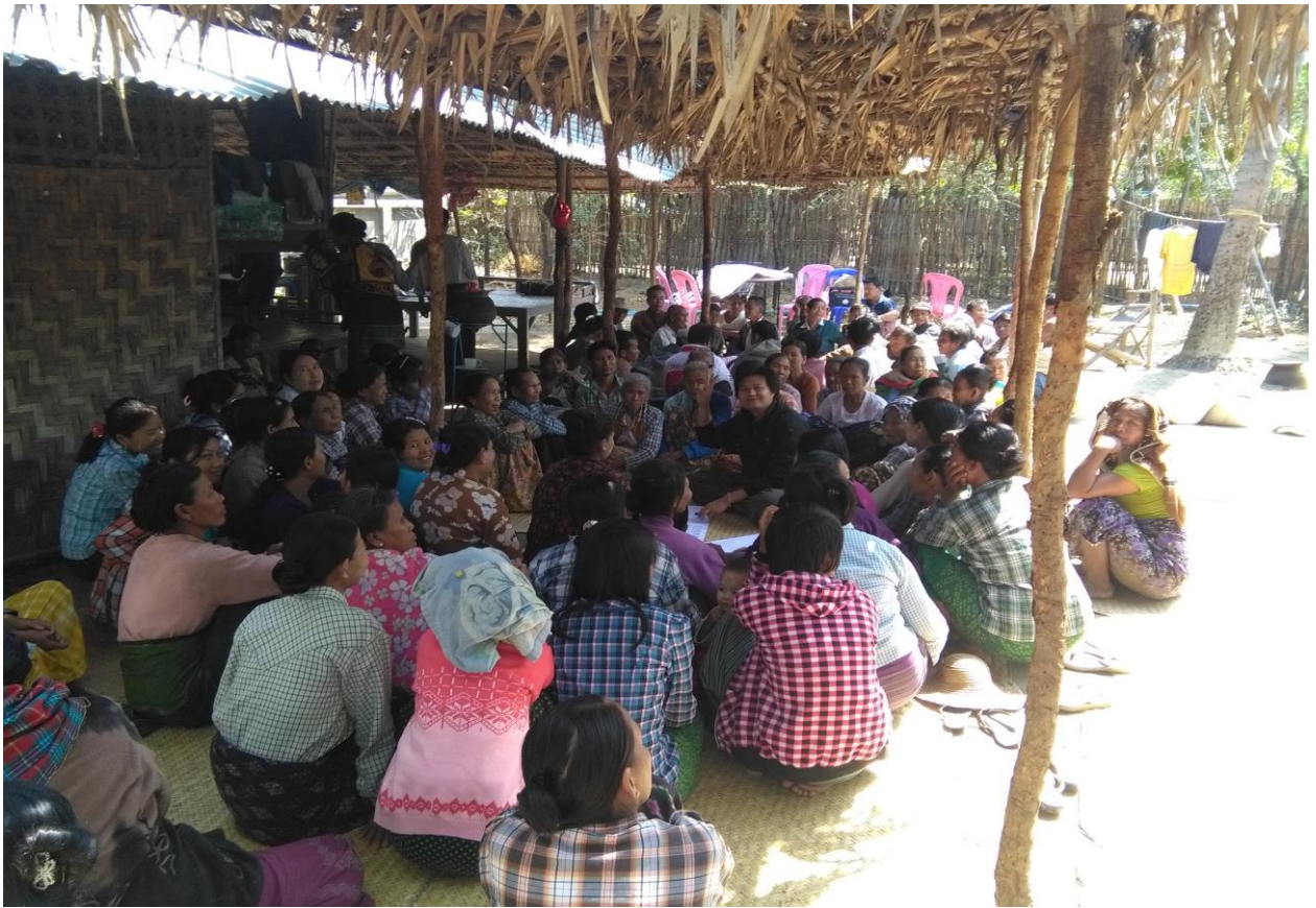
အမျိုးသမီးများ၏ ကျေးရွာဖွံ့ဖြိုးရေးလုပ်ငန်းများ ဆွေးနွေးမှုမှတ်တမ်းခါတ်ပုံ