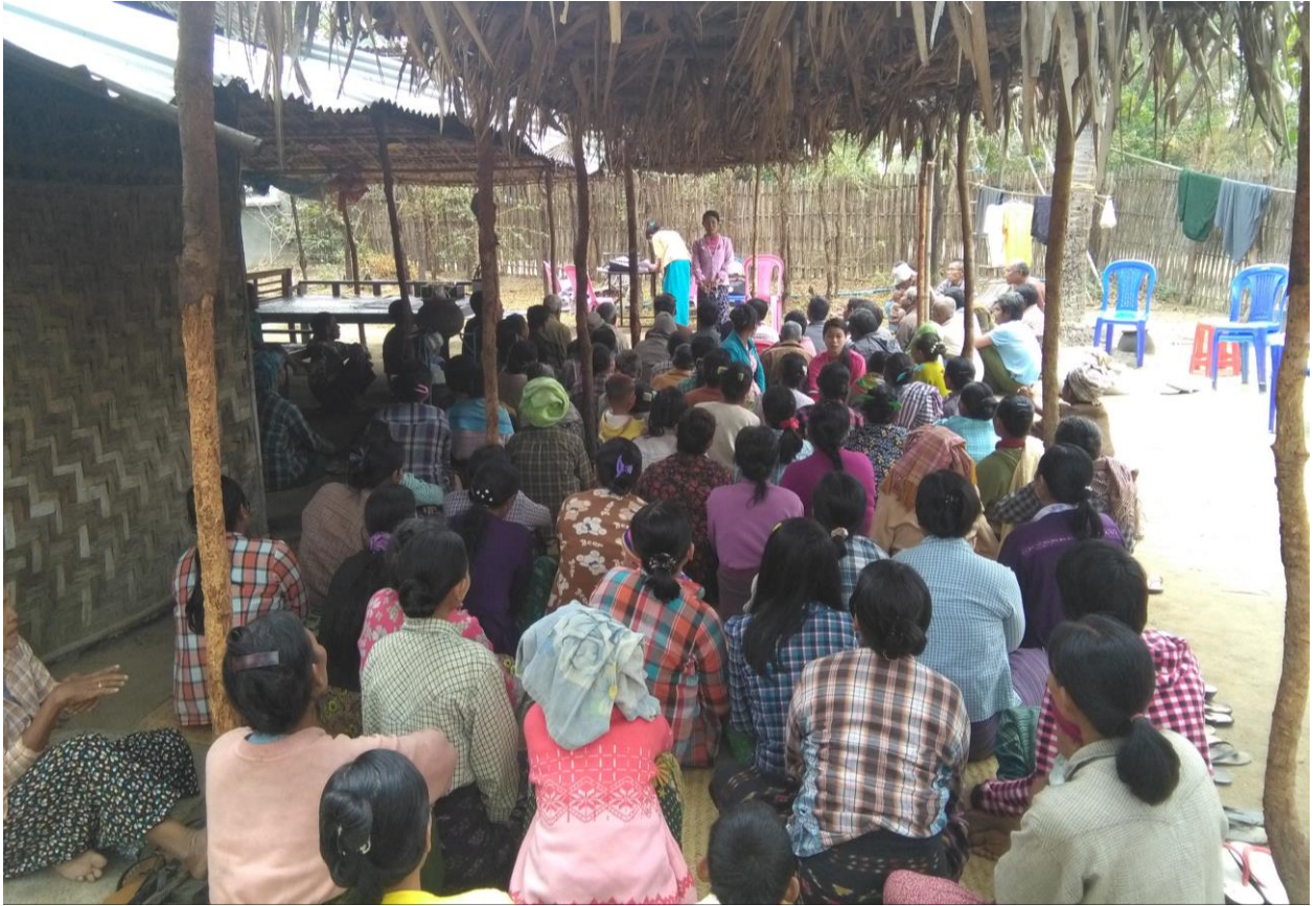
ပထမအကြိမ် ကျေးရွာအစည်းအဝေး ဆောင်ရွက်မှုမှတ်တမ်းဓာတ်ပုံများ