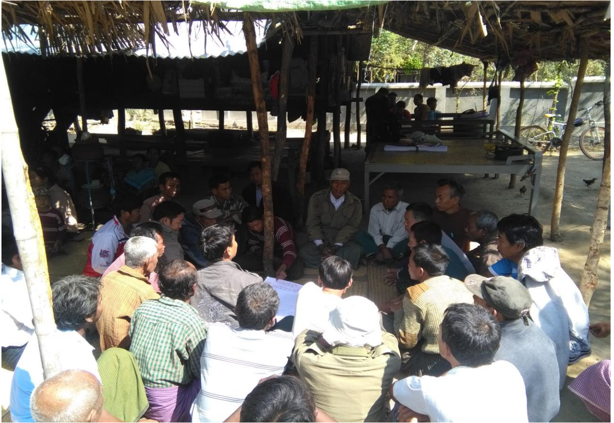
လူမှုဆန်းစစ်ခြင်းလုပ်ငန်းစဉ်များ ဆွေးနွေးမှုမှတ်တမ်းခါတ်ပုံ