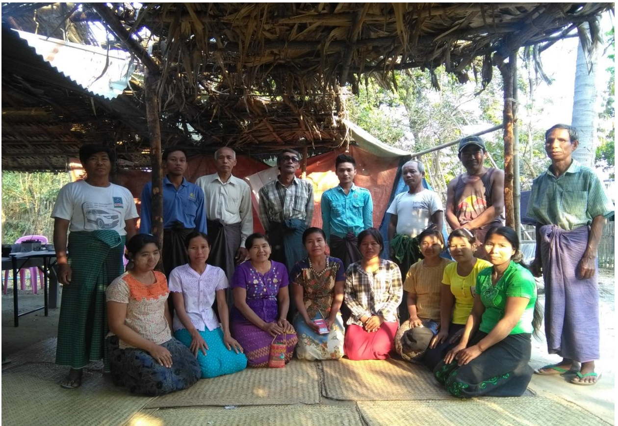
ကျေးရွာစီမံခန့်ခွဲမှုအဖွဲ့ဝင်များ ဖွဲ့စည်းမှုမှတ်တမ်းဓါတ်ပုံ