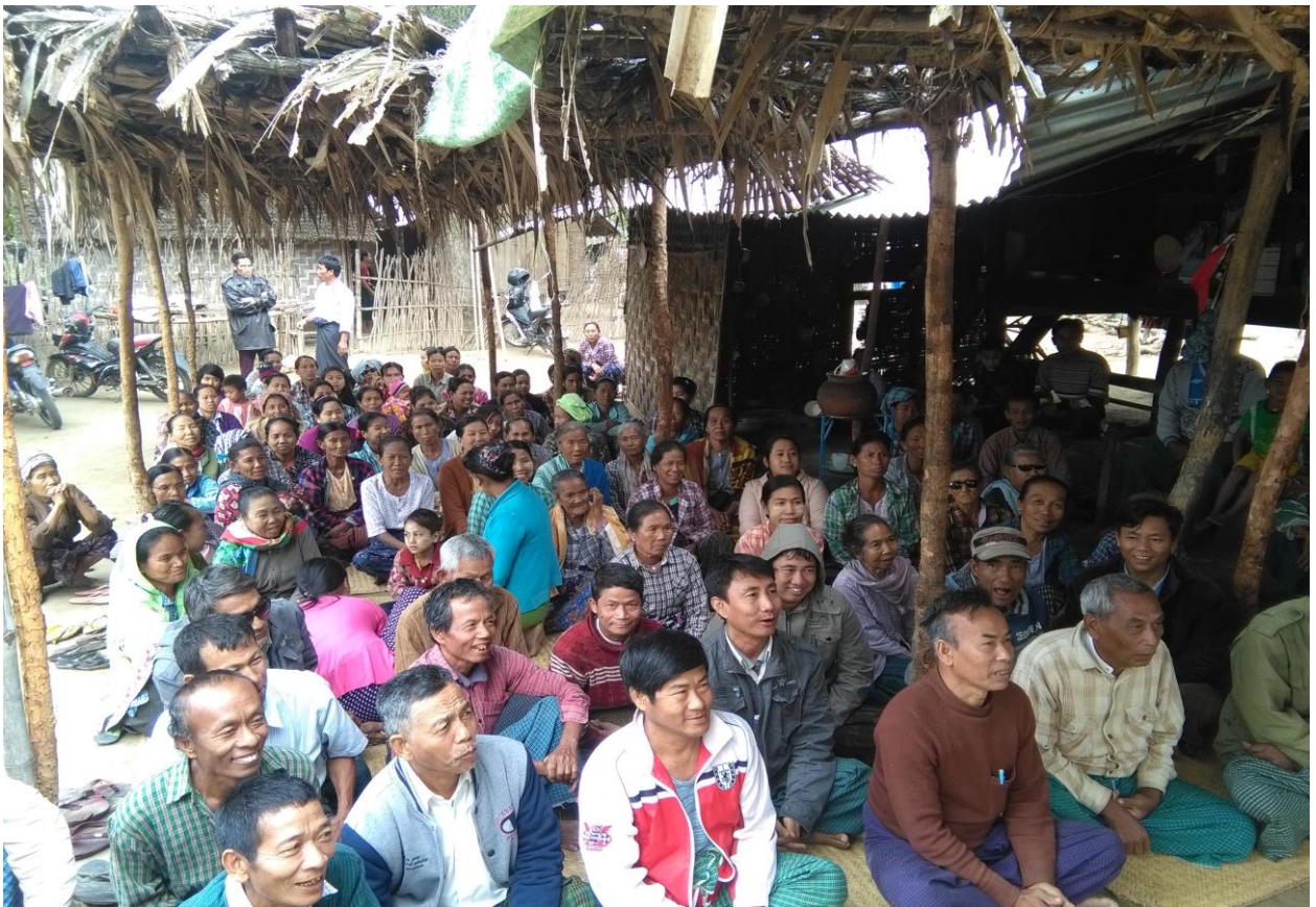
ပထမအကြိမ် ကျေးရွာအစည်းအဝေး ဆောင်ရွက်မှုမှတ်တမ်းဓာတ်ပုံများ