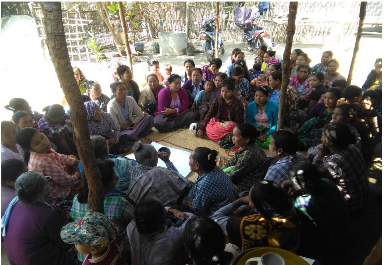
လူမှုဆန်းစစ်ခြင်းလုပ်ငန်းစဉ်များ ဆွေးနွေးမှုမှတ်တမ်းခါတ်ပုံ