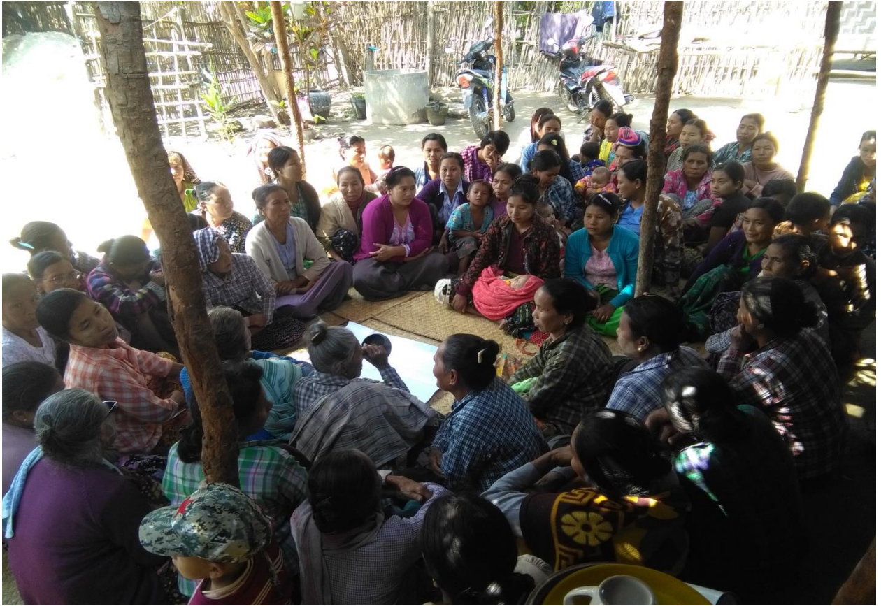
ဒုတိယအကြိမ် ကျေးရွာအစည်းအဝေးဆောင်ရွက်မှုမှတ်တမ်းပုံ