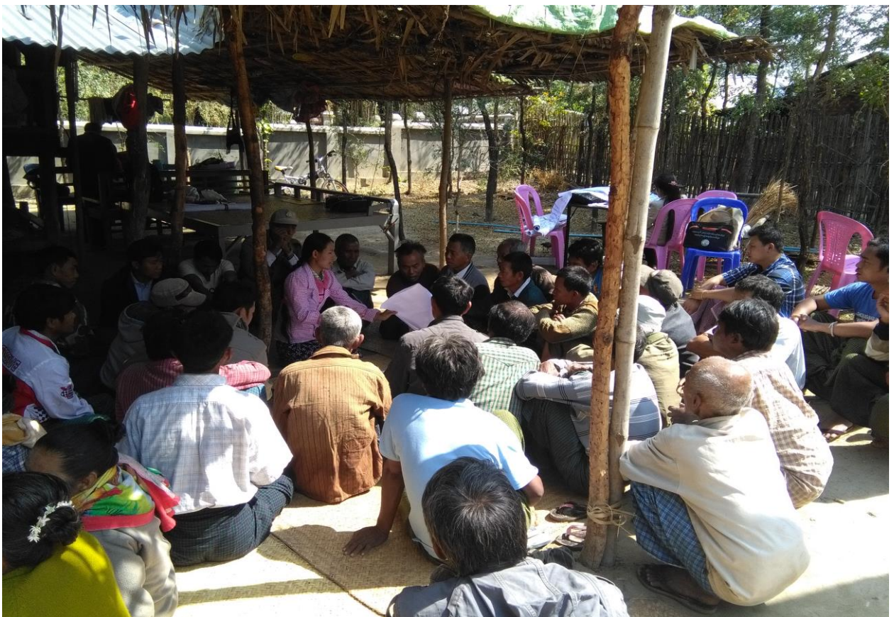
အမျိုးသားများ၏ ကျေးရွာဖွံ့ဖြိုးရေးလုပ်ငန်းများ ဆွေးနွေးမှုမှတ်တမ်းခါတ်ပုံ