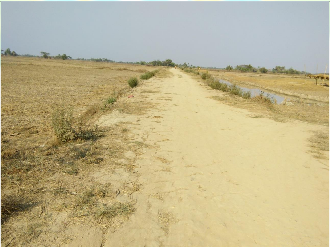
လုပ်ငန်းခွင်အပြုလုပ်မီမှတ်တမ်းဓာတ်ပုံ