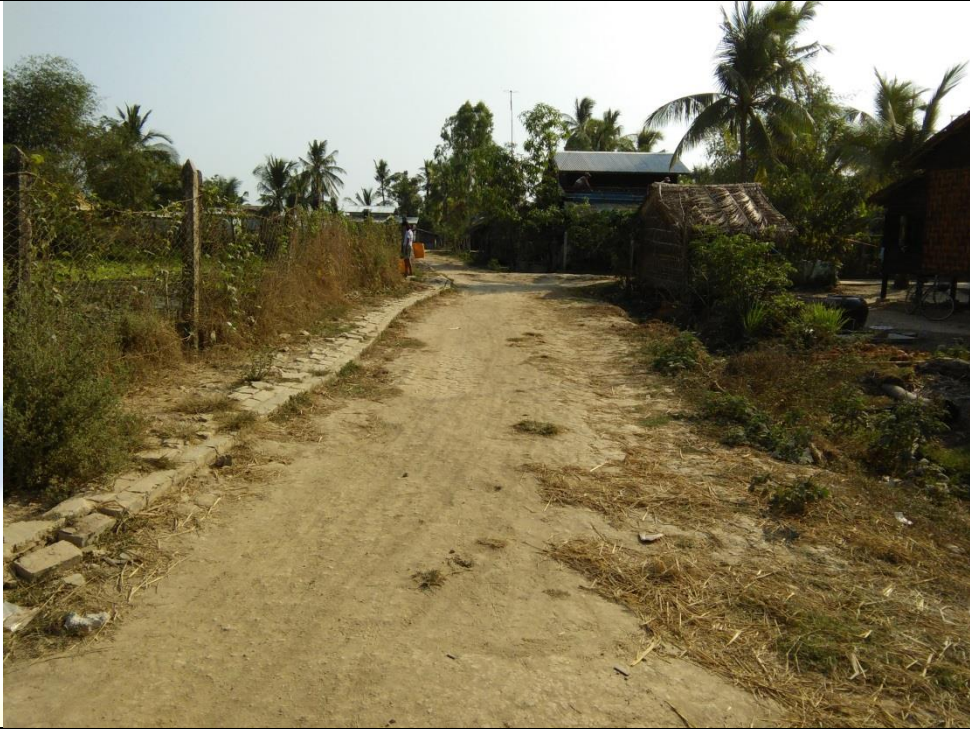
လုပ်ငန်းခွင်အပြုလုပ်မီ မှတ်တမ်းဓာတ်ပုံ