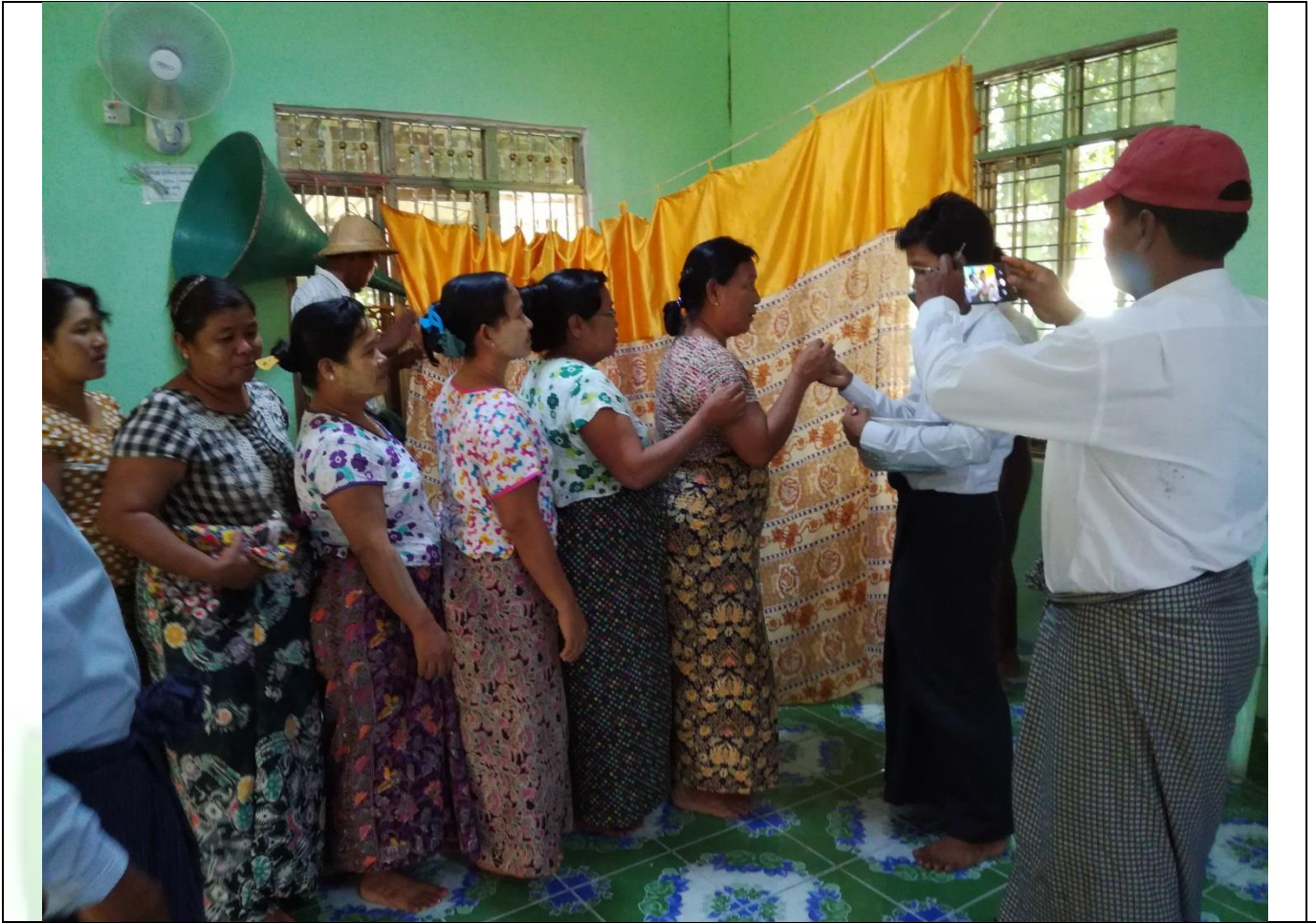
ကော်မတီရွေးချယ်ခြင်း မှတ်တမ်းခတ်ပုံ