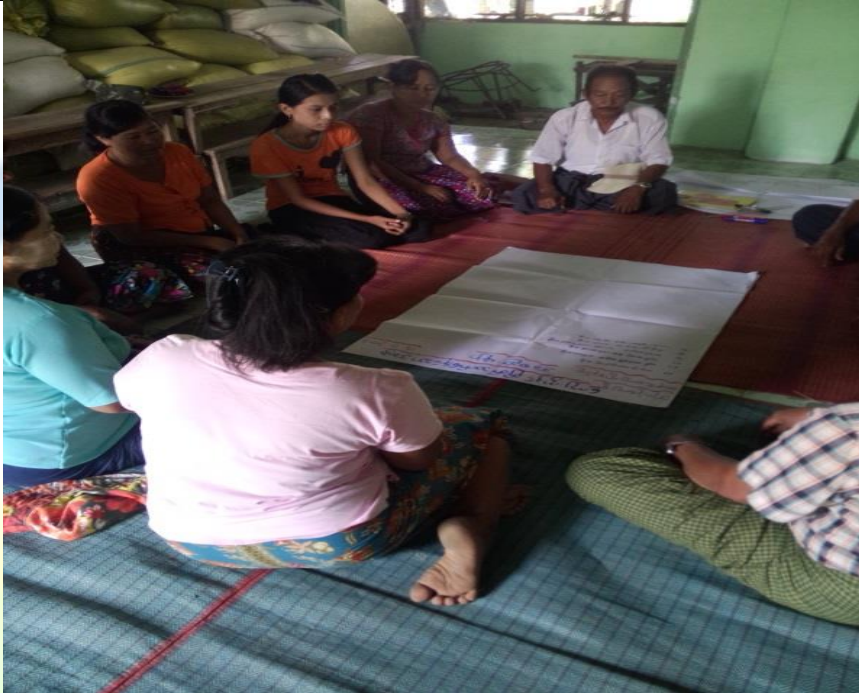
အမျိုးသမီးအုပ်စု၏ မှတ်တမ်းခါတ်ပုံ