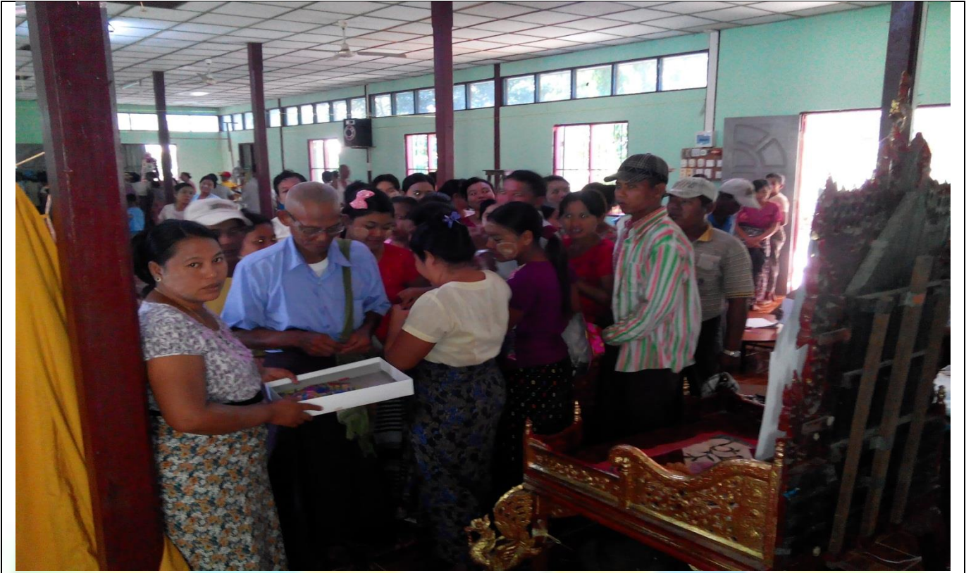
ကော်မတီရွေးချယ်ခြင်း မှတ်တမ်းဓာတ်ပုံ