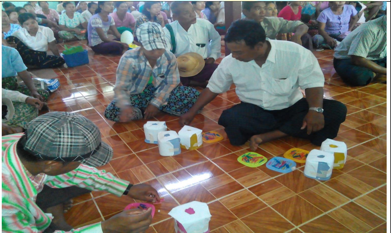
စေတနာ့ဝန်ထမ်းများ ရွေးချယ်ခြင်းမှတ်တမ်းဓာတ်ပုံ