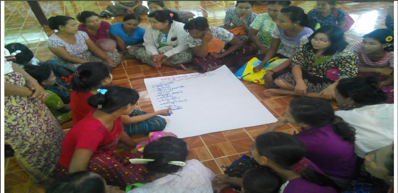
အမျိုးသမီးအုပ်စု၏ မှတ်တမ်းဓါတ်ပုံ