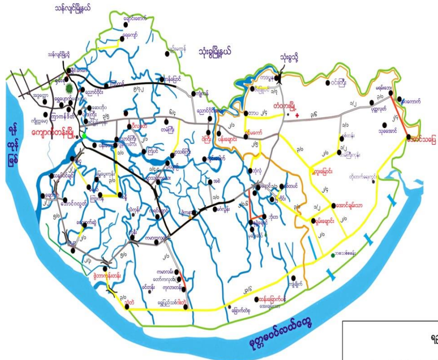
ကျောက်တန်းမြို့နယ်ရှိ ကျေးရွာများ အခြေပြမြေပုံ