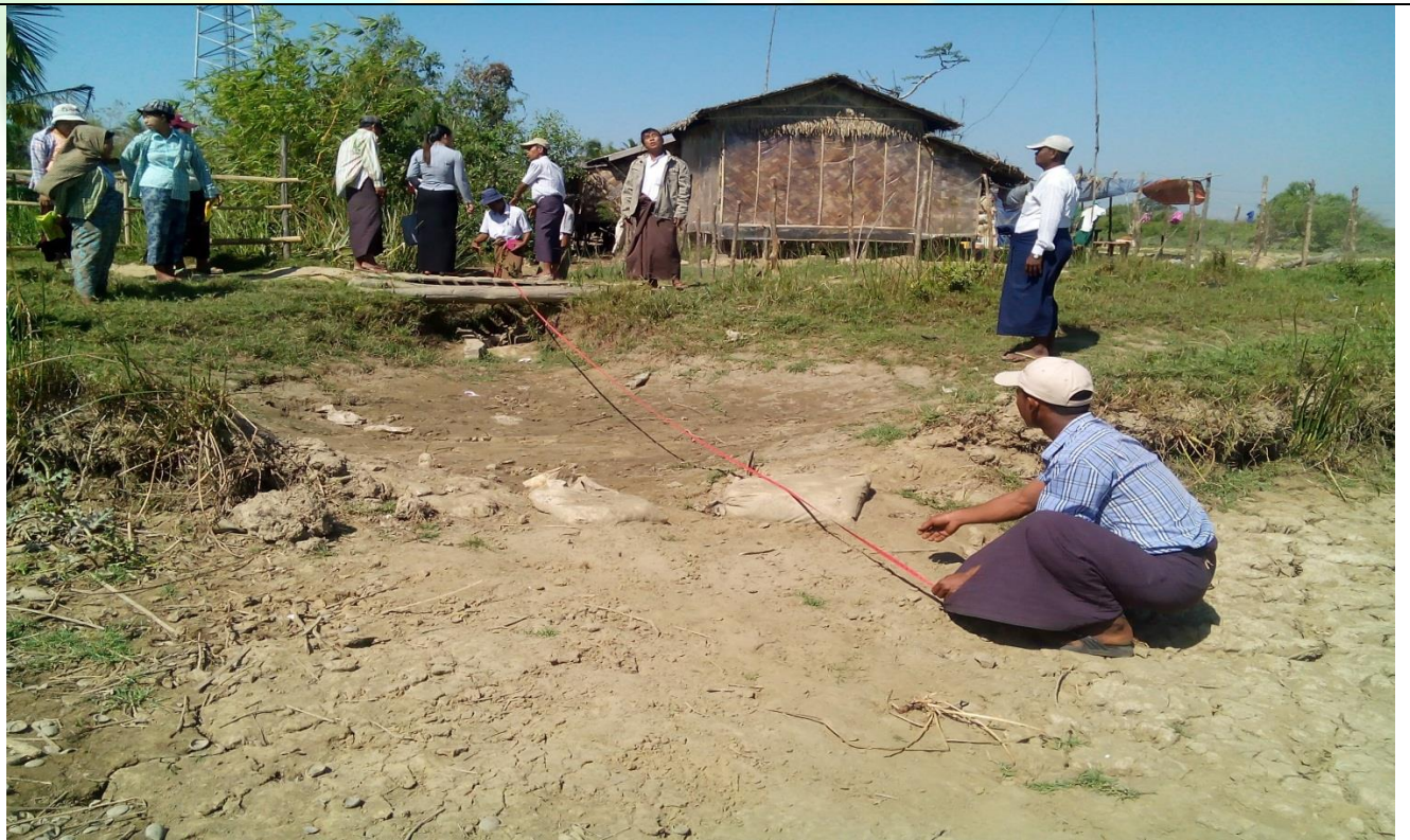
လုပ်ငန်းခွဲ၏မပြုလုပ်မီမှတ်တမ်းခါတ်ပုံ