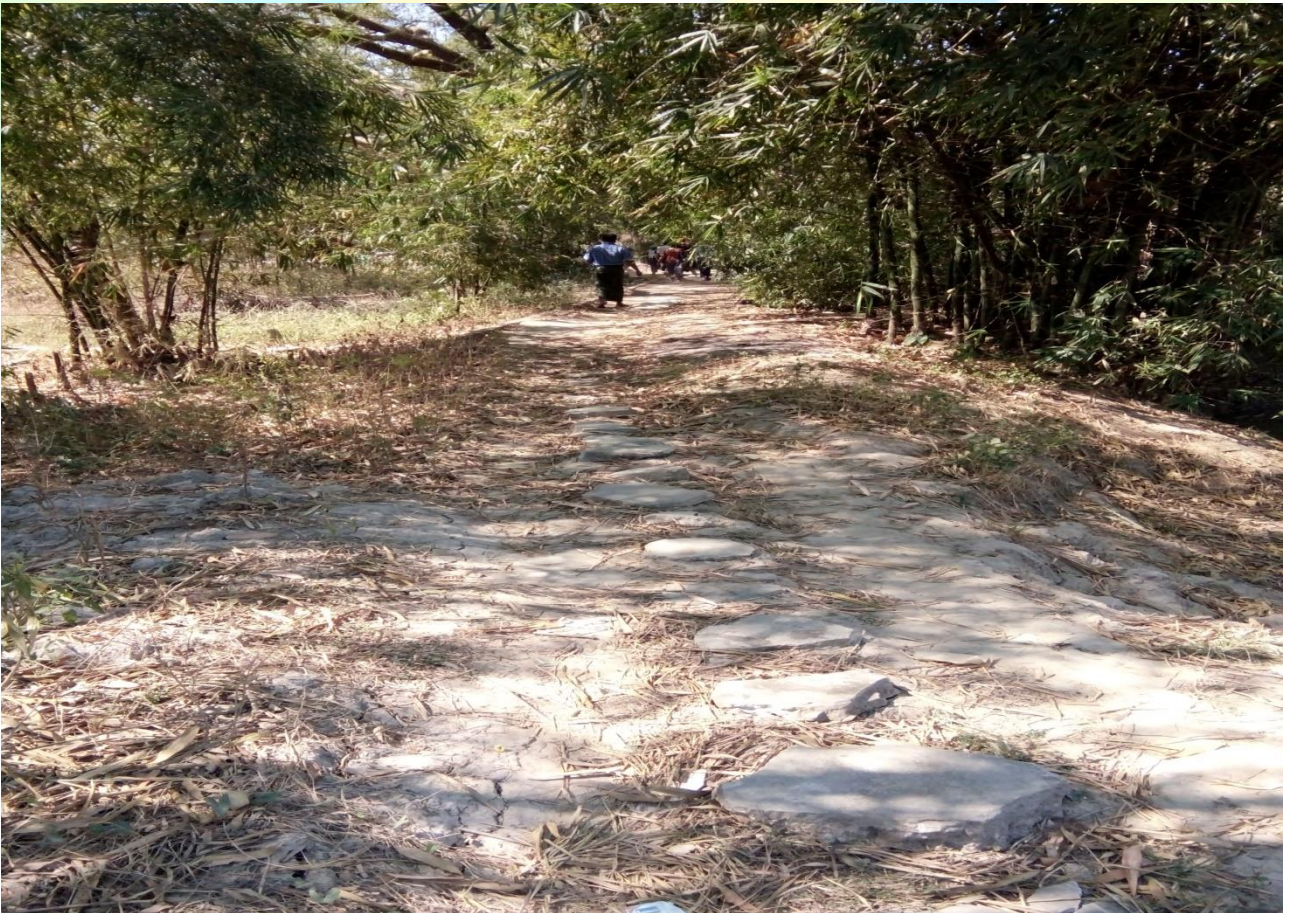
လုပ်ငန်းခွဲမပြုလုပ်မီမှတ်တမ်းဓာတ်ပုံ