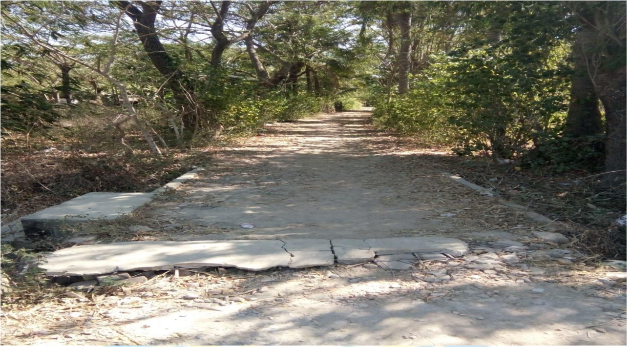
လုပ်ငန်းခွဲမပြုလုပ်မီ မှတ်တမ်းဓာတ်ပုံ