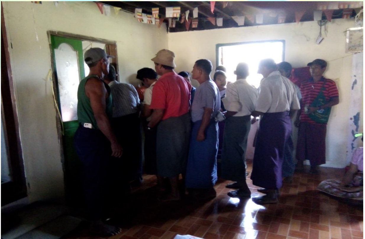
ကော်မတီရွေးချယ်ရန် မဲပေးခြင်း မှတ်တမ်းခါတ်ပုံ