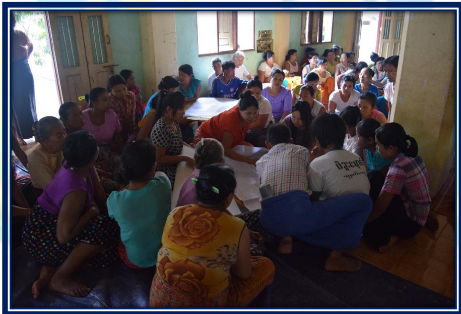
ကျေးရွာဖွံ့ဖြိုးတိုးတက်ရေး လုပ်ငန်းအကောင်အထည်ဖော်မှုအစီအစဉ် (ကွမ်လှာကျေးရွာအုပ်စု၊ ကွမ်လှာကျေးရွာ)