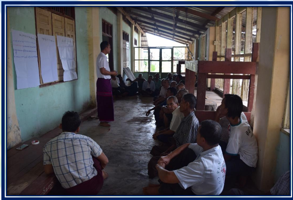
ကျေးရွာဖွံ့ဖြိုးတိုးတက်ရေး လုပ်ငန်းအကောင်အထည်ဖော်မှုအစီအစဉ် (ကွမ်လှာကျေးရွာအုပ်စု၊ ကွမ်လှာကျေးရွာ)